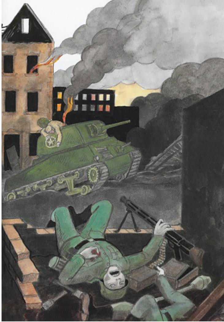
Annexe 7.c : extrait de la page 19