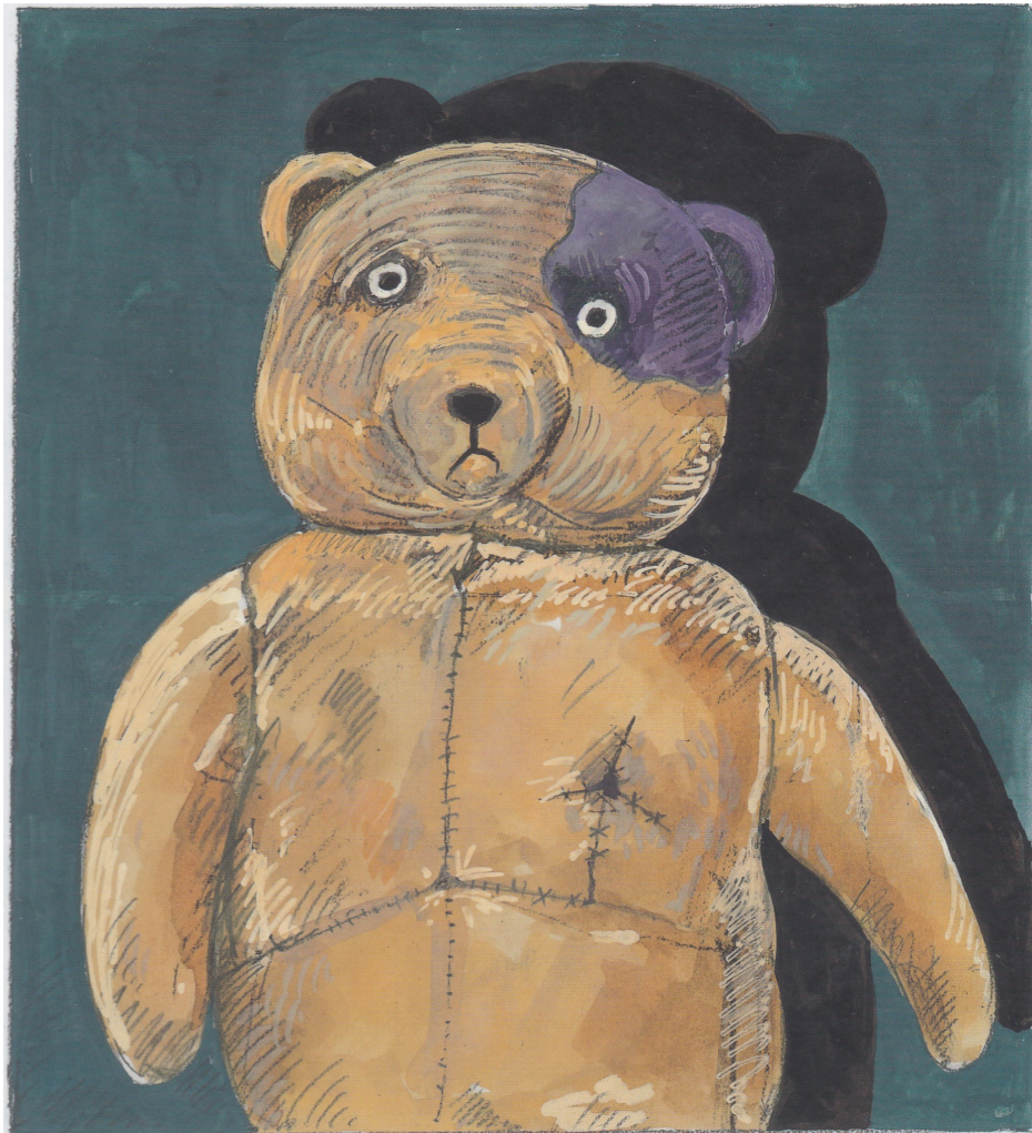
Annexe 7.a : image de couverture