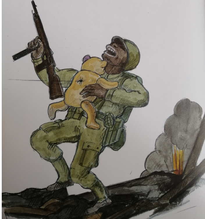
Annexe 7.d : extrait de la page 20

Il me souleva. À cet instant précis, je sentis une douleur fulgurante me traverser le corps. Le soldat, qui me tenait contre sa poitrine, s'effondra en gémissant. Nous avions été touchés par la même balle.