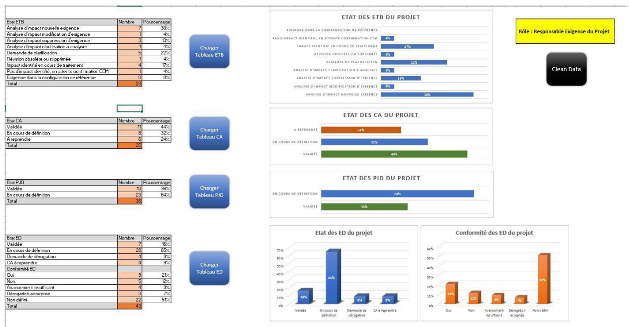
Figure 6 : Capture de l'onglet des tableaux de bord de l'application

L'outil Excel ne peut être utilisé qu'après le chargement en mémoire de la totalité des données provenant de Teamcenter. Ce chargement peut être relativement long notamment pour les projets comprenant un grand nombre d'exigences. Afin d'améliorer ce point, j'ai mis en place un système de filtres avant le chargement en mémoire qui permet ainsi de limiter le nombre d'exigences à charger et donc de diminuer le temps d'attente.