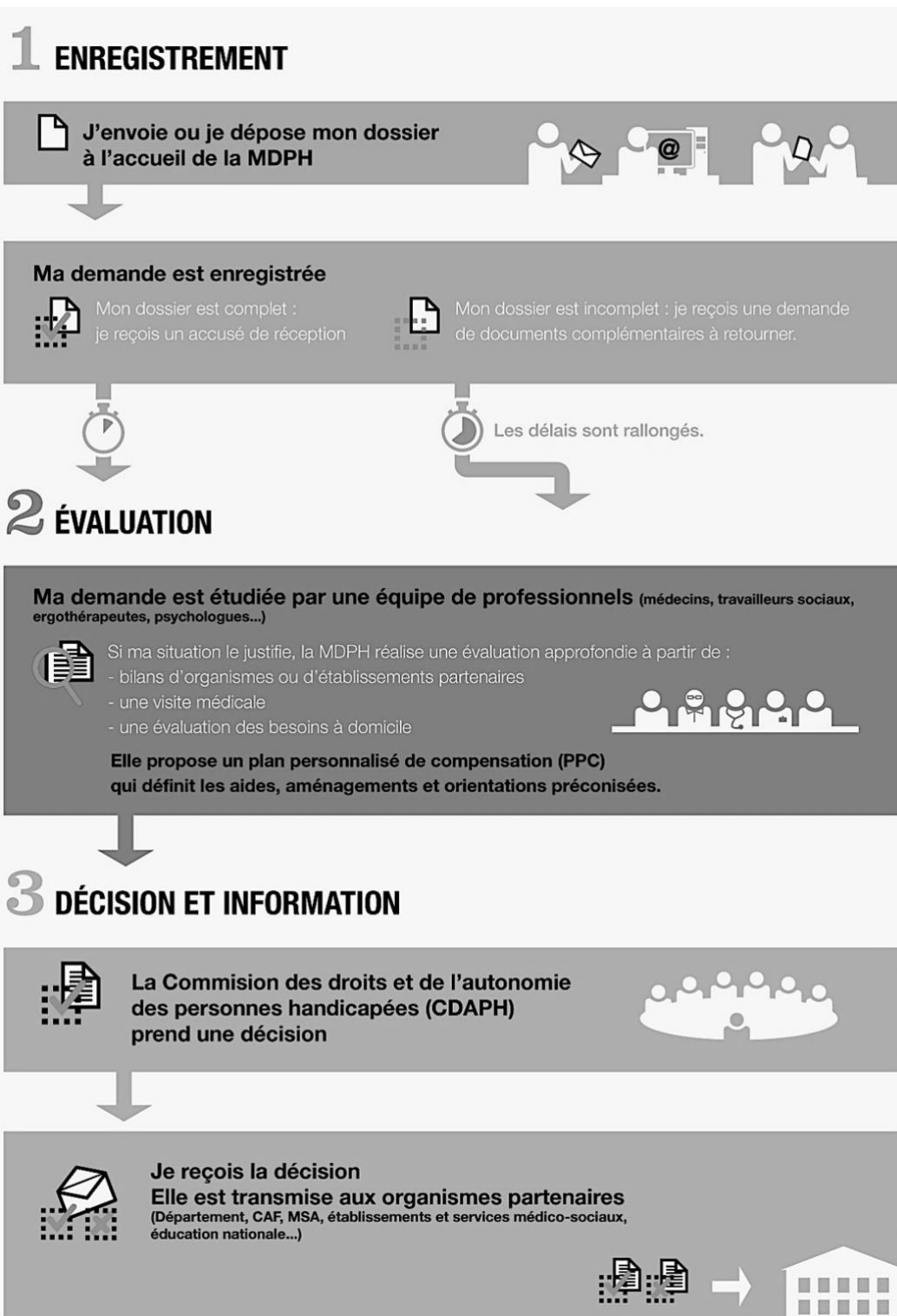
Figure 1 : Le parcours d'un dossier MDPH