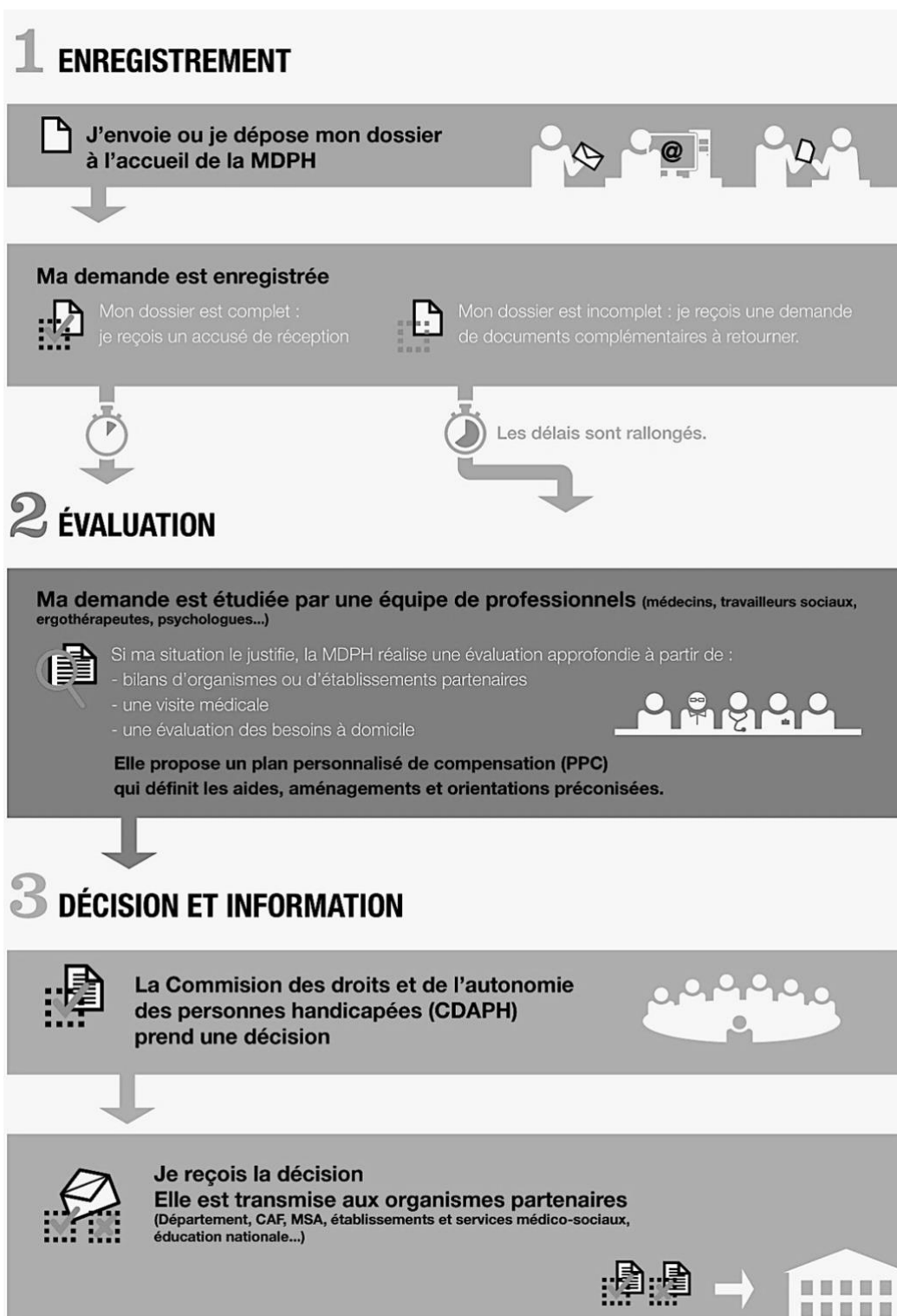
Figure 1 : Le parcours d'un dossier MDPH