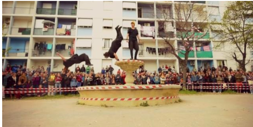
Photographie n°8 : Zéro Degré , compagnie La Fabrique Royale, samedi 9 avril 2016.

forcément vu avec clarté l'action présentée. Sur cette musique, les spectateurs pouvaient reproduire certaines figures montrées par les freerunners, cette action proposée au public, peut être perçue comme une mise en danger, comme si le spectateur voulait modifier son déplacement, la perception de son environnement, son mode de vie et renouveler sa manière d'être dans un espace public lié à son quotidien. Le spectateur effectue cette action, malgré le fait que la zone soit rubalisée et donc considérée comme dangereuse.