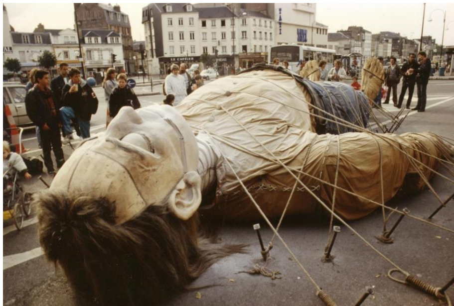
Photographie n°1 : photographie d'archive de la presse normande, recueillie sur https://www.paris-normandie.fr/ouverture/les-geants-de-royal-de-luxe-sur-la-route-du-havre-EE9978240 , [consulté le 21/11/18].

Pour Jean-Luc Courcoult, il est important que le spectacle continue de vivre après la représentation. L'espace urbain doit garder une trace de la création, les personnes ayant participé (volontairement ou non) à l'événement peuvent ainsi en parler, et faire perdurer le souvenir des géants. « La Saga des Géants » fait rêver le spectateur, elle suscite l'émotion, l'interaction, et transforme l'espace quotidien. En dépit du caractère factice des marionnettes construites en bois et manipulées par des techniciens, le public éprouve de la sympathie pour elles. Le Géant est intégré et considéré comme un habitant, un être vivant. « La Saga des Géants » joue sur la frontière entre fiction et réalité (photographies n°1 et 2).