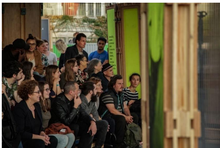
Photographie n°12 : L'Immobile, compagnie KompleXKapharnaüm, le 12 octobre 2018, ©Vincent Muteau et Julien Penichost.