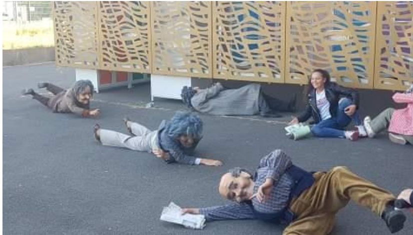
Photographie n°19 : Quartier Libre !, compagnie Planet pas Net, le 28 septembre 2018. Sur cette photographie, une collégienne se prête à la situation proposée par les comédiens.

improvisent de nombreuses situations en harmonie avec la nature. Certains collégiens prennent part à ces situations, observent, interviennent et échangent avec les personnages (photographies n° 21, 22 et 23).