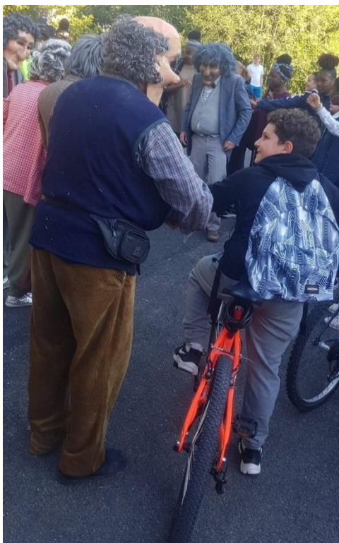
Photographie n°23 : Quartier Libre ! , compagnie Planet pas Net, le 28 septembre 2018. Un échange entre un collégien et un personnage prend forme, malgré l'absence de dialogue.