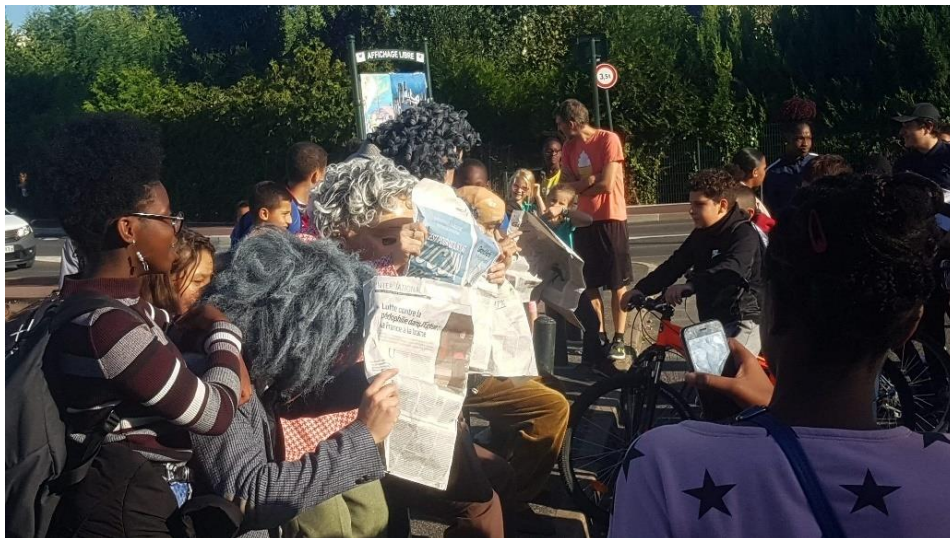
Photographie n°20 : Quartier Libre !, compagnie Planet pas Net, le 28 septembre 2018, ©Danet Joffrey.