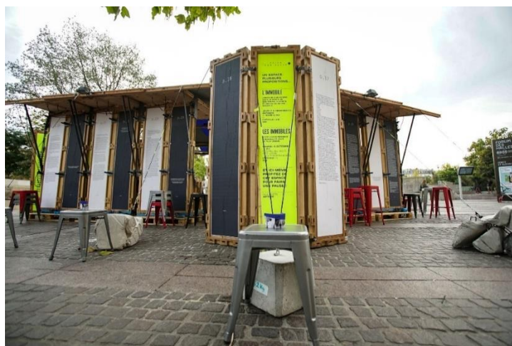
Photographie n°11 : L'Immobile, compagnie KompleXKapharnaüm, le 12 octobre 2018, ©Vincent Muteau et Julien Penichost.

rester à l'intérieur. Rester dehors, ne pas prendre place sous l'entresort ne permet pas au spectateur de capter l'intégralité des paroles et le jeu du comédien, ainsi que de percevoir les effets de lumière et l'arrivée des complices 72 (photographie n°14). Une toile transparente est dressée en fond de scène (photographie n°15) et permet aux spectateurs de pouvoir regarder ce qu'il se passe dans l'espace public durant la représentation.