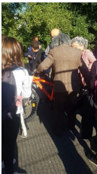
Photographie n°24 : Quartier Libre !, compagnie Planet pas Net, le 28 septembre 2018, ©Danet Joffrey.

C'est par l'interaction que passe la participation. Ainsi, lorsque les personnages prennent le vélo d'un collégien (photographie n°24), celui-ci va les aider à monter dessus, les gronder car ils ne veulent pas le lui rendre. Un échange direct est mis en place entre l'adolescent et les personnages.