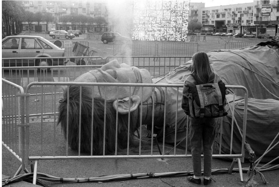
Photographie n°2 : ©Royal de Luxe, https://royal-de-luxe.com/fr/les-creations/saga-des-geants/# , [consulté le 21/11/18].

Sur la première photographie, on peut voir que le public se rassemble autour de la marionnette, afin d’observer la forme de celle-ci, sa manière de vivre. Certains détails, comme la fumée sortant de la bouche du Géant lorsqu’il dort (deuxième photographie), rendent le personnage vivant aux yeux du public.