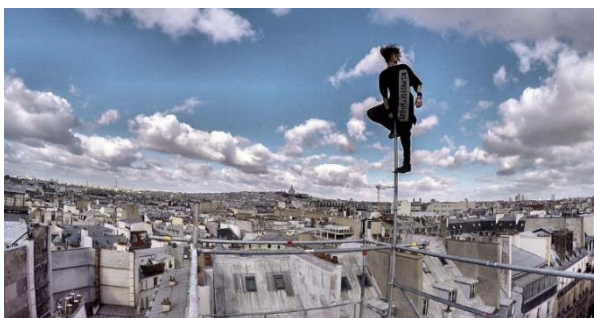
Photographie n°9 : figures sur les toits de Paris, compagnie La Fabrique Royale, ©La Fabrique Royale.