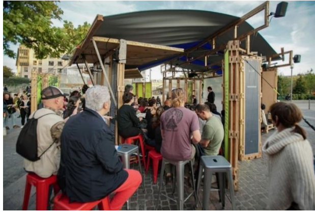
Photographie n° 13 : L'Immobile, compagnie KompleXKapharnaüm, le 12 octobre 2018, ©Vincent Muteau et Julien Penichost.