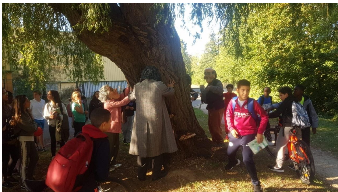
Photographie n°22 : Quartier Libre ! , compagnie Planet pas Net, le 28 septembre 2018, ©Danet Joffrey. À ce moment de la représentation, les collégiens ne sont que de simples observateurs des personnages.

Sur cette photographie un collégien est assis au bord de l'eau, comme les personnages. La place occupée par l'adolescent lui permet de voir les personnages de face, de percevoir leurs actions, donc de se rapprocher d'eux. Les autres spectateurs ne les voient que de dos et ne peuvent qu'imaginer ce qu'ils font.