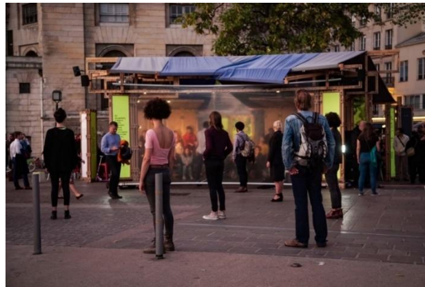
Photographie n° 14 : L'Immobile, compagnie KompleXKapharnaüm, le 12 octobre 2018, ©Vincent Muteau et Julien Penichost.