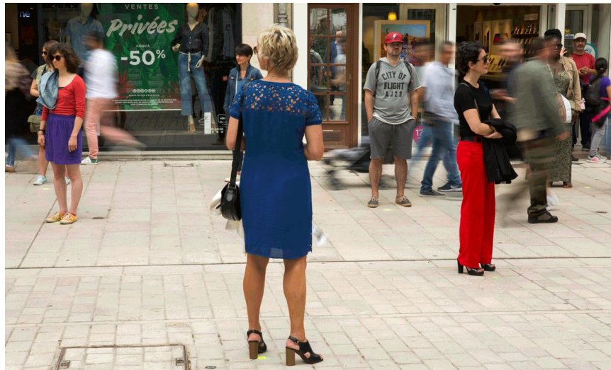
Photographie n°27 : Les Immobiles, compagnie KomplexKapharnaüm, le 16 juin 2018.

Les Immobiles propose aux participants de rester debout, immobile sur un point dessiné à la craie sur le sol pendant une heure trente (photographie n°27). Je suis restée immobile quarante-cinq minutes. Durant les dix premières minutes, je me suis retrouvée seule, focalisée sur l'espace qui m'entourait : les personnes se trouvant à proximité de moi, les bruits tels que le vent des arbres ou des bribes de discussion des passants. Un ami qui m'accompagnait et qui ne voulait pas participer à l'expérience m'a ensuite rejoint. Ma focalisation était donc différente, me concentrant plus sur la discussion que je pouvais avoir avec lui, que sur ce qu'il se passait autour de moi. Au bout de quarante-cinq minutes, j'ai cessé mon immobilisation pour les raisons suivantes : à l'instant où j'ai pris conscience que mon amie ne se trouvait plus sur son point, ainsi que par le besoin de partager cette expérience avec elle. Lorsque j'ai repris le mouvement, je me suis aperçue que j'étais seule, les personnes se trouvant à proximité de mon point avaient déjà cessé l'expérience. Le constat que j'ai fait était le suivant : rester immobile dans un espace sans cesse en mouvement est compliqué, le corps du participant aimerait rejoindre le flux, le corps aimerait retrouver sa liberté de bouger et de se déplacer. Cependant, chaque participant perçoit l'expérience de manière différente.