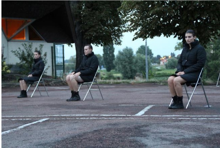
Photographie n°17 : Trafic, collectif Plateforme, Chalon dans la rue juillet 2017, ©Samuel Bon.