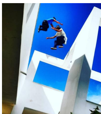
Photographie n°10 : figures sur le toit d'un hôtel en Grèce, compagnie La Fabrique Royale, ©La Fabrique Royale.

L'éclatement du public dans l'espace de la représentation, autorise un échange verbal entre les spectateurs et permet d'entendre les réactions et les avis sur ce qui se déroule. La déambulation, quant à elle, donne lieu à un rythme de marche et une vision différente de l'espace propre à chaque spectateur. Celui-ci n'étant pas obligé de regarder en direction des artistes, il peut tout aussi bien se focaliser sur un autre aspect de l'espace qui l'interroge. Néanmoins, la déambulation peut devenir un inconvénient, lorsque les freerunners effectuent une action en hauteur, tous les spectateurs ne peuvent pas les voir, ce qui est l'une des conséquences de la vision éclatée de l'assistance sur l'espace et sur ce qui l'entoure. Chacun ne percevant pas les mêmes détails que l'autre, le regard n'est pas figé, mais en constant changement de focalisation, d'orientation et de cible.