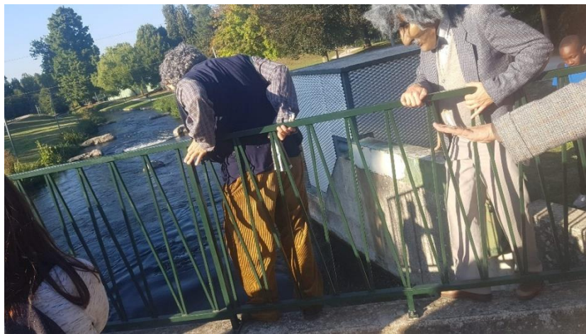
Photographie n°26 : Quartier Libre !, compagnie Planet pas Net, le 28 septembre 2018, ©Danet Joffrey.

Au début de mon travail sur Quartier Libre ! , je voulais parler du terme de « spectateur/auteur ». Mais en poursuivant mes recherches, je me suis rendue à l'évidence que ce serait une erreur de dire que le spectateur peut devenir auteur de la création. En effet, le projet a été pensé au préalable, même si les comédiens ont recours à l'improvisation dans les différents espaces. Il serait plus juste de dire que le spectateur contribue à la création à travers sa propre expérience du dispositif. Le hasard joue un rôle important dans le dispositif de représentation de Quartier Libre ! . En effet, la déambulation dans l'espace public est une prise de risque, à cause de la météo et des autres personnes présentes dans le lieu par hasard. Le spectateur génère lui aussi une forme de hasard et d'improvisation, puisque les comédiens