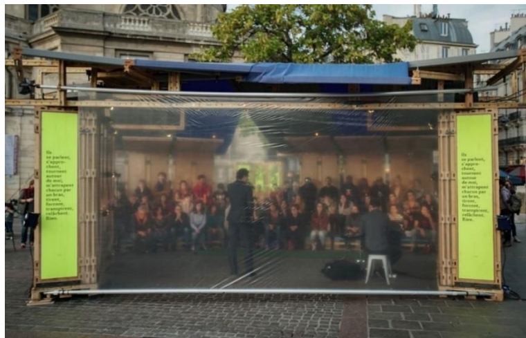
Photographie n° 15 : L'Immobile, compagnie KompleXKapharnaüm, le 12 octobre 2018, ©Vincent Muteau et Julien Penichost.