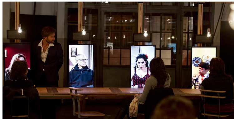
Photographie n°6 : Perhaps All the Dragons, collectif Berlin, le vendredi 21 juillet 2017, ©Marc Damage.

Perhaps All the Dragons donne la parole à des protagonistes dont la présence n'est pas physique, mais est dissimulée derrière un écran. Lors de la représentation, chaque spectateur écoute cinq récits. Voici un résumé des cinq histoires auxquelles j'ai assisté à Chalon en juillet 2017 :