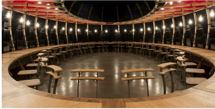
Photographie n°5 : Perhaps All the Dragons, collectif Berlin, le vendredi 21 juillet 2017, ©Marc Damage.