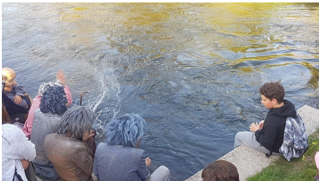
Photographie n°21 : Quartier Libre ! , compagnie Planet pas Net, le 28 septembre 2018, ©Danet Joffrey.

Sur cette photographie un collégien est assis au bord de l'eau, comme les personnages. La place occupée par l'adolescent lui permet de voir les personnages de face, de percevoir leurs actions, donc de se rapprocher d'eux. Les autres spectateurs ne les voient que de dos et ne peuvent qu'imaginer ce qu'ils font.