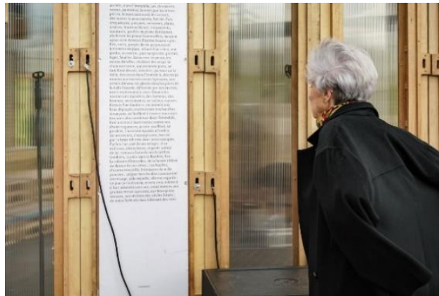
Photographie n°16 : L'Immobile , compagnie KompleXKapharnaïM, le 12 octobre 2018, ©Vincent Muteau et Julien Penichost.

Le dispositif de L'Immobile suscite la curiosité des passants, les pancartes de bois sur lesquelles sont disposés des extraits du texte éveillent l'intérêt (photographie n°16). Certains d'entre eux n'ayant pas connaissance qu'une performance a lieu se rapprochent de l'entresort, lisent des extraits du texte et parfois s'arrêtent, s'assoient, écoutent et regardent le spectacle. Ils peuvent être amenés le temps de quelques minutes, à entrer dans l'intimité du récit du comédien.