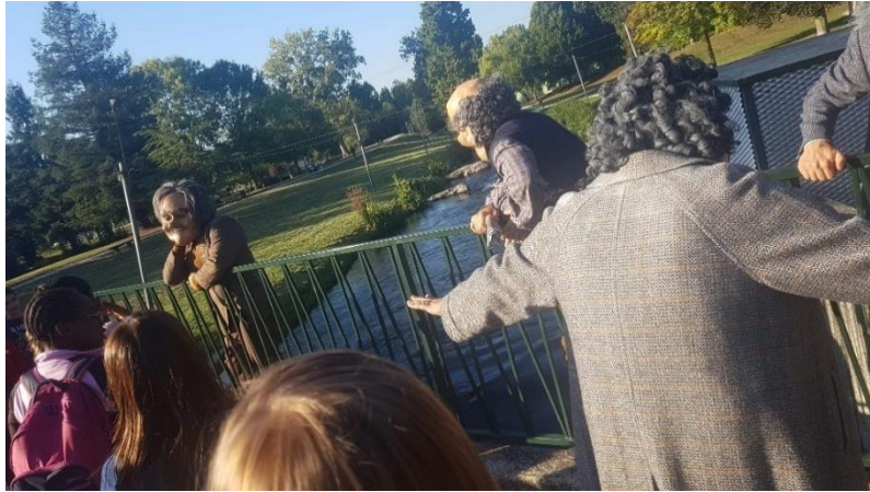
Photographie n°25 : Quartier Libre !, compagnie Planet pas Net, le 28 septembre 2018, ©Danet Joffrey.