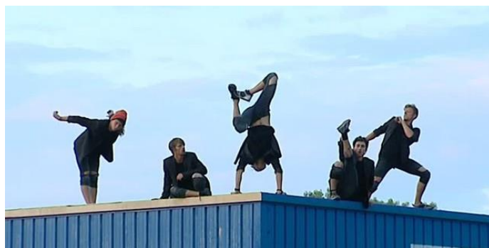
Photographie n°7 : Zéro Degré, compagnie La Fabrique Royale, représentation lors du festival de Chalon dans la rue en juillet 2017, ©France 3/Culturebox/capture d'écran.

Cette photographie représente un moment du spectacle, dans lequel les cinq artistes sont réunis, effectuant des figures différentes par rapport à leurs compétences et leurs spécificités. Lors de cette scène, le spectateur regarde l'ensemble d'un groupe, pas seulement un individu en particulier.