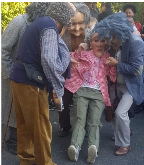
Photographie n°18 : Quartier Libre !, compagnie Planet pas Net, le 28 septembre 2018, ©Danet Joffrey.

Les collégiens exprimaient leur appréhension des personnages par des cris et des mouvements de foule. Ainsi, lorsque les comédiens se sont mis à courir vers le portail du collège, les élèves ont pris peur et se sont mis à courir aussi, sans faire attention aux autres spectateurs, ni à leurs camarades. La réaction des collégiens peut se comprendre par le fait qu'ils ne font pas la différence entre la réalité et la fiction.