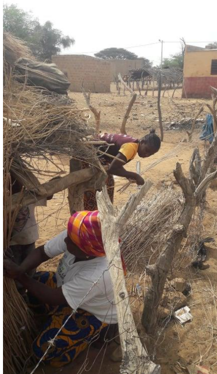
Image 4 – Une mère et sa fille en train de réparer leur tente à Widou bourg le 30/03/2019

Par « tâches individuelles », je ne sais pas si cette femme entend dire que les activités sont menées individuellement, mais c'est le cas de toutes les activités qui ne sont pas faites au sein d'un groupement, ou si elle entend dire que ce n'est pas dans l'intérêt de la communauté. Or, le tissage des tentes pour la chambre, le linge, le balayage sont des activités qui bénéficieront à toute la concession, comme en témoigne la photo suivante sur laquelle une femme répare avec sa fille l'une de leur tente.