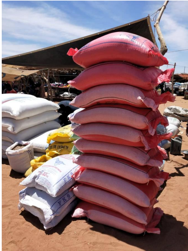
Image 1 – Aliment de complémentation pour le bétail.

Le riz, considéré avant les années 1970 comme un produit rare, s'est démocratisé suite à la sécheresse. Durant cette période, la vente du bétail servait à acheter du riz importé, dont le kilogramme valait, en 1972, 40 francs CFA d'après Abdou Ka. Progressivement, le riz remplace le mil dans le régime alimentaire des Sénégalais. Aujourd'hui, le riz est préféré au mil par les jeunes ménagères parce qu'il est facile à préparer :