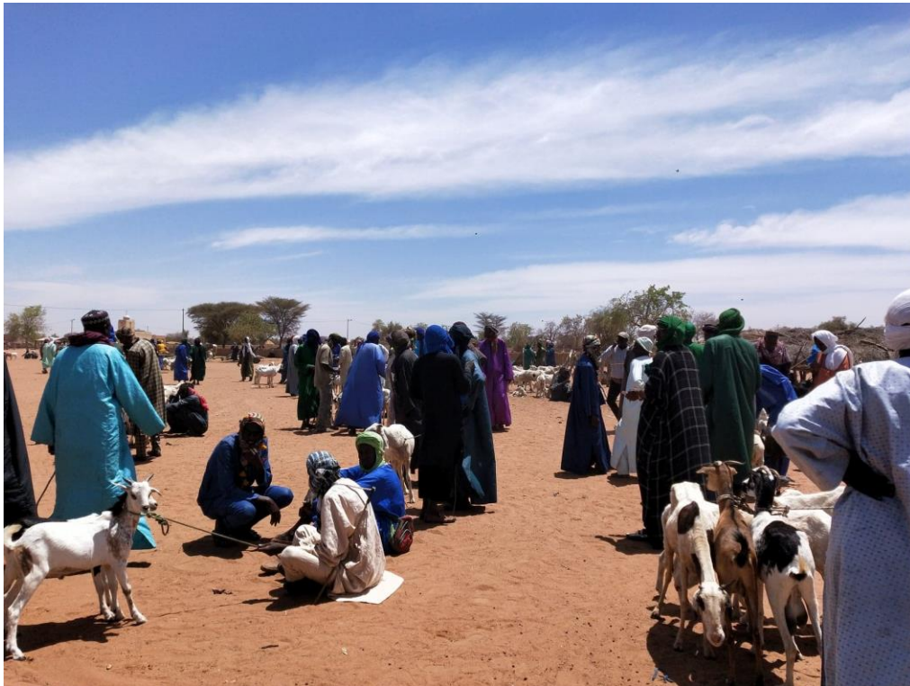
Image 8 – Marché à bétail de Widou Thiengoly, le 23/04/2019

Également, il faut souligner que rôle de la belle-mère au sein de la famille varie selon les membres qui la composent et est donc plus ou moins important selon les familles. Ainsi, il faut tout d’abord préciser qu’une femme ne peut se décharger sur ses belles-filles que dans les cas où la famille n’a pas été divisée en ménages, et que les fils vivent dans la même concession que leurs parents. Dans le cas où la famille a été divisée en ménages, et même si les fils et leurs femmes vivent avec elles, le rôle des belles-mères n’est pas si important, puisque les tâches et les ressources s’organisent au sein du ménage.