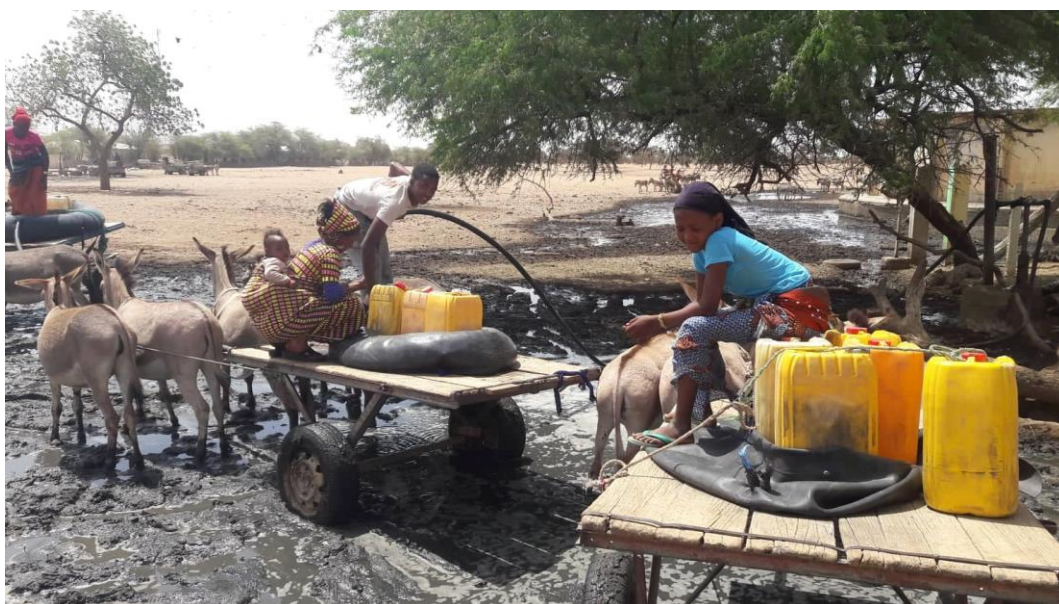
Image 6 – Femmes au forage de Widou Thiengoly transportant des bidons et des chambres à air sur une charrette

Pour transporter l'eau, les femmes utilisent des chambres à air, des grilles ou des bidons à eau qu'elles disposent sur une charrette tirée par un ou plusieurs ânes. Les chambres à air permettent de stocker plus d'eau et la charrette permet d'en transporter plus. C'est un gain de temps.