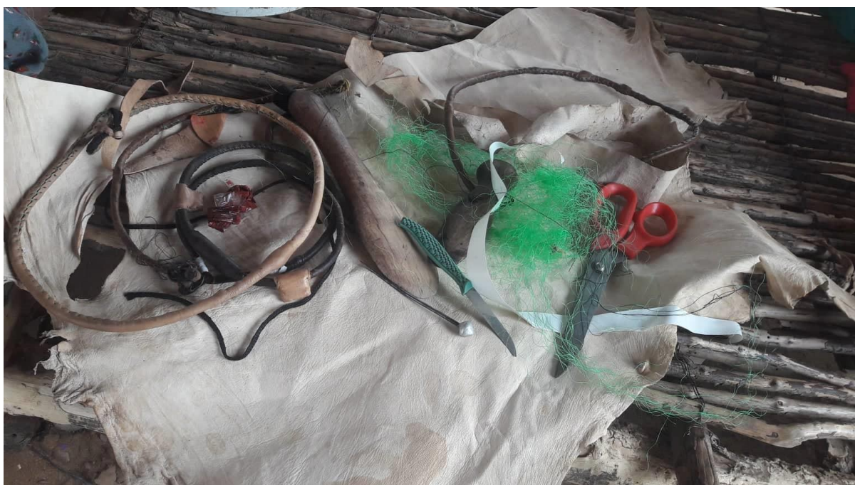
Image 7 – Outils pour la cordonnerie, le 30/03

Également, la Grande Muraille Verte embauche tous les ans pendant quelques mois des hommes et des femmes pour faire pousser les jeunes plants de la muraille :