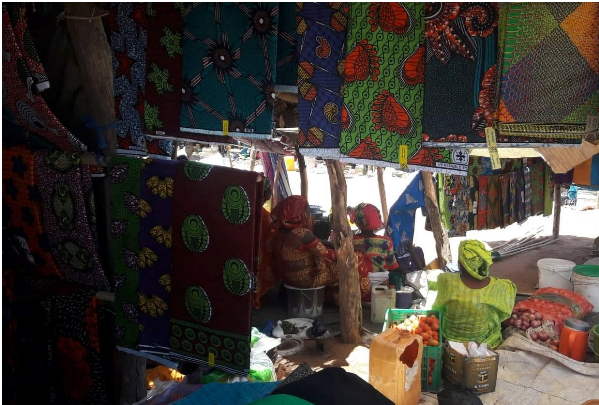
Image 2 – Etal de tissus, jour de marché à Widou Thiengoly le 23/04/2019

les habitants à dépenser de l'argent, s'apparente toutefois à celle d'une société où il est indispensable, pour vivre, d'avoir de l'argent.