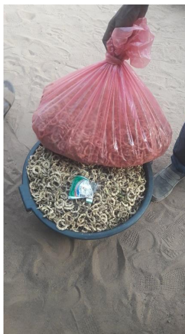
Image 3 – Fruits de cueillette destinés à la consommation des petits ruminants, le 30/03/2019

« Souvent, quand on n'a pas d'aliment pour le bétail, on donne ces produits-là, ces fruits de balanites aux vaches. », Femme de 56 ans, Bellel Bawambé