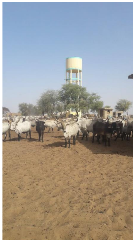
Image 5 – Forage de Widou Thiengoly, le 30/03/2019

Dans le Sahel, l'eau est une ressource particulièrement précieuse du fait de sa rareté. Elle sert à faire la cuisine, mais aussi à abreuver le bétail. En saison des pluies, les ressources en eau augmentent, tandis qu'en saison sèche, la satisfaction des besoins en eau ne repose que sur l'accès aux forages.