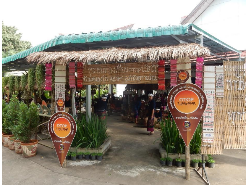
Figure 16 Journée de présentation du village dans le cadre du projet OTOP