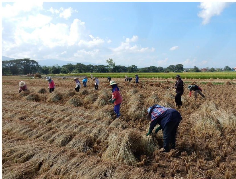
Figure 8 Formation des meules de riz

Après trois-quatre jours donc, les paysans reviennent dans le champ afin de faire des meules. De tout le cycle agricole, c'est l'étape qui réunit le plus de personnes : jusqu'à une bonne trentaine pour les plus grandes superficies (cf figure 8). Le travail rassemble femmes et hommes, mais il y a une division sexuelle des tâches. Le travail des femmes consiste à rassembler à l'aide d'une faucille les tiges de riz éparpillées à travers le champ en gerbes. Les hommes se saisissent ensuite de ces gerbes grâce à des sangles. Ils les portent à l'endroit du champ où toutes les meules vont être formées 24 , et où une bâche a été préalablement posée. Elle permet de récupérer une partie des grains de riz qui tombent des épis. Les gerbes sont disposées en cercle, en laissant un espace au centre. Les épis doivent se situer à l'intérieur du cercle, pour protéger le paddy d'éventuelles précipitations qui, à ce stade, l'abîment. Une fois un cercle complété, un autre est entamé juste au-dessus. La meule monte ainsi jusqu'à ce que l'on ne puisse plus atteindre le haut de la pile. Cette étape est utile dans la mesure où elle permet non seulement de protéger le paddy de la pluie mais également du vent. Cela sert enfin à rassembler en un endroit du champ la récolte facilitant ainsi l'étape suivante qu'est le battage du riz.