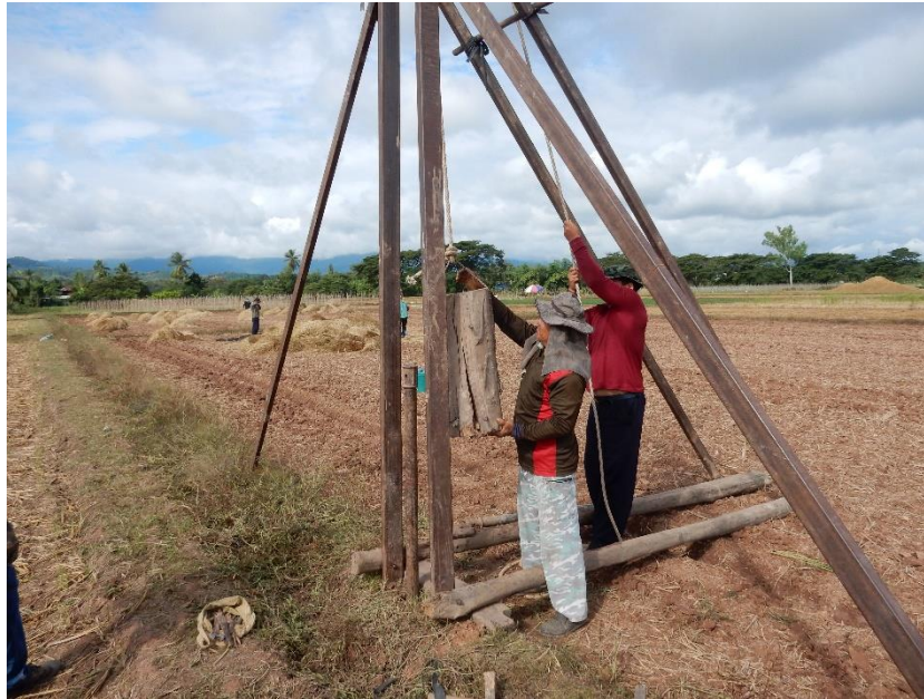
Figure 7 Forage pour atteindre une nappe phréatique

essentiellement), quand l'eau s'écoulant des différents canaux provenant des étangs est insuffisante. L'eau de surface ne suffit donc pas pour ces cultures.