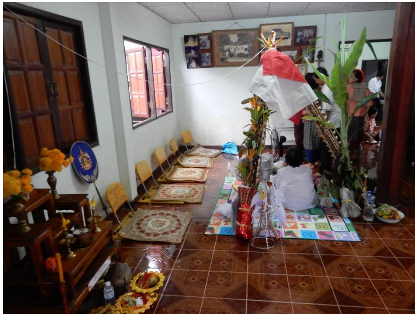
Figure 15 Le seupchata

Cette cérémonie vise à acquérir des mérites pour le foyer en question et à le protéger de tout type d'infortune, en expulsant les mauvaises choses. Il a aussi des fins thérapeutiques (Kaufman 1960). Selon les villageois, cette cérémonie pourrait aider la femme du foyer en question, souffrante depuis longtemps, à guérir. Il est à noter que cette cérémonie peut aussi être organisée à l'échelle du village ( ban en thaïlandais désigne aussi bien la maison que le village).