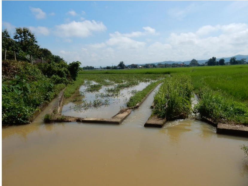
Figure 6 Séparation des rigoles du système d'irrigation

Shigeharu Tanabe explique que le système d'irrigation muang fai repose sur une organisation sociale spécifique qu'il contribue à maintenir (Tanabe 1994 : 31). Dans la mesure où le barrage et le réseau de canaux sont communs à tous ceux qui en bénéficient, bien souvent appartenant à différents villages, le système ne peut fonctionner que grâce à une forte coopération entre les bénéficiaires, qui prend la forme de droits, d'obligations et d'un ensemble de règles. Tanabe montre que dans les villages où l'irrigation est basée sur ce mode-ci, les bénéficiaires sont organisés en groupe, le mu fai , dirigé par un chef élu, chargé de vérifier le respect des règles, de réparer les éventuels dégâts subis par les infrastructures ou encore d'organiser les rites à l'esprit du barrage.