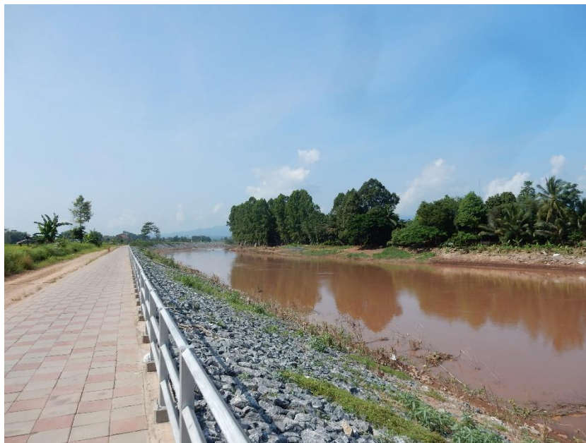
Figure 14 Berges de la rivière Nan aménagées par l'État

Par ailleurs, l'État est intervenu localement concernant les risques d'érosion et de déplacements du lit de la rivière Nan. Il y a une douzaine d'années, il fit creuser le sol au fond de la rivière afin de faire baisser son niveau, devenu trop élevé à la suite de l'accumulation de sédiments. Dans le même temps, des berges en pierre furent érigées sur une certaine longueur afin de limiter l'érosion (cf figure 14).