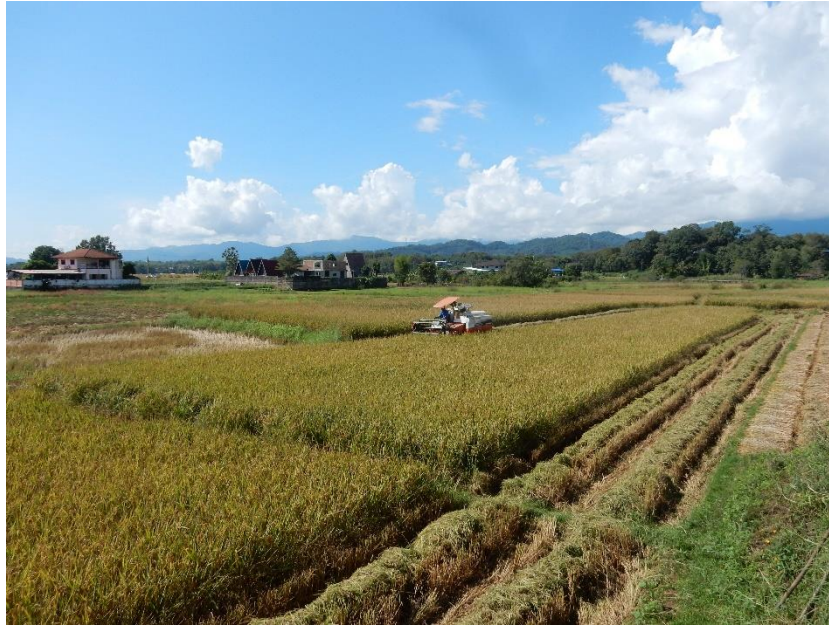
Figure 9 Moissonneuse-batteuse en action

La moissonneuse-batteuse est incontestablement efficace. En une journée à peine, presque toutes les rizières situées à l'ouest du village ont été récoltées. Elle fait en quelques minutes les trois étapes de la récolte décrits précédemment qui prennent normalement plusieurs jours. De ce fait, ces étapes que sont la moisson, la formation des meules de riz, et le battage de riz sont autant d'étapes que les paysans ne font plus eux-mêmes.