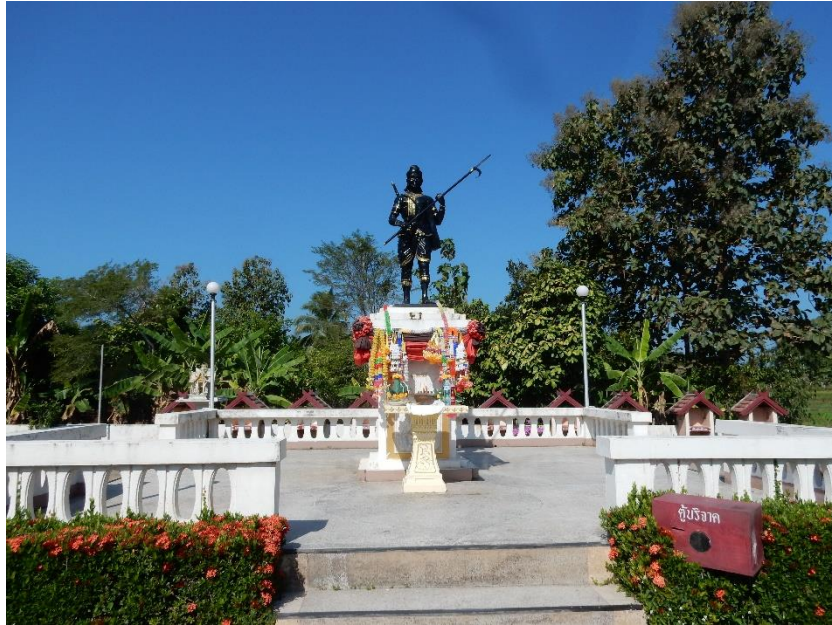
Figure 3 La statue du Chao Luang Muang La.