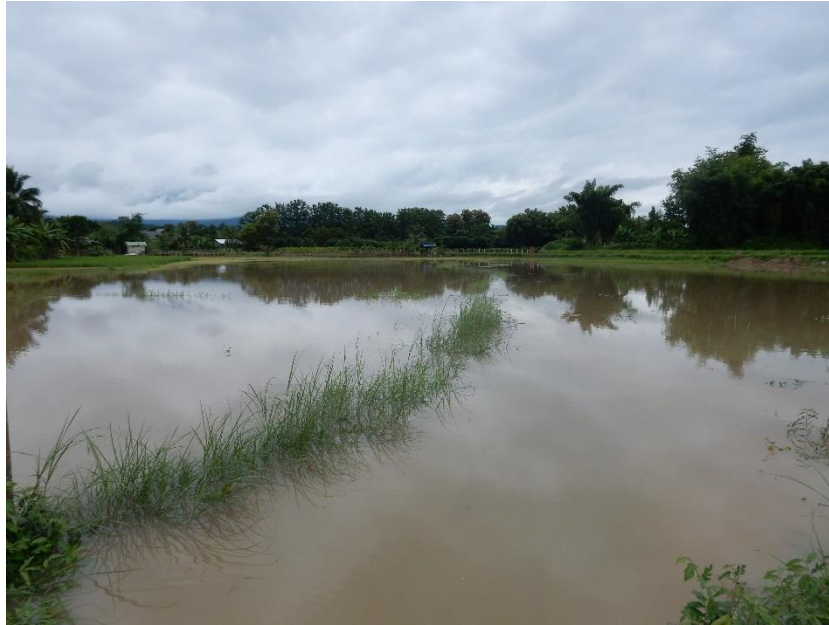
Figure 11 Inondation dans des parcelles

Si les inondations constituent un risque, c'est qu'elles peuvent être excessives, à la fois dans leur puissance et dans leur durée. Le riz peut certes survivre quelques jours à une inondation qui le submerge, mais passé ce cap, il meurt. Par ailleurs, l'inondation est un risque constant pour les autres cultures, non-dotées de cette capacité de résistance qu'a le riz. Ce sont surtout des cultures de rente, tels que le maïs, le piment ou le tabac.