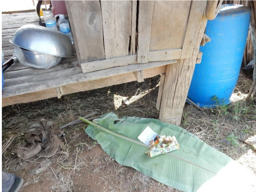
Figure 13 Offrande à l'esprit du lieu

paraît alors évidente. La seconde offrande observée a été présentée peu avant la récolte du riz par une moissonneuse-batteuse. Le paysan m'a expliqué qu'il souhaitait informer ainsi l'esprit de la récolte.