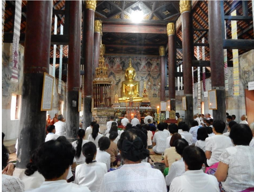
Figure 10 Cérémonie du wan phra lors du jour de sortie du carême bouddhique

Mon séjour correspondait avec la période de retraite ( phansa ), dite aussi de carême bouddhique, marquée par une plus grande piété (Tambiah 1975). À la fin octobre, la cérémonie de sortie de retraite a lieu. Cette cérémonie se déroule de manière similaire aux autres jours du Bouddha. Néanmoins, avant de rentrer dans l'édifice, une prière est dite dans la salle communautaire en présence d'un moine. Il y a également plus de participants. Après la sortie de la période de retraite, les jours du Bouddha sont toujours célébrés mais très peu de personnes y assistent (surtout des personnes âgées).