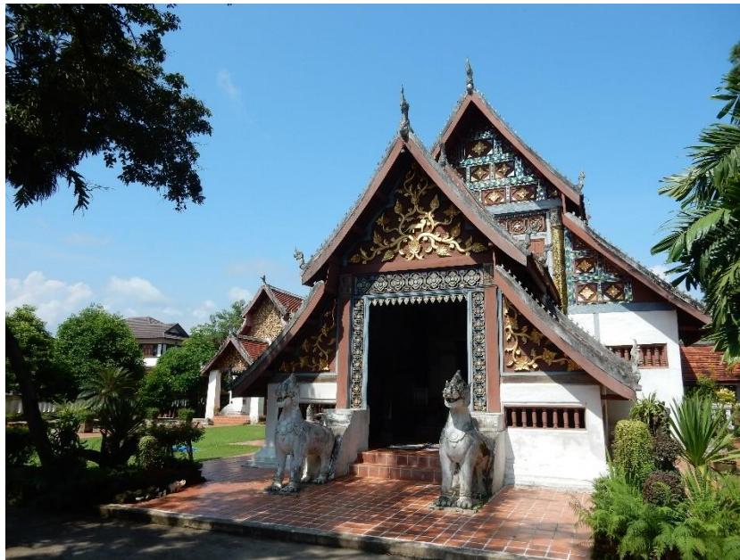
Figure 5 L'édifice du wihan

côté, il y a des toilettes publiques ainsi qu'une cuisine communautaire où sont préparés les repas lors de fêtes ou de cérémonies mais aussi quotidiennement pour les moines 11 . Un des autres bâtiments est justement la résidence des moines et novices, le kuthi . En tout, le village compte actuellement deux moines (dont l'abbé) et quatre novices. Les moines sont originaires de Ban Nong Bua. En revanche, les novices viennent d'autres endroits de la province. Enfin, le dernier édifice présent dans l'enceinte du temple est le sala kanprian . Cette salle sert normalement de lieu d'études pour les moines mais dans les faits elle fait office de salle communautaire. Il arrive que parfois une cérémonie spécifique y ait lieu 12 , mais la plupart du temps cette salle sert de lieu de réunion pour les villageois que ce soit pour discuter de la politique locale, pour accueillir des employés de l'administration ou pour inaugurer des projets touristiques. Mis à part le temple, il y a également un autre bâtiment religieux en dehors de la zone des habitations (cf n°18). C'est le lieu où les funérailles ont lieu et où le corps du défunt est incinéré.