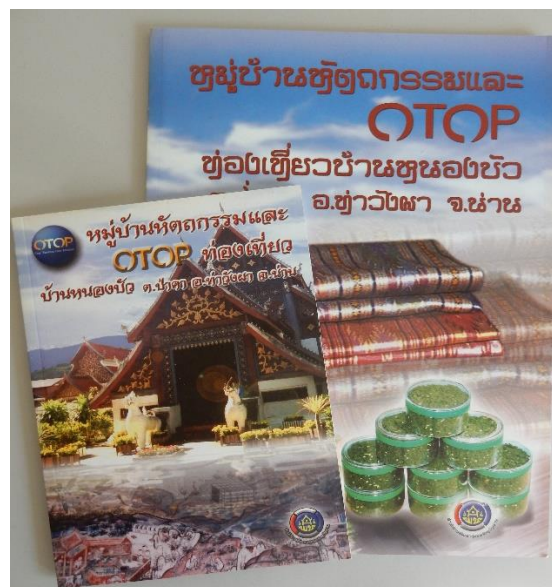
Figure 17 Livrets de présentation du village

Par ailleurs, fort de cette longue expérience dans le domaine du tourisme, le village a su mettre au point des produits et des services en faveur des touristes. Une réelle compétence a été acquise sur ce point. Les villageois ont compris les codes et les critères recherchés et valorisés par les touristes et l'administration et savent désormais répondre à leurs attentes. Cela se traduit par l'exposition et la présence de produits et de services spécifiques. Des termes clés reviennent constamment : authenticité, tradition, culture tai lue, localité, communauté. Ainsi les divers produits (vêtements, accessoire, biscuits et nourriture, babioles) vendus dans les boutiques du village sont présentés comme locaux et proprement tai lue. Les infrastructures et le champ lexical liés au tourisme sont aussi présents dans le village : les boutiques, le parking devant le temple, les toilettes publiques au temple, les musées, le monument au Chao Luang. Plusieurs livrets et brochures sur le village ont en outre été réalisées (cf figure 17). Elles présentent le village, son histoire et ses caractéristiques. Sont particulièrement mis en avant, le Chao Luang et le rite qui lui est dédié, le temple et ses peintures murales, les vêtements tai lue, les algues.