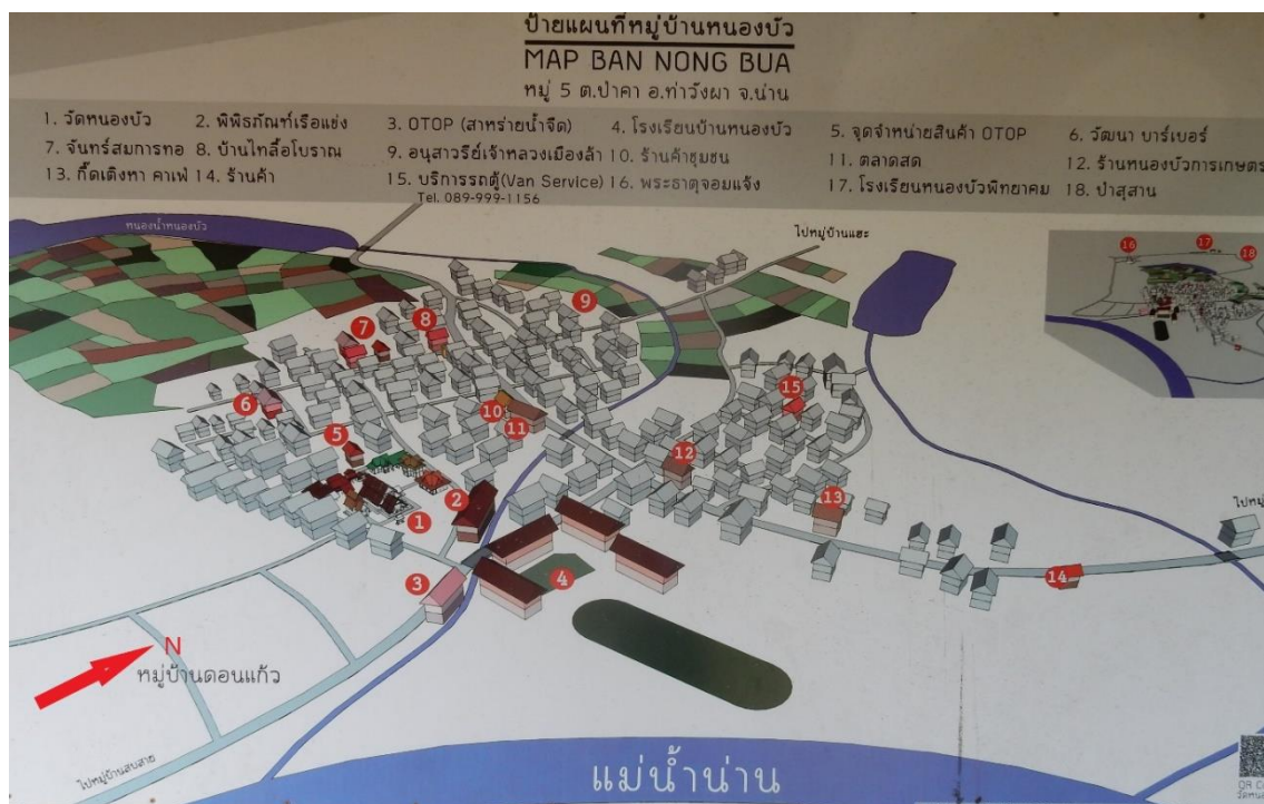
Figure 4 Photo d'une carte du village 7.

non. Elles ne sont fermées que la nuit. Il existe également des pâtés de maison, non séparés par une quelconque barrière. Bien souvent, il s'agit de membres d'une même famille. Les maisons sont essentiellement de trois types. Il y a les maisons de style traditionnel, en bois et sur pilotis. Ensuite, il y a des maisons, qui à la base, étaient de style traditionnel mais dont le rez-de-chaussée, la partie au niveau des pilotis, a été aménagé en pièces habitables, par la pose de murs en ciment. La large majorité des maisons correspond à ce type. Enfin, une partie des maisons sont bâties entièrement en ciment et de plain-pied. Ce sont les maisons modernes, ou villas, décrites dans certains écrits (Formoso 2016). Elles sont possédées par les villageois aisés, en mesure de s'endetter d'une importante somme. Elles comportent tous les critères de la modernité recherchés par les Thaïlandais, à commencer par la climatisation. Par ailleurs, certaines maisons ne sont pas habitées. Dans la plupart des cas, elles appartiennent à des personnes qui ont migré vers les centres urbains pour y travailler et y vivre.