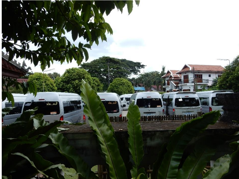
Figure 18 Jour d'affluence touristique au temple

Lors de mon séjour, le village travaillait sur le lancement de maison d'hôtes (homestays), comme nouvelle étape du développement touristique. En tout, 15 foyers ont été sélectionnés pour être des maisons d'hôte, dont celui où je logeais. Une des maisons tai lue transformée en musée, est aussi destinée à accueillir des touristes. Chaque maison d'hôte pouvant héberger quatre personnes, il y a donc en tout 64 lits de disponible. Les foyers ont reçu des équipements neufs, payés avec le budget du village, afin d'améliorer le confort des touristes : couvertures, oreillers, moustiquaires... Le village a établi des règles à respecter par les touristes. Chaque maison d'hôte en a reçu un exemplaire. Ce projet de maison d'hôte est soutenu par le comité du développement communautaire de l'administration de la province de Nan.