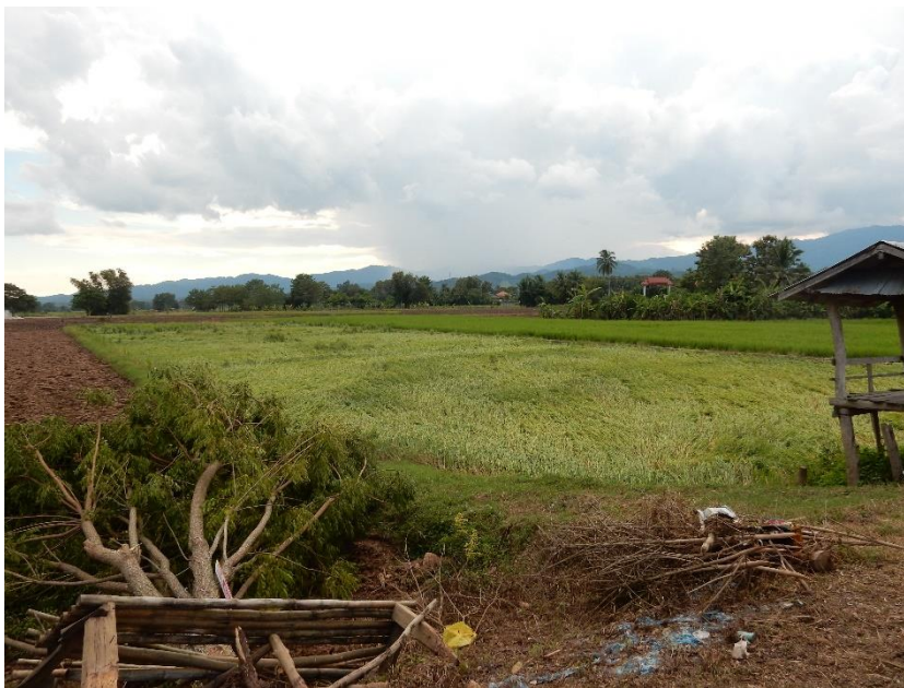
Figure 12 Dégâts à la suite de vents violents (Photo de l'auteur)

Parmi ces risques, il y a tout d'abord les tempêtes et vents violents qui surviennent assez régulièrement (risque évoqué dans 2,6% des réponses). Les rafales de vent peuvent endommager un certain nombre de cultures, y compris le riz. Pour ce qui est de ce dernier, le risque est d'autant plus élevé que les vents violents se produisent surtout en saison des pluies. Ils peuvent provoquer la mort des plantes de riz car quand elles sont frappées par des rafales de vent, elles peuvent être aplaties au sol, parfois en grande quantité (cf figure 12). Les paysans disent que le riz se couche ( khao non ). Il ne peut plus croître ainsi. Néanmoins, les dégâts restent dans la plupart des cas limités à une partie seulement des plantes de riz.