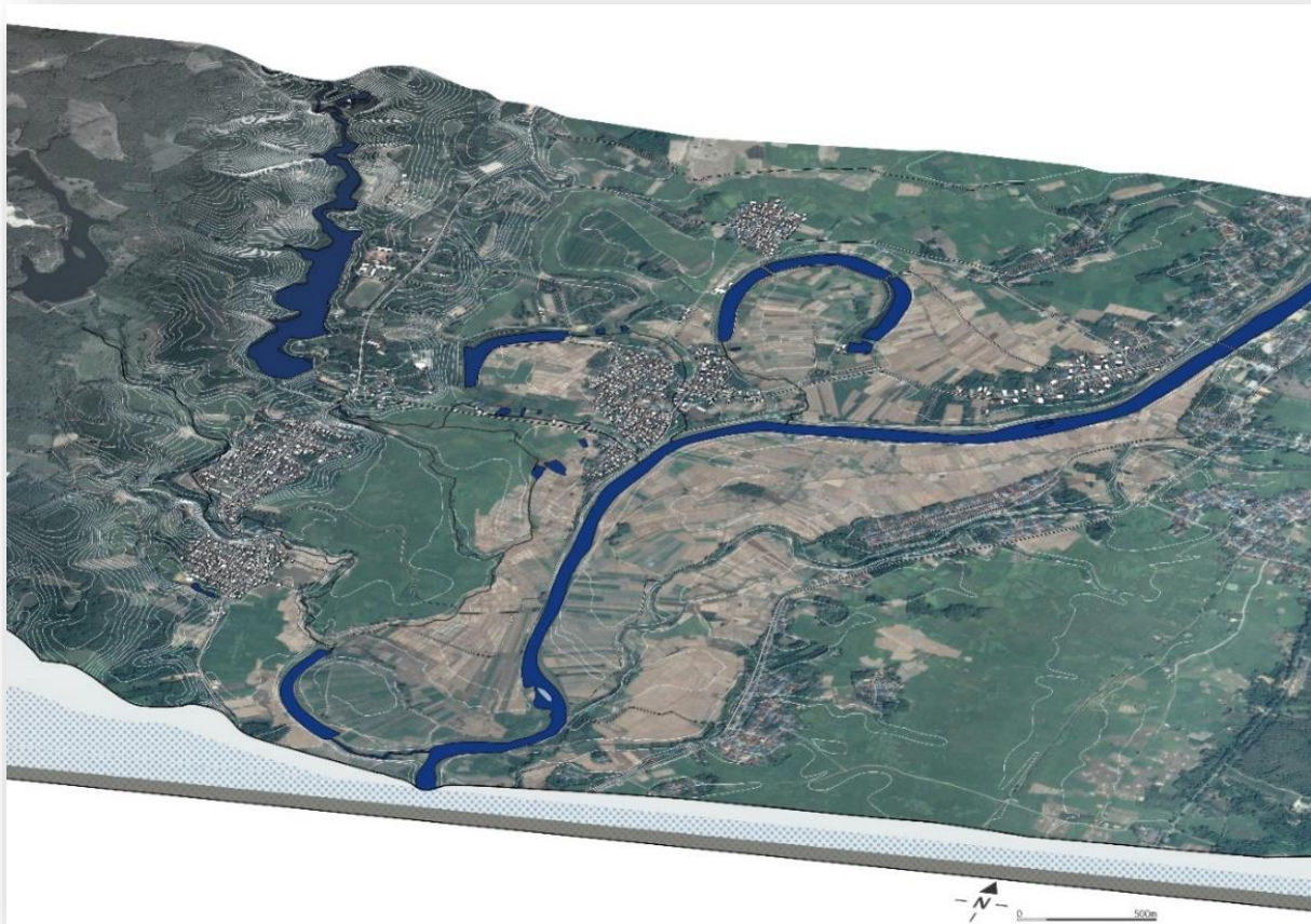
Figure 2 Vue aérienne du bassin de Tha Wang Pha