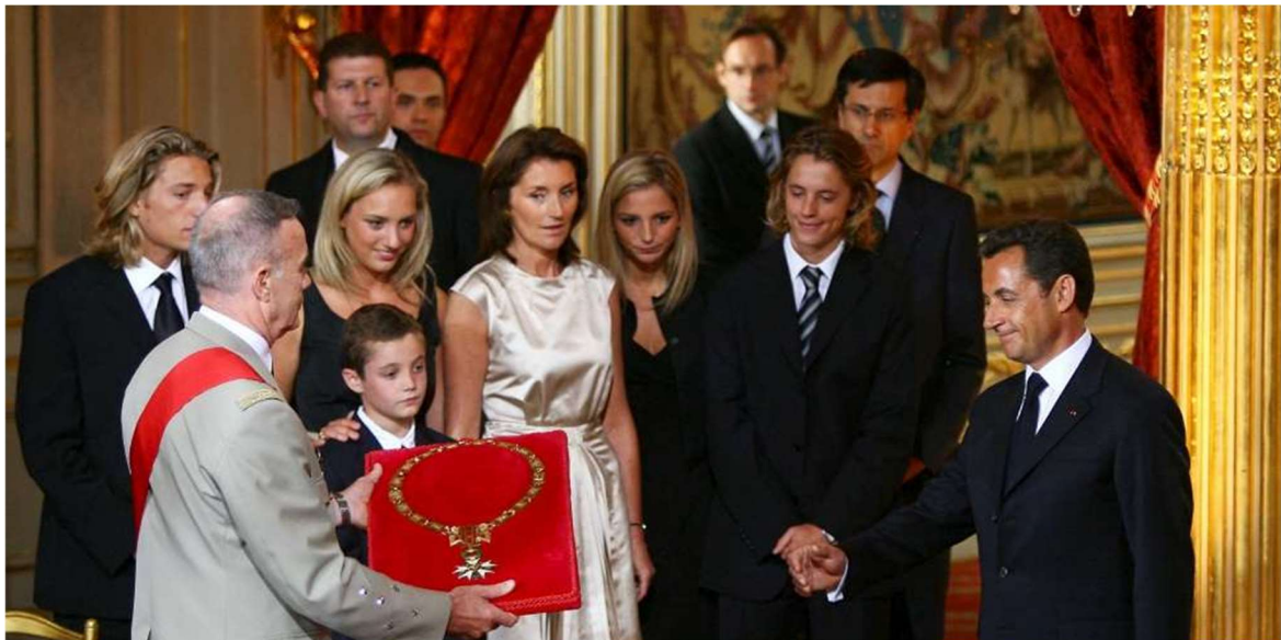
Investiture de Nicolas Sarkozy le 16 mai 2007 au Palais de l'Élysée