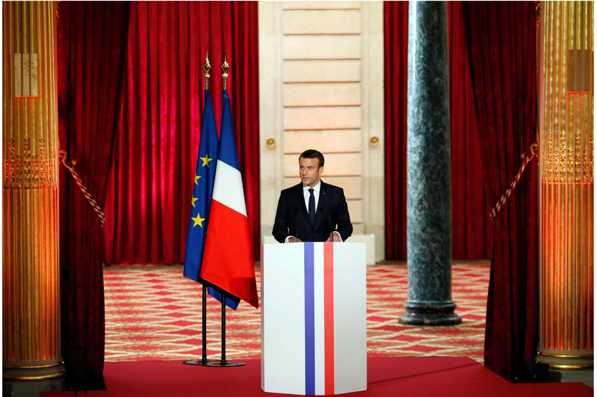
Emmanuel Macron le dimanche 14 mai 2017 au Palais de l'Élysée