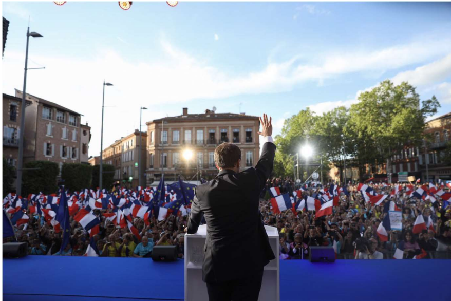
Meeting d'Emmanuel Macron le 5 mai 2017 à Albi