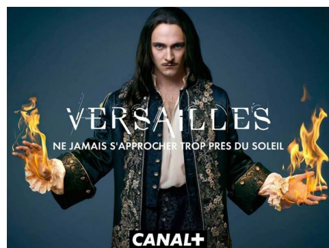
Affiche de la campagne publicitaire de la série Versailles de Canal+.

Dans l'inconscient collectif, la production télévisuelle a souvent été moins prestigieuse que les films de cinéma. De nombreux critiques et théoriciens ont écrit dès les années 1950 à propos du cinéma et de sa légitimité à être étudié. La télévision souffre toujours, tout comme ses programmes, d'une image d'un média abrutissant. Regarder la télévision serait pour certains moins digne qu'une autre activité culturelle. Pourtant, la série a longtemps pris le cinéma comme modèle avant de se créer sa propre identité et aujourd'hui, de nombreuses séries sont d'une qualité similaire voire supérieure à certains films de cinéma.