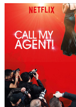
Affiche de la série Dix pour cent, sous le nom Call my agent!, publiée par Netflix pour la promotion de sa diffusion. Les logos de France Télévisions ont complètement disparus, Netflix s'appropriant la série.