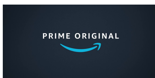
Pré-générique qui présente le logo « Prime Original », diffusé par la plateforme avant tous les programmes qu'elle produit.