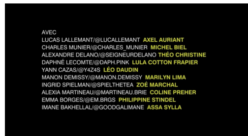
Capture d'écran du générique de fin de la série dans lequel les noms utilisés sur les réseaux sociaux par les acteurs sont affichés.

Instagram, donnent des indices et des compléments sur les intrigues de la série. Au générique, leurs noms mais aussi les surnoms qu'ils utilisent sur les réseaux sociaux sont crédités. Ce qui a pour but d'inviter les téléspectateurs à les suivre sur ces fameux médias sociaux. Sur le compte Facebook de la série, des messages échangés entre les personnages sont publiés afin de compléter l'intrigue et des liens vers les épisodes sont mis en ligne. La série se suit donc de manière originale. Il ne suffit plus de regarder les épisodes quotidiens ou hebdomadaires mais les spectateurs doivent également être actifs sur les réseaux sociaux afin d'avoir les clefs pour comprendre toute l'intrigue du programme. Les choix en matière de production de cette série s'inscrivent parfaitement dans des logiques d'innovation et d'adaptation aux mutations de l'industrie. Skam France existe à travers des plateformes digitales mais elle a également été diffusée à la télévision. Elle est produite à l'image de ce qui était déjà pratiqué avant l'arrivée des plateformes mais les créateurs et diffuseurs ont pensé sa diffusion différemment afin de s'adapter aux nouvelles technologies et aux nouvelles habitudes des jeunes adultes.