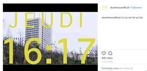
Capture d'écran d'un post officiel sur Facebook qui invite à visionner un épisode.

Ce type de programme est novateur. Il est le signe que les diffuseurs deviennent de plus en plus ambitieux et qu'ils osent quelque peu modifier leurs productions et leurs lignes éditoriales. Pour faire face à l'éparpillement des audiences et des publics, ils doivent reconquérir les téléspectateurs et adoptent de nouvelles stratégies de production et de diffusion.