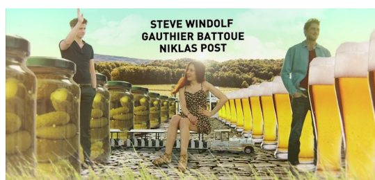
Cartons extraits du générique de la série Deutsch-les-Landes.