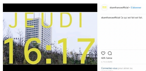
Capture d'écran d'un post officiel sur Facebook qui invite à visionner un épisode.

Ce type de programme est novateur. Il est le signe que les diffuseurs deviennent de plus en plus ambitieux et qu'ils osent quelque peu modifier leurs productions et leurs lignes éditoriales. Pour faire face à l'éparpillement des audiences et des publics, ils doivent reconquérir les téléspectateurs et adoptent de nouvelles stratégies de production et de diffusion.