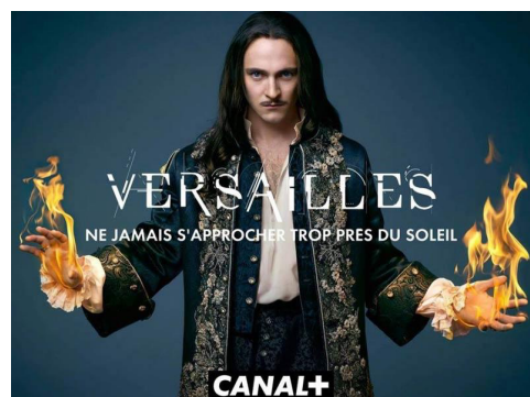
Affiche de la campagne publicitaire de la série Versailles de Canal+.

Dans l'inconscient collectif, la production télévisuelle a souvent été moins prestigieuse que les films de cinéma. De nombreux critiques et théoriciens ont écrit dès les années 1950 à propos du cinéma et de sa légitimité à être étudié. La télévision souffre toujours, tout comme ses programmes, d'une image d'un média abrutissant. Regarder la télévision serait pour certains moins digne qu'une autre activité culturelle. Pourtant, la série a longtemps pris le cinéma comme modèle avant de se créer sa propre identité et aujourd'hui, de nombreuses séries sont d'une qualité similaire voire supérieure à certains films de cinéma.