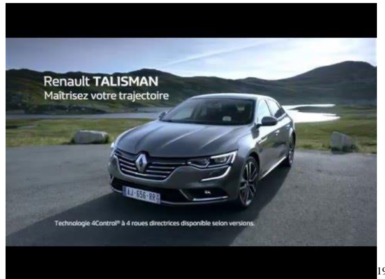
Figure 15 : Affiche Publicitaire Renault TALISMAN

Dans la publicité Renault Talisman, on remarque une technique persuasive similaire à celle de Renault Captur. Premièrement, la partie iconique de cette publicité présente le véhicule dans un environnement naturel. En arrière-plan de l'image, nous voyons le paysage montagnard, ce qui peut nous suggérer qu'avec Renault Talisman on va effectuer des voyages lointains, même dans des conditions difficiles, voire extrêmes. Les couleurs choisies pour cette publicité sont très apaisantes. La voiture avec sa couleur grise se fond dans le paysage et ils forment ensemble un tout cohérent. Par ailleurs, les rayons du soleil éclairent bien le design de ce véhicule.