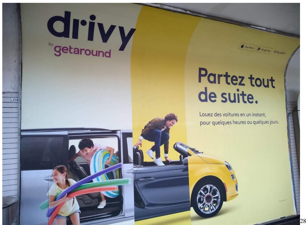
Figure 23 : Affiche Publicitaire Drivy

La publicité de Drivy nous propose une affiche sous forme de photo pleine de dynamisme et de couleurs vivantes. On y trouve trois personnages : deux enfants qui sont en train de descendre de la voiture et de courir joyeusement et un homme qui saute gaiement au volant. La photo présente trois fragments des voitures différentes, collés l'un à l'autre, ce qui illustre la richesse et la diversité des voitures disponibles à un client potentiel. Cette image positive influence le choix du public, en lui transmettant le message que les voyages en voiture sont une source de la joie et du plaisir. Dans le coin gauche en haut de l'affiche, le créateur de la publicité a placé le nom de la marque, qui constitue une forme d'étiquetage du produit.