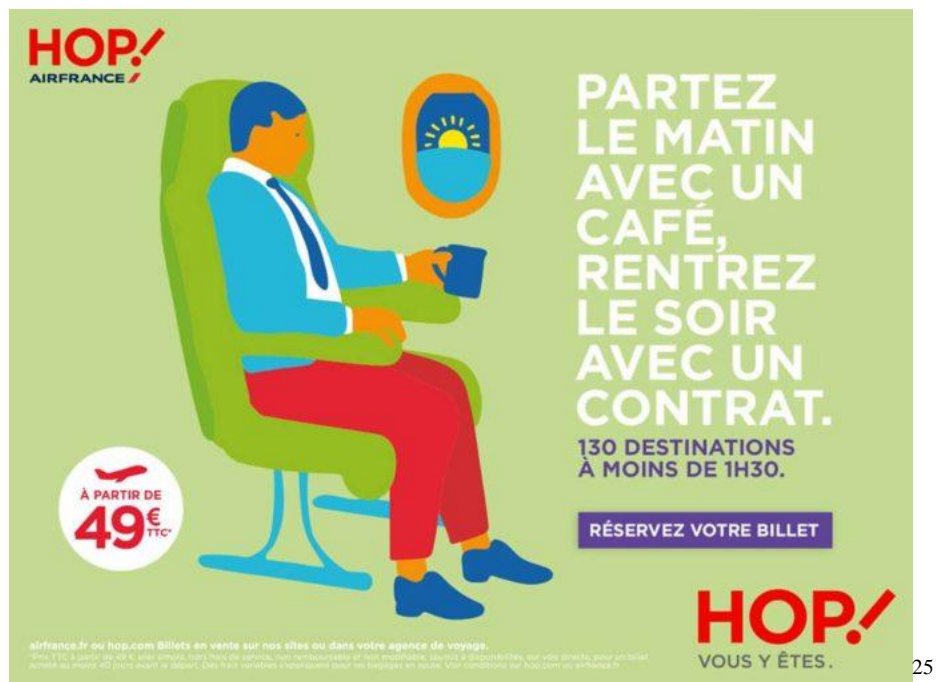
Figure 20 : Affiche Publicitaire HOP!

Dans une autre publicité de la même compagnie aérienne, la partie iconique possède le même style d'illustration. L'image est pleine de couleurs vives, mais en même temps, assez simple. Dans ce cas-là, elle est plus fortement liée au slogan, car elle illustre exactement la situation décrite dans le slogan ( Partez le matin avec un café ). En général, l'image suit le même schéma illustratif que celui de la publicité décrite supra. On peut y trouver les mêmes éléments comme le prix ( à partir de 49 eur ) ainsi que le logo de la marque qui apparaît deux fois (en haut et en bas de l'affiche) permettant d'identifier le destinataire de l'annonce.