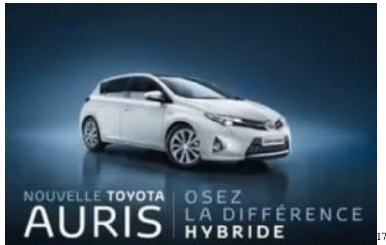
Figure 13 : Affiche Publicitaire Toyota AURIS

Nous voyons ici une voiture dont les couleurs sont claires sur le fond plus foncé. Le design de cette automobile est bien exposé sur l'image. Dans la partie textuelle, on remarque une structure binaire. Sur la gauche, on voit bien le nom de la série (Toyota Auris) de cette automobile précédée par le mot Nouvelle , ce qui implique immédiatement le sens d'une nouvelle qualité. Séparé à l'aide d'une barre, le slogan publicitaire a été placé sur la droite et annonce Osez LA DIFFÉRENCE HYBRIDE .