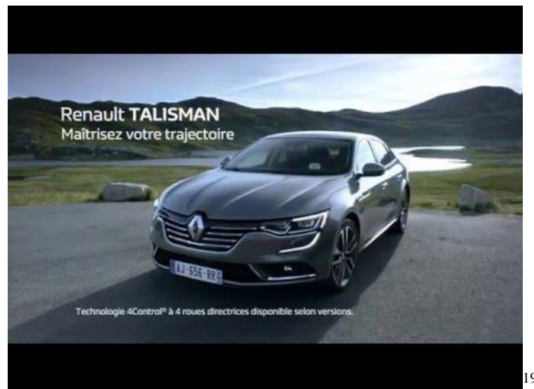
Figure 15 : Affiche Publicitaire Renault TALISMAN

Dans la publicité Renault Talisman, on remarque une technique persuasive similaire à celle de Renault Captur. Premièrement, la partie iconique de cette publicité présente le véhicule dans un environnement naturel. En arrière-plan de l'image, nous voyons le paysage montagnard, ce qui peut nous suggérer qu'avec Renault Talisman on va effectuer des voyages lointains, même dans des conditions difficiles, voire extrêmes. Les couleurs choisies pour cette publicité sont très apaisantes. La voiture avec sa couleur grise se fond dans le paysage et ils forment ensemble un tout cohérent. Par ailleurs, les rayons du soleil éclairent bien le design de ce véhicule.