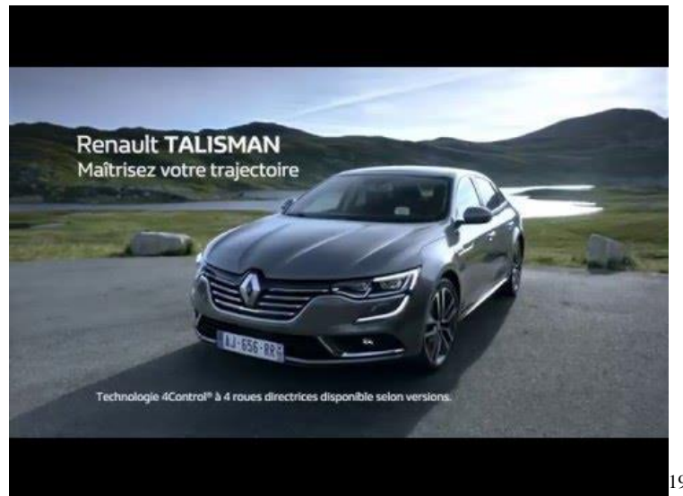
Figure 15 : Affiche Publicitaire Renault TALISMAN

Dans la publicité Renault Talisman, on remarque une technique persuasive similaire à celle de Renault Captur. Premièrement, la partie iconique de cette publicité présente le véhicule dans un environnement naturel. En arrière-plan de l'image, nous voyons le paysage montagnard, ce qui peut nous suggérer qu'avec Renault Talisman on va effectuer des voyages lointains, même dans des conditions difficiles, voire extrêmes. Les couleurs choisies pour cette publicité sont très apaisantes. La voiture avec sa couleur grise se fond dans le paysage et ils forment ensemble un tout cohérent. Par ailleurs, les rayons du soleil éclairent bien le design de ce véhicule.