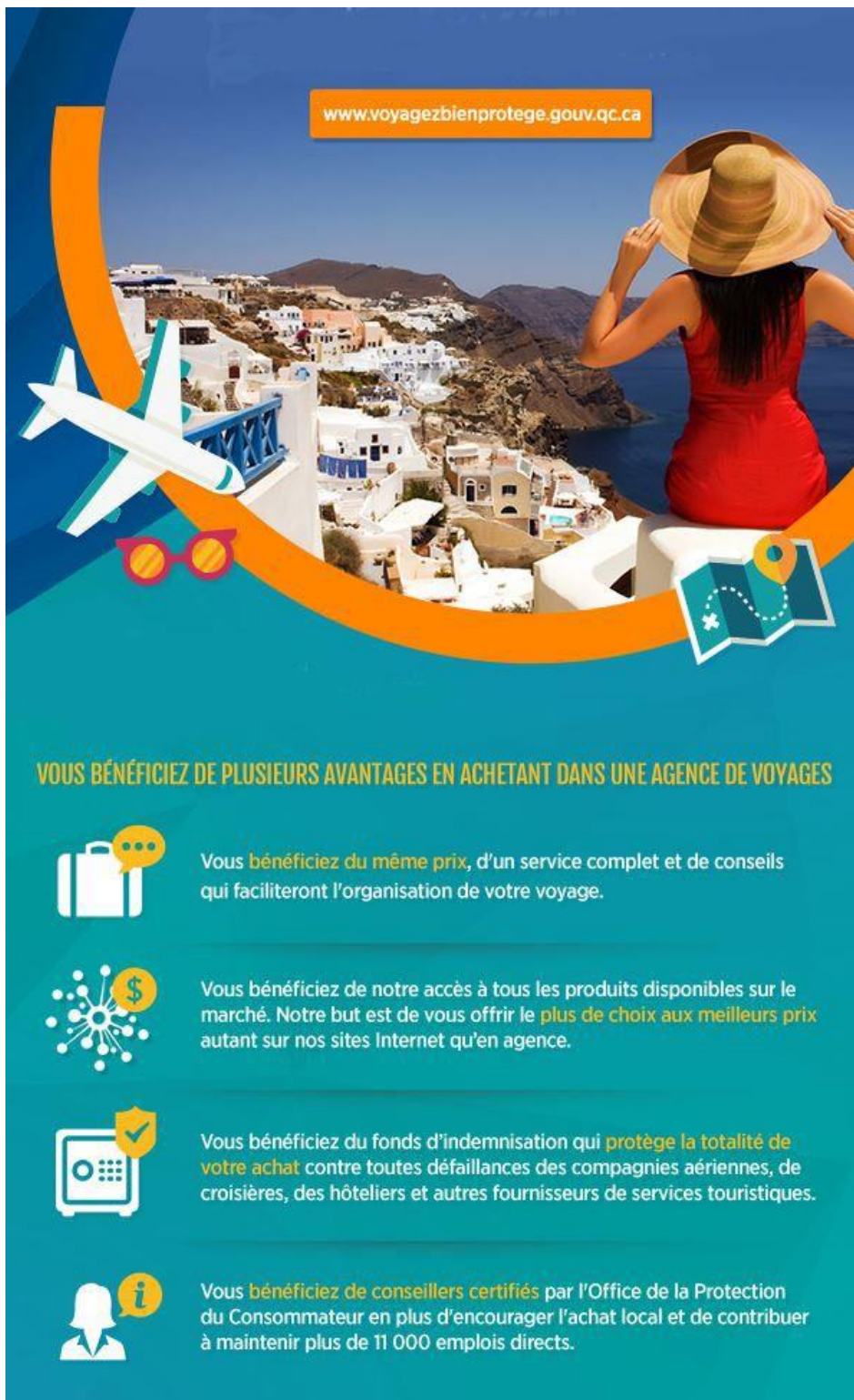
Figure 9 : Affiche Publicitaire Voyagez Protégé