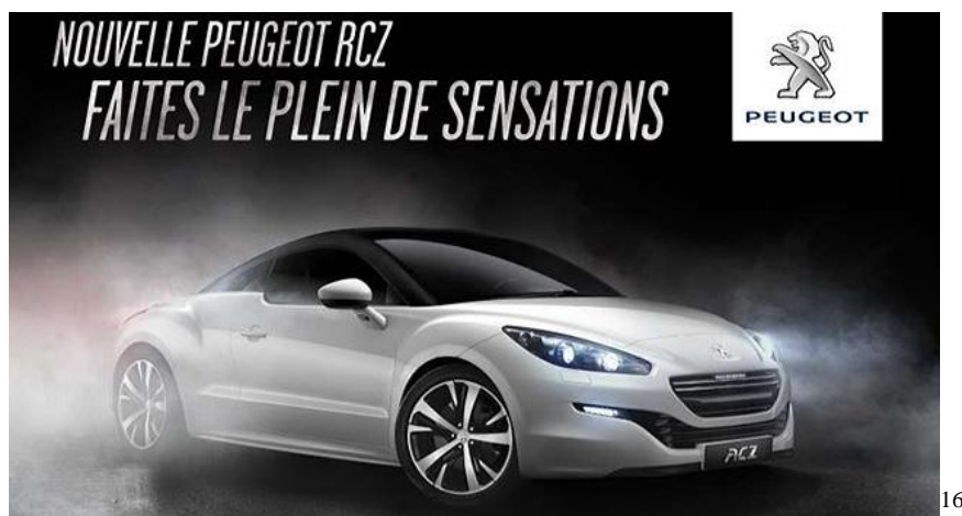
Figure 12 : Affiche Publicitaire Peugeot RCZ

Même si notre étude n'est pas centrée sur le signifiant iconique, il ne faut pas oublier que l'image joue un rôle très important dans l'interprétation des slogans publicitaires. La partie iconique est fortement liée à la partie linguistique et vice versa.