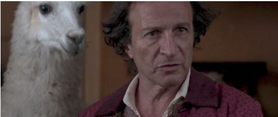
Figure 42 : L'alpaga envahit le cadre dans Zama , presque en moquant le protagoniste.