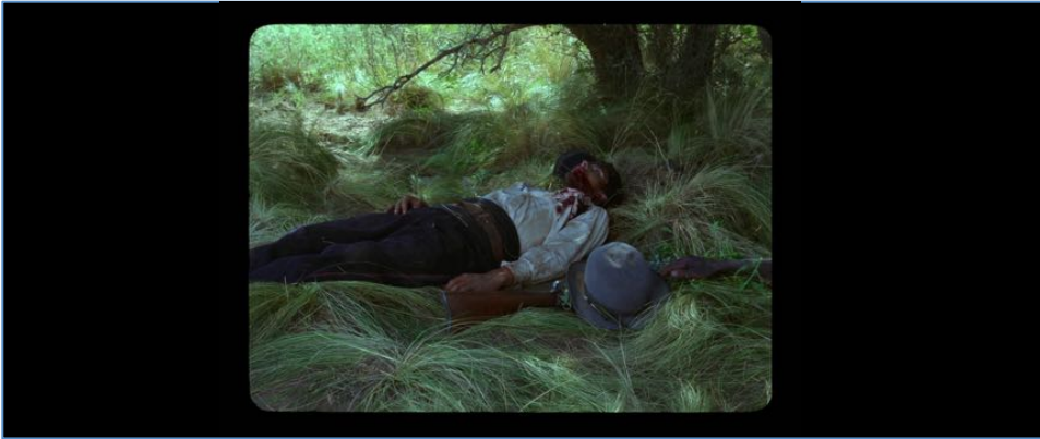
Figure 44 : La main envahissante dans Jauja .