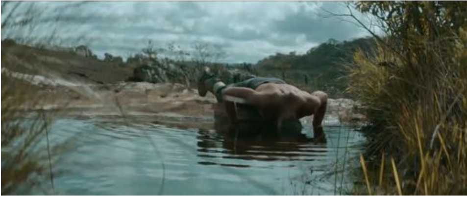
Figure 10 : Dans Joaquim , le protagoniste plonge la tête dans l'eau après avoir vécu une révélation.