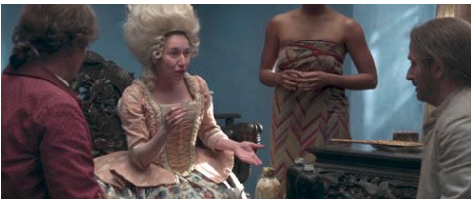
Figure 33 : La tête de Malemba n'est pas visible, tandis que les Blancs discutent.