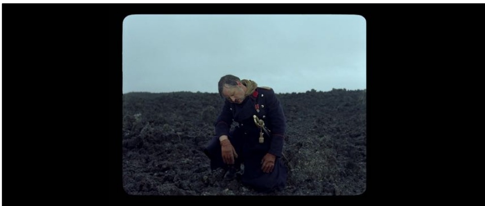
Figure 26 : Respectivement dans L'Étreinte du Serpent , Zama , Joaquim et Jauja , la crise de la figure masculine blanche.