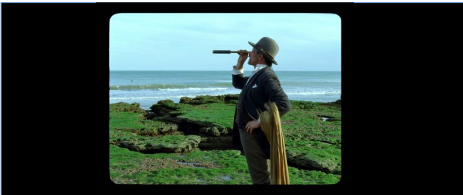
Figure 9 : Un des plans du début de Jauja , de Lisandro Alonso. Le capitaine Gunnar cherche lui aussi un élément en hors-champ qui ne se dévoile pas.