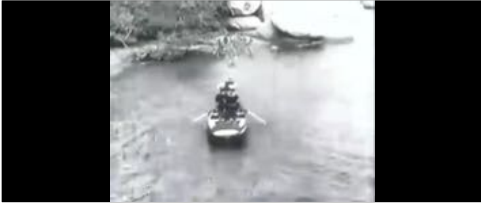
Figure 3 : Dans O Descobrimento do Brasil , de Humberto Mauro, le bateau des Portugais se rapproche de la côte.