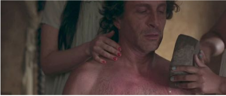
Figure 47 : Dans Zama , des mains féminines qui baignent le protagoniste.