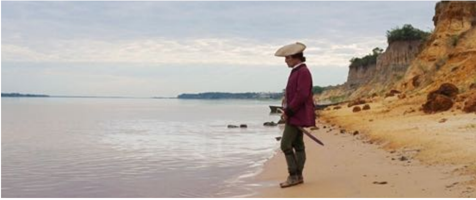
Figure 8 : Plan d'ouverture de Zama , de Lucrecia Martel. Le protagoniste attends quelque chose qui n'arrive jamais.