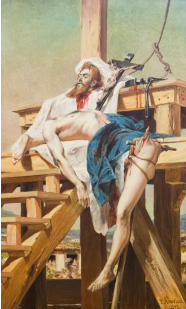
Figure 57 : La jambe et le tronc de Tiradentes dessinent les contours du territoire brésilien dans le tableau Tiradentes Esquartejado (1893), de Pedro Américo.