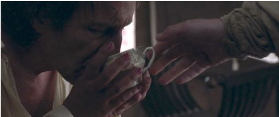
Figure 45 : La main féminine, élément étrange qui pénètre le cadre pour donner du thé au protagoniste.