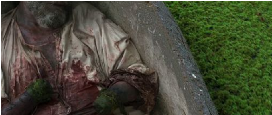
Figure 50 : Détail de la dernière séquence de Zama , où le protagoniste apparaît les mains coupées.