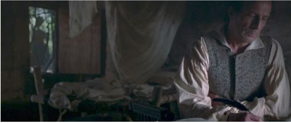
Figure 60 : Dans Zama , une figure féminine spectrale apparaît au fond du cadre.