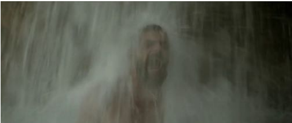
Figure 13 : La chute d'eau symbolise la rage.