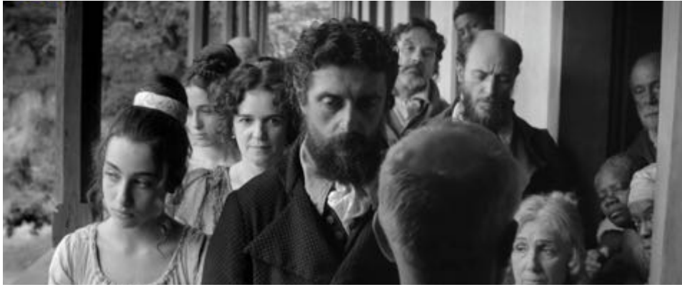
Figure 40 : Le couple protagoniste de Vazante au mariage : leurs regards sont absents, vides.