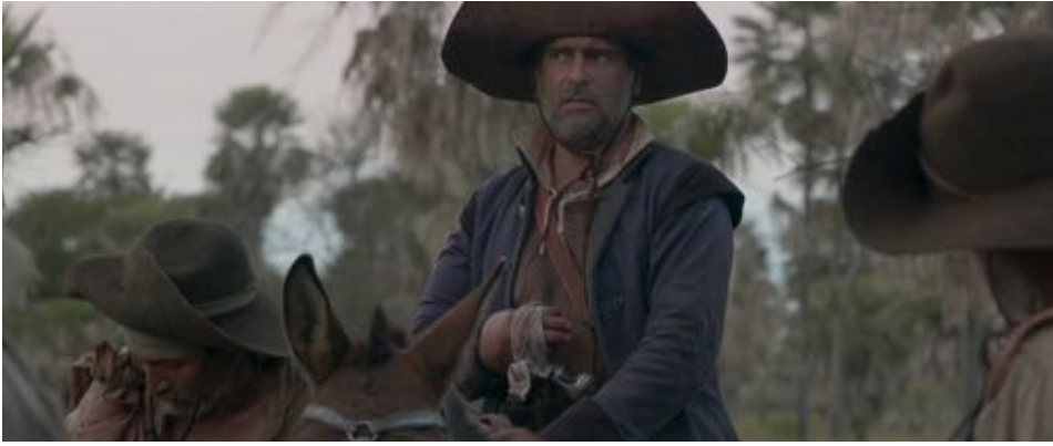
Figure 49 : Dans Zama , le commandant, à point de donner le cheval aux Indiens, avec sa main pourrie.