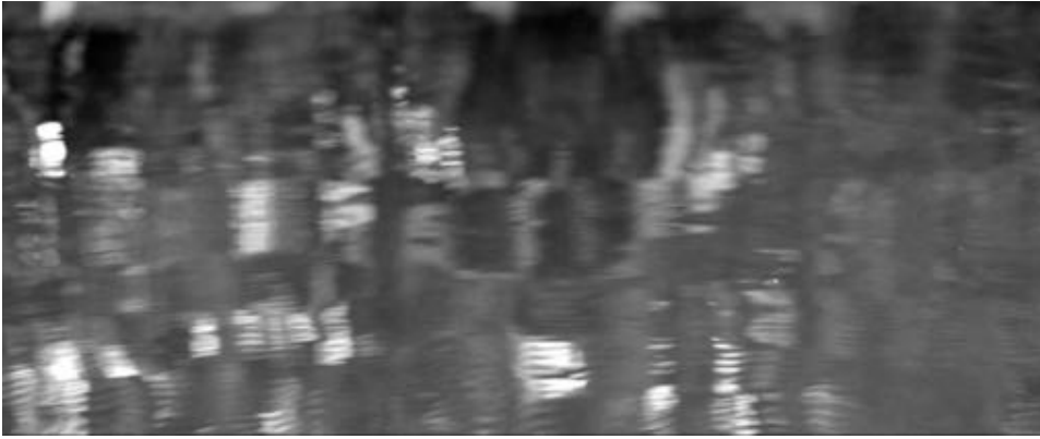
Figure 19 : Dans le premier plan de L'Étreinte du Serpent , le reflet de la figure de Karamakate paraît sur l'eau trouble.