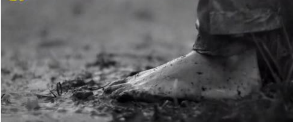
Figure 16 : Encore dans la première séquence de Vazante , l'eau est aussi liée au plaisir et à la vie : le pied de Beatriz.