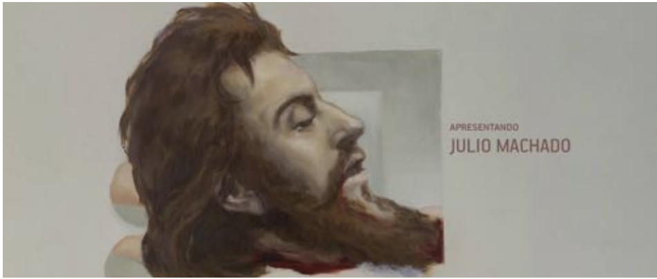
Figure 54 : Dans le générique de fin de Joaquim , la tête fait référence directe à Tiradentes Esquartejado , de Pedro Américo.