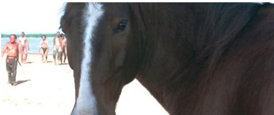
Figure 43 : Encore dans Zama , l'échange de regards entre le cheval et le protagoniste.