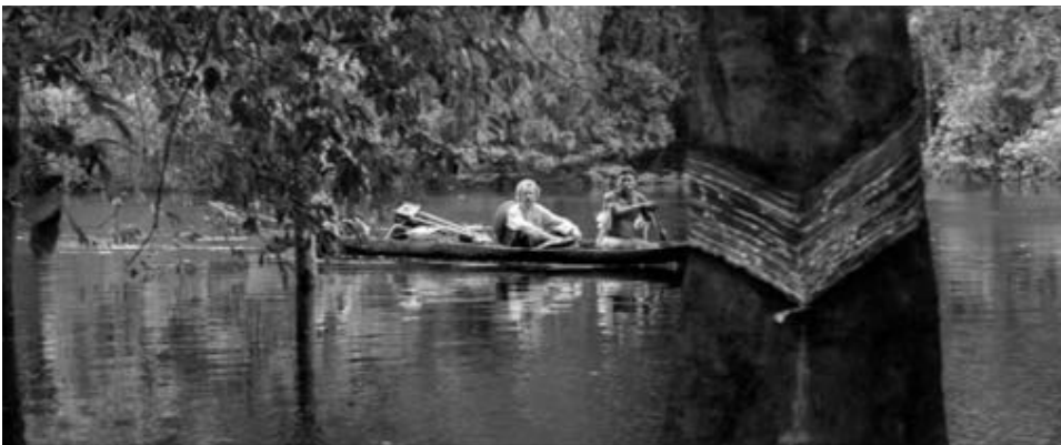
Figure 24 : ... pareillement aux « cicatrices » du caoutchouc sur les troncs d'arbre.