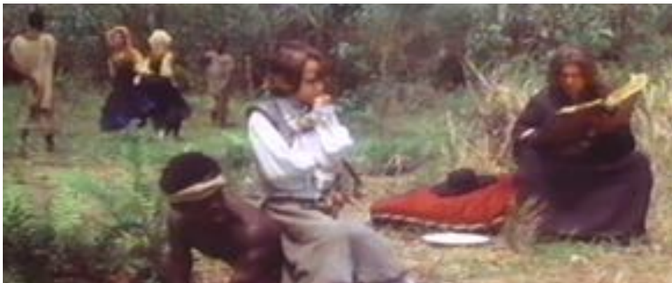
Figure 29 : Un plan d'ensemble montre une exagération au point du risible : un esclave nain sert comme une chaise pour un petit garçon, et les deux filles utilisent deux esclaves pour sauter à la corde au fond du cadre.