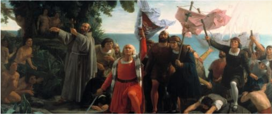
Figure 25 : Détail de Desembarco de Colón , de Dióscoro Puebla.