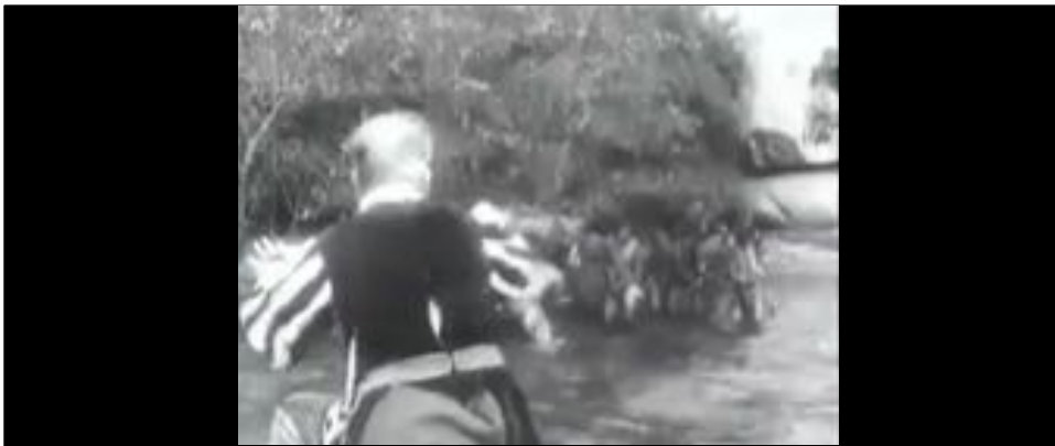
Figure 4 : Les Indiens sont visibles au fond du cadre, ce qui renforce l'identification avec le Portugais, dont nous partageons le point de vue.