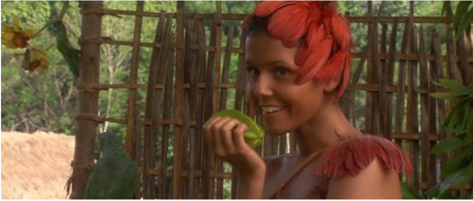
Figure 34 : Dans Caramuru , les rôles des indiennes sont joués par des femmes blanches de peau teinte ou par des mulatas .