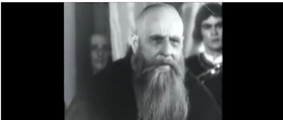
Figure 7 : Encore, le regard étonné des Portugais.