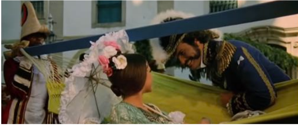
Figure 30 : Dans Independência ou Morte , les corps noirs restent au fond, sous la condition d'objets du décor.