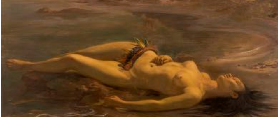
Figure 51 : Détail de Moema , de Victor Meirelles.