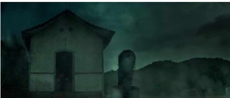
Figure 14 : Le célèbre démembrement du martyr est montré sous l'eau.