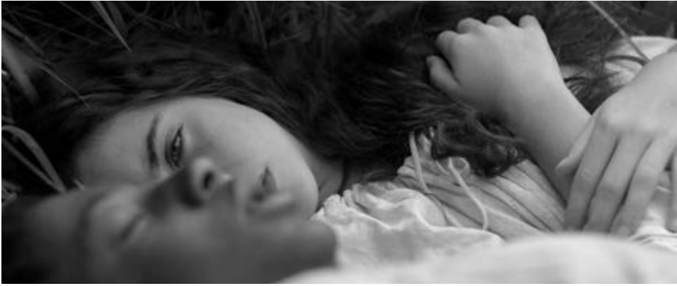
Figure 58 : Dans Vazante , les visages des deux jeunes se fond dans la suggestion d'une union charnelle.