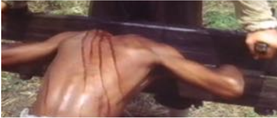
Figure 28 : Dans Quilombo , un esclave subit un châtement.