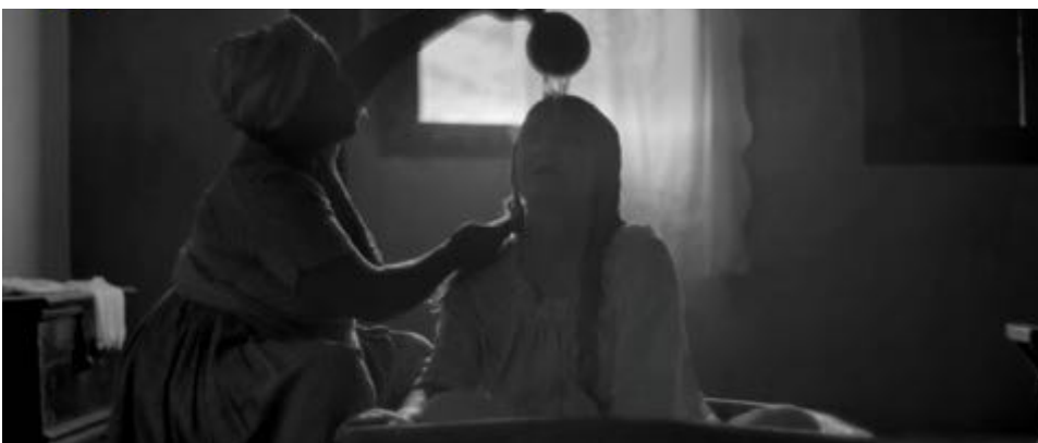
Figure 18 : L'eau du bain est source de plaisir sensible pour la grandmère, établissant un lien avec le plan précédent.