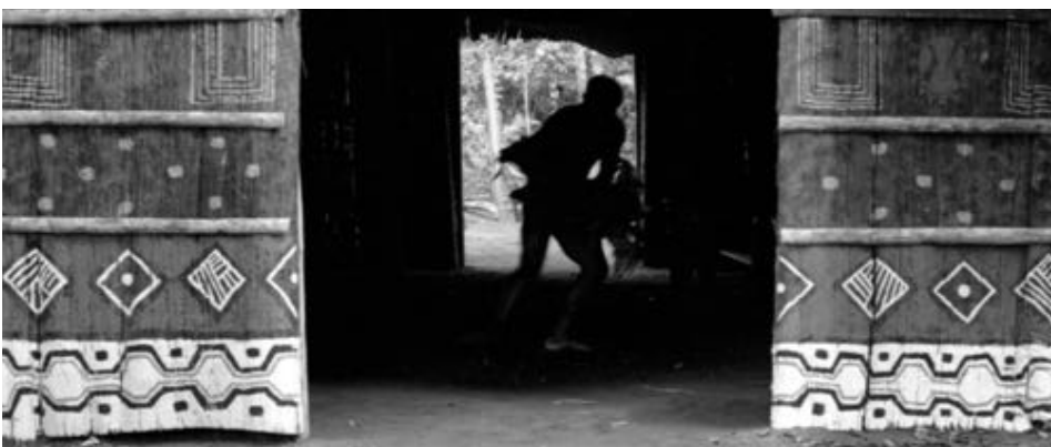
Figure 39 : La silhouette de Karamakate dans la maloca .