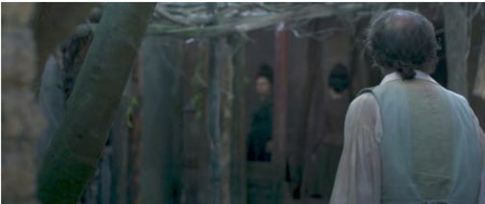
Figure 61 : La figure se dédouble. Les deux femmes s'insinuent au fond du cadre, l'image floue.