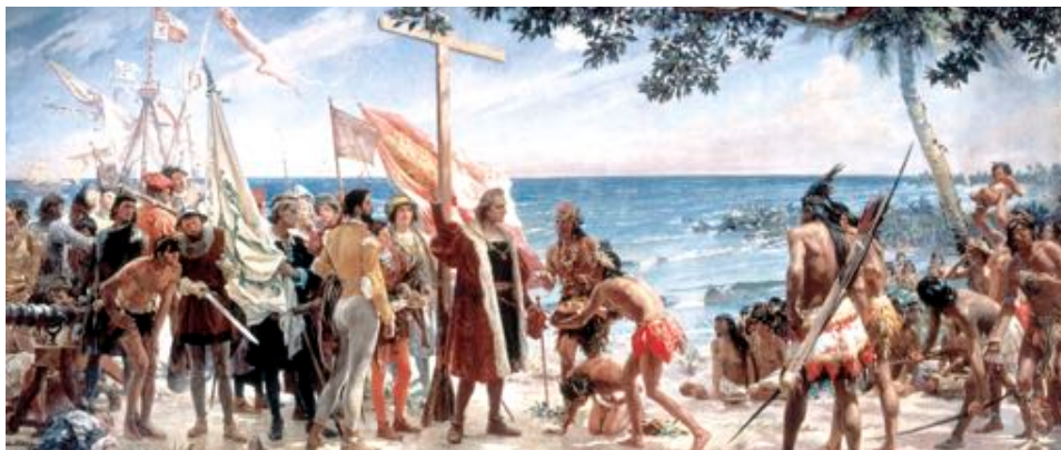
Figure 2 : Détail de Primer homenaje a Colón (1892, de José Garnelo y Alda).