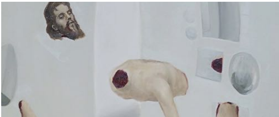
Figure 55 : Les morceaux du corps du héros flottent dans le vide.