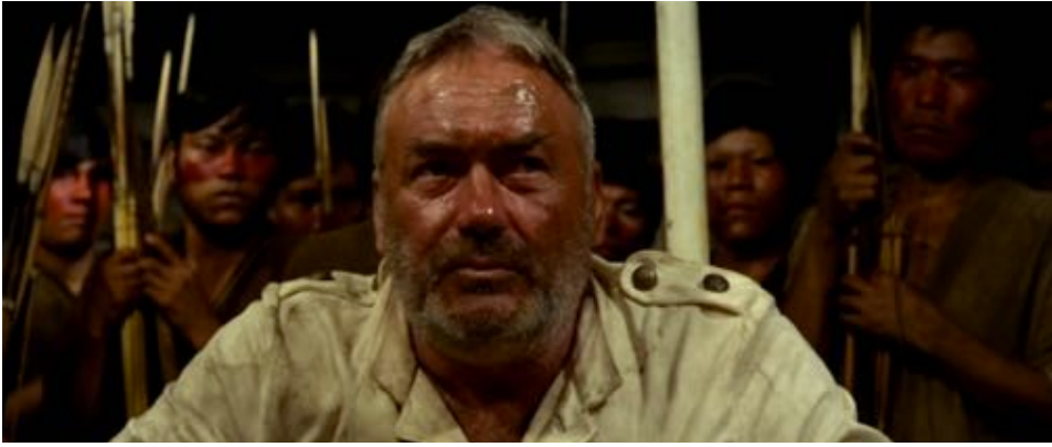
Figure 35 : Dans Fitzcarraldo , l'Indien est filmé en tant que corps collectif, tandis que l'individualité des Blancs est mise en avant.