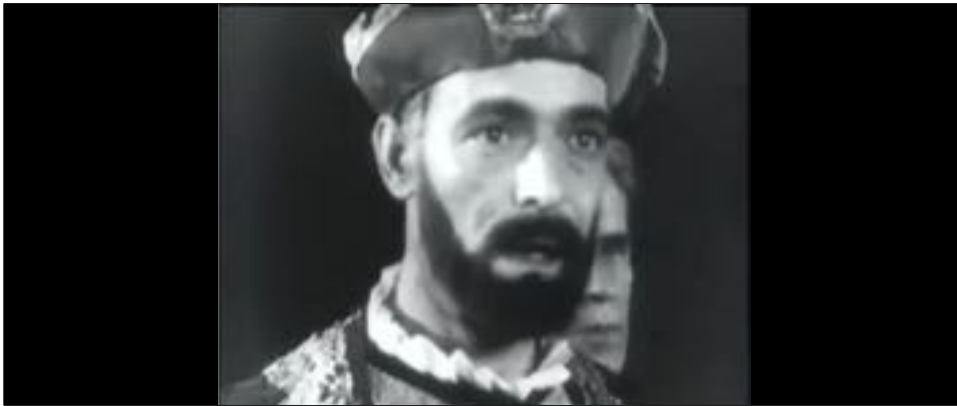
Figure 6 : Le regard étonné des Portugais.