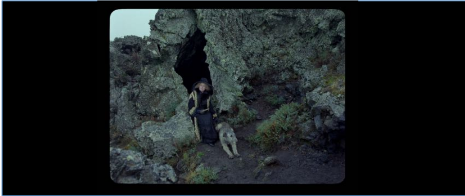
Figure 52 : Dans Jauja , la grotte de la vieille renvoie au sexe féminin.