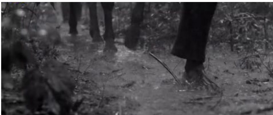
Figure 15 : Dans la première séquence de Vazante , de Daniela Thomas, l'eau est liée à la souffrance, à l'inhumanité et à la mort.