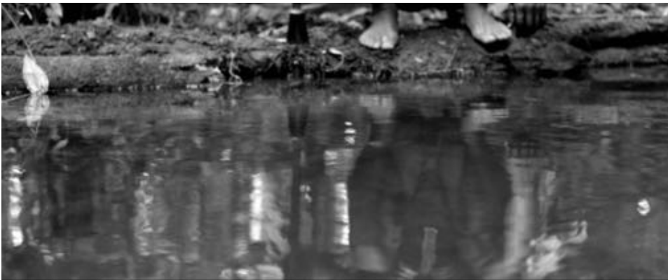
Figure 20 : Le mouvement ascendant de la caméra montre les pieds du personnage. Pour un moment, il y a l'effet de dédoublement.