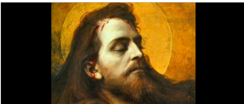
Figure 56 : Détail du tableau Cristo Morto , de Pedro Américo.