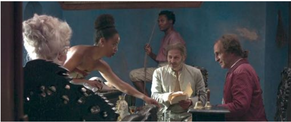
Figure 32 : Les regards des esclaves créent des lignes de force qui traversent le cadre.