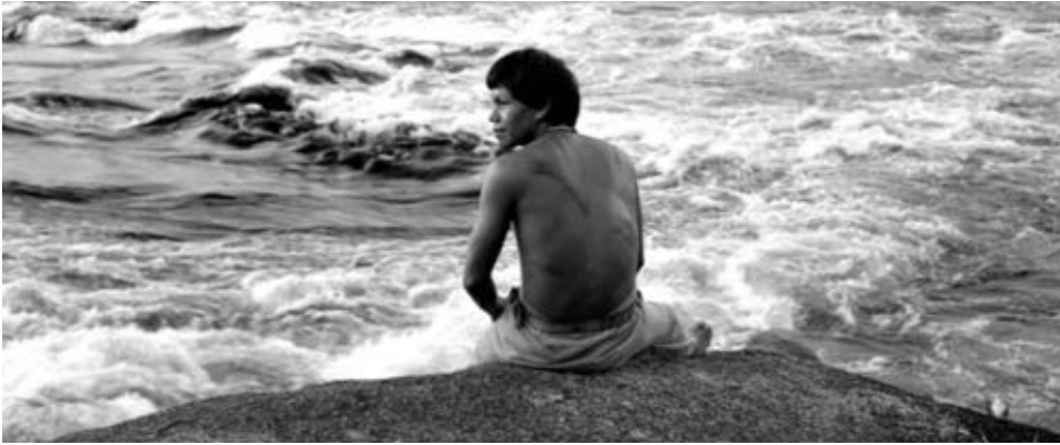
Figure 23 : Dans L'Étreinte du Serpent , la cicatrice sur le dos de Manduca indique le passage de l'homme blanc...