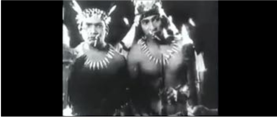
Figure 5 : L'échange du regard entre les Portugais et les Indiens dans O Descobrimento do Brasil : les Indiens.