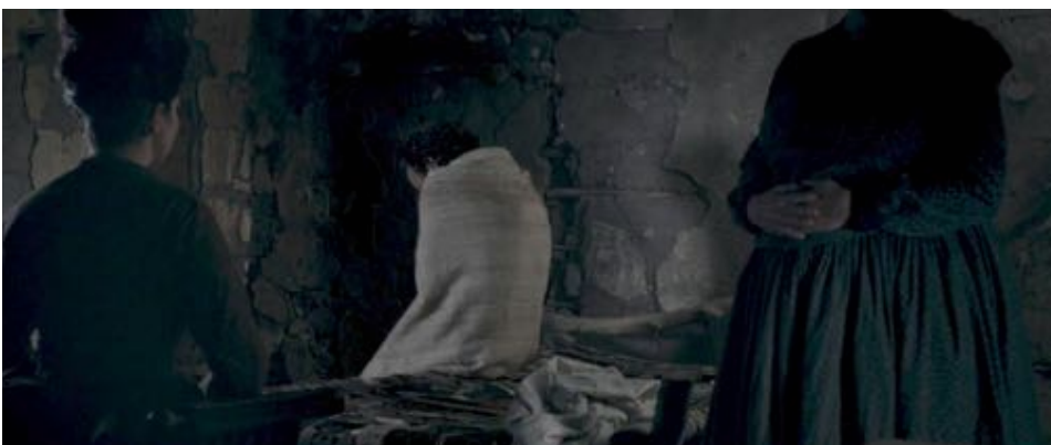
Figure 62 : Et finalement, les figures veillent tandis que le protagoniste entre dans un état intermédiaire, larvaire, indéfini.