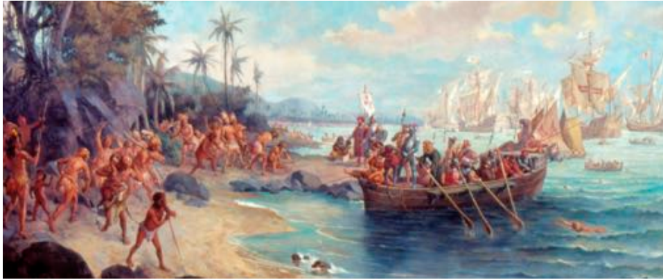
Figure 1 : Détail de Desembarque de Pedro Álvares Cabral em Porto Seguro (1922, de Oscar Pereira da Silva).