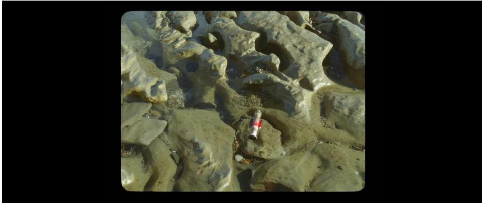
Figure 22 : Dans Jauja , le petit soldat en plomb circule à travers un espace-temps fluide.