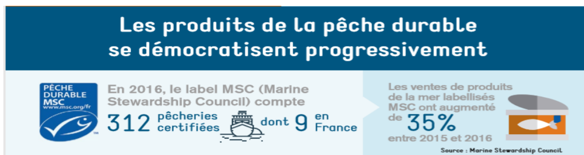
Figure 2 : Démocratisation des produits de la pêche durables

Cette prise de conscience émerge également pour les consommateurs. En effet la consommation responsable 6 , selon l'édition 2017 du rapport « Les Chiffres de la Consommation Responsable » 7 a augmentée dans plusieurs domaines notamment la vente de produits bios et de produits équitables ou encore ceux de la pêche durable comme l'illustre l'image ci-dessous