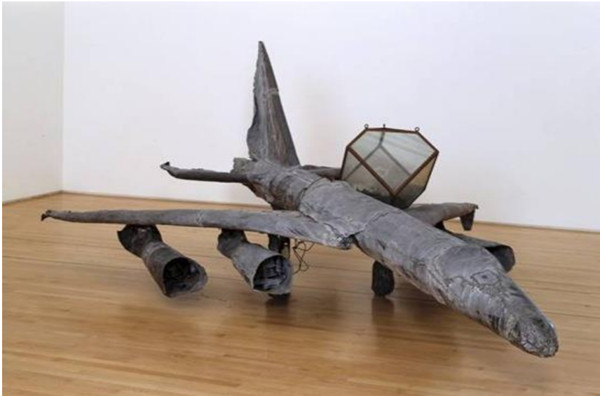
Melancholia , 1989, Plomb et verre, 470x370x215 cm et polyèdre 62x70x70 cm, Klassik Stiftung Weimar, Neues Museum Weimar, collection particulière

Dans l'œuvre Melancholia de 1989, c'est également à des fins de critique de l'Histoire et de l'humanité qu'Anselm Kiefer va faire référence à la mélancolie.