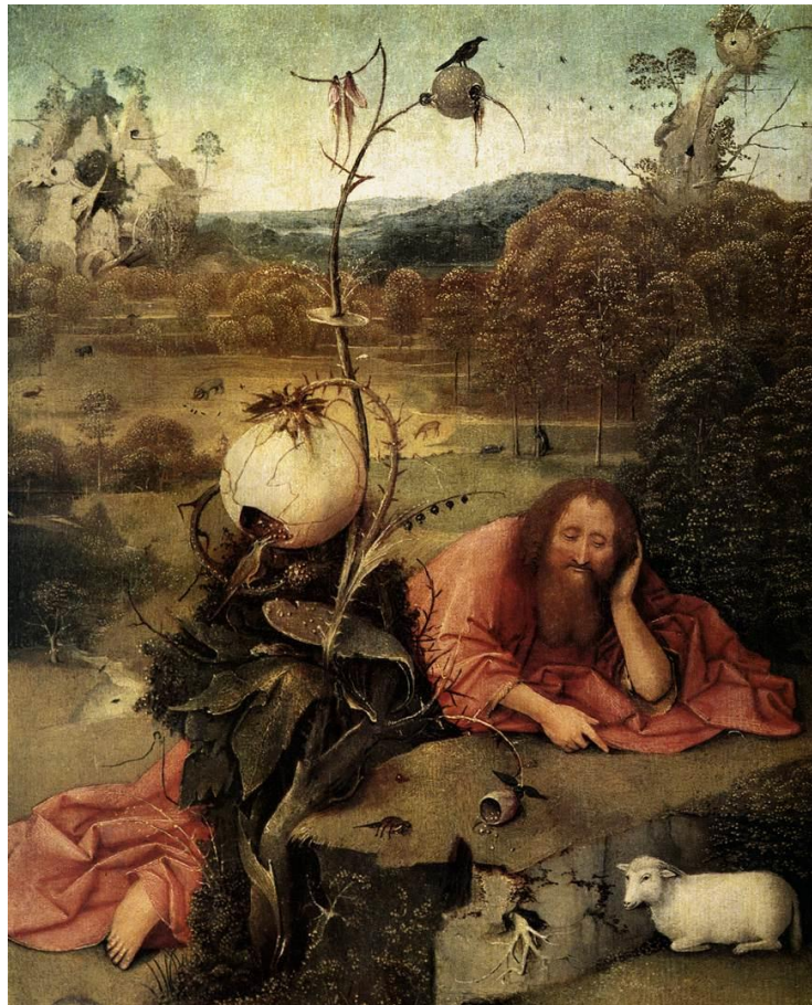
Jérôme Bosch, Saint-Jean-Baptiste dans le désert, huile sur panneau, 48,5 × 40 cm, 1489, Museo Lázaro Galdiano, Madrid

Au Moyen Âge, le Problème XXX est oublié, seuls les points négatifs de la doctrine des tempéraments restent en mémoire, comme l'avarice, la dépression, etc. Le malheur causé par la bile noire est récupéré par la religion. Il est la conséquence de la Chute originelle et devient le lot de l'humanité pour nous rappeler le péché d'orgueil. C'est en effet à partir du XIIe siècle que la philosophie scolastique réinterprète la mélancolie avec une échelle de valeur chrétienne. La tradition protestante est très dure avec la mélancolie. Elle l'associe au Diable ; dans le vocabulaire chrétien, elle est associée au péché de l'acédie, la tristitia . Aujourd'hui nous dirions qu'elle est associée au péché de la paresse qui ouvre à tous les vices. Dans la doctrine chrétienne, il ne faut pas s'attrister, car cela revient à douter de Dieu ; « la mélancolie est l'oreiller du Diable ». Dans le Nord, la tradition protestante est très forte. Elle résiste à l'image de l'artiste génie mélancolique ; au XVIe siècle, l'imagerie du nord est toujours marquée par l'iconographie du Moyen Âge.