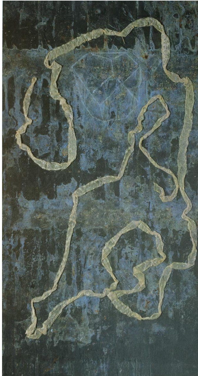
Anselm Kiefer. Schwartz Galle, 1989, Boyaux et craie sur plomb dans un cadre vitré en acier, 240x130 cm, Collection privée

Cette œuvre est faite de matière organique, de craie et de plomb. L'utilisation du plomb a été explicitée plus tôt, mais nous pouvons tout de même ajouter que son aspect usé fait penser à une ruine, un matériau ancien ayant traversé les années. Cela plonge le spectateur dans une temporalité différente. La couleur verdâtre et foncée accentue cette impression de passé, de mort. L'utilisation de boyaux est révélatrice du lien entre la mélancolie, son histoire et ses représentations, et la grande Histoire, celle de la Seconde Guerre Mondiale. Les boyaux sont