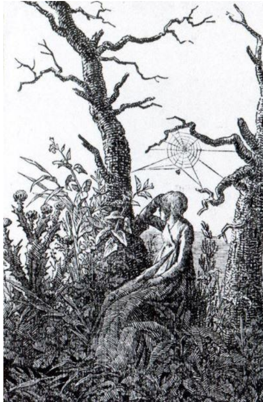
Caspar David Friedrich, Femme avec toile d'araignée entre des arbres dénudés , 1803, gravure sur bois, 16,8 x 11,8 cm, Musée des Beaux-Arts de Hambourg

Les personnages de dos sont également typiques de la réflexivité du paysage chez Friedrich. Dans Femme avec toile d'araignée (ci-dessus) et Femme au bord d'un précipice , qui sont des gravures de 1801 ; on observe des figures de la mélancolie friedrichienne, des chardons, une végétation stérile, l'infini du vide déployé à l'arrière-plan vient faire écho au vide intérieur du mélancolique. Tout en invitant à la contemplation, le personnage de dos montre le rapport du mélancolique au monde, c'est une invitation à la contemplation et la réflexion. Il instaure une vision sans regard qui interroge le lointain et la vacuité de l'horizon, montrant la posture nouvelle du contemplateur perdu en soi dans la rêverie. Être en exil, non inséré dans le monde, qui interroge le monde. C'est un renversement complet par rapport aux représentations de face du mélancolique ; c'est une mélancolie sans visage. C'est également une façon tout à fait nouvelle d'articuler sans transition le proche et le lointain ; plus d'organisation en perspective du paysage ; pas d'ouverture, un écran d'eau ou de brouillard, avec un premier plan méticuleusement représenté. S'en suit une stratégie d'étourdissement avec le passage sans progression à une ouverture du paysage ; une rupture d'espaces qui composent en propre le