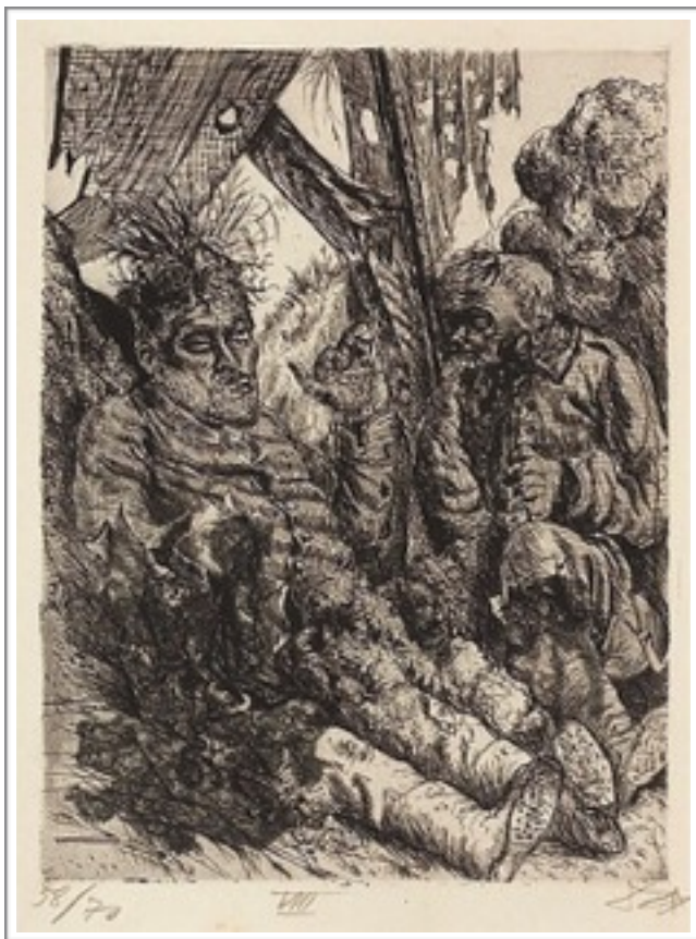
Otto Dix, Vu sur la pente au Cléry-sur-Somme, gravure extraite de la série des 50 eaux fortes, La guerre (1924).

Afin de clarifier notre pensée, reprenons l'exemple de La guerre d'Otto Dix, cité en début de chapitre. Cette peinture remarquablement éprouvante en raison de ce qu'elle donne à voir, de ce qu'elle représente dans les limites de son cadre, ne saurait être appréhendée sans tenir compte du trait de l'artiste. La manière dont il a figuré les choses peut sembler grossière, voire vulgaire, mais elle correspond au sentiment de l'artiste au moment où il peignit ces horreurs, lui-même habité par un profond sentiment de colère et de dégoût, sentiments qui se retrouvent inscrits à même la forme de l'oeuvre. On peut évidemment penser que le peintre a été si affecté par son sujet, qu'il en est devenu malade : c'est pourquoi l'oeuvre s'en trouve affectée dans le style même qui la constitue. Or, il est besoin de le rappeler, Otto Dix ne s'est pas seulement inspiré d'images externes de la guerre afin de composer son