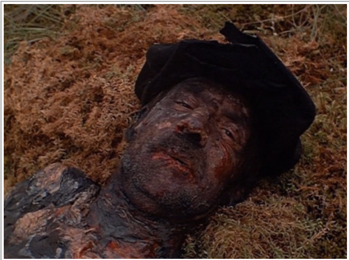
Le récit de souffrance du vieil homme en regard caméra.

Mais tandis que dans cet exemple, le regard du vieil homme fixant l'objectif contenait toujours une justification diégétique du fait de la caméra subjective, il en reste un de regard qui lui demeure incertain, trouble, injustifiable dans la fiction. On constate que ce regard est relativement absent du début du film, et se fait de plus en