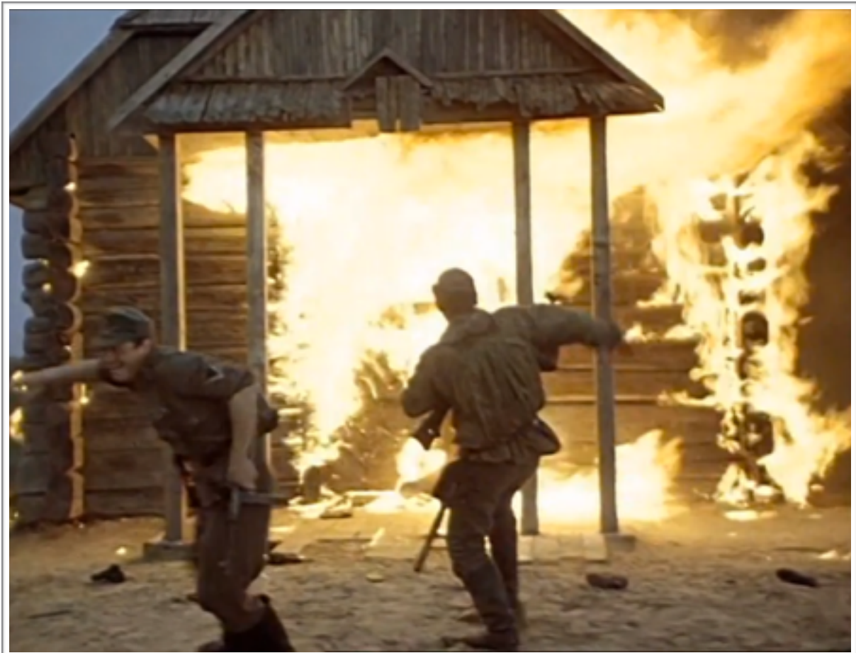
La mise à feu de la grange par les soldats. À l'intérieur, les femmes et enfants du village.

De fait, le film semble vouloir tout montrer de l'horreur de cette situation (car on nous présente le massacre dans son intégralité, depuis l'arrivée des nazis jusqu'à