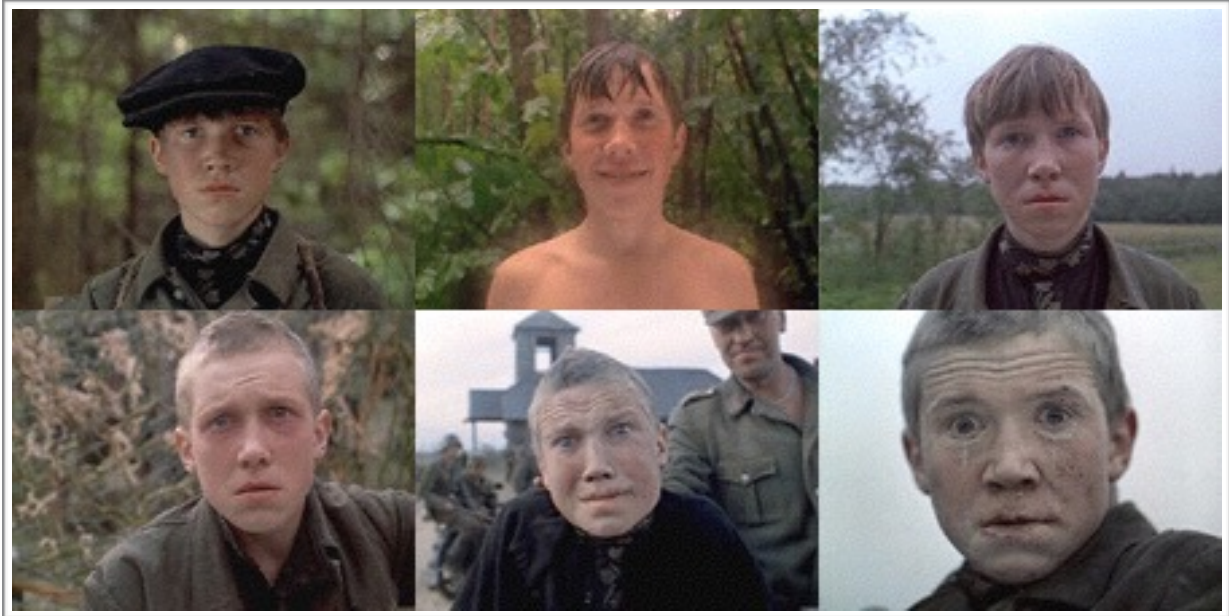
Les différentes étapes de la dégradation physique de Flora.

pourrait aussi expliquer plus rationnellement ce constat physique par le fait que le jeune homme n'a ni mangé, ni bu, ni profité d'un peu de repos pendant tout le temps où nous l'accompagnons.