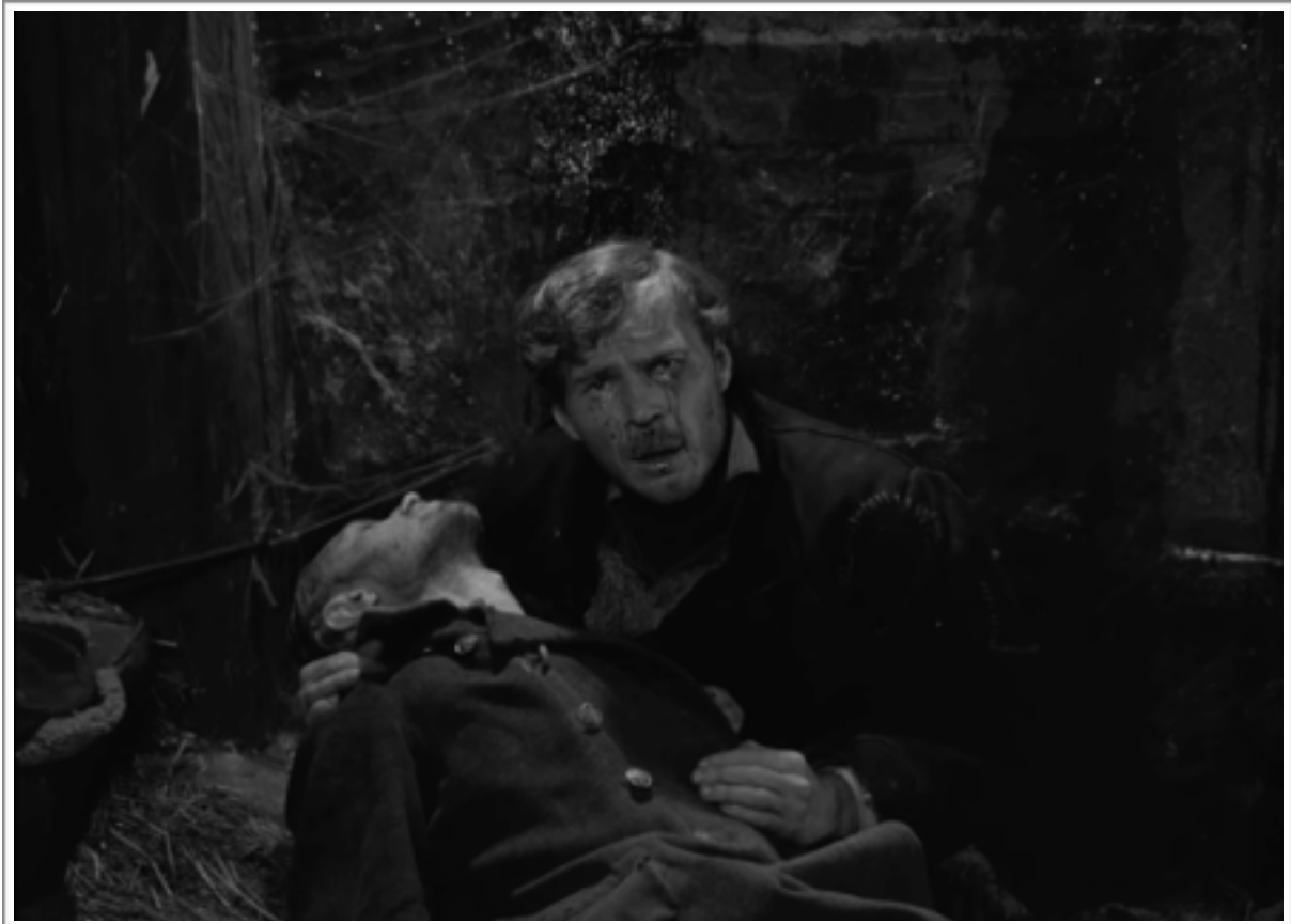
L'ascension , Larissa Chepitko, 1977

Ces groupes résistants biélorusses ont par ailleurs déjà été mis en scène par la femme du cinéaste, Larissa Chepitko, à travers un film intitulé L'Ascension , sorti en 1977, qui conte l'histoire de deux partisans cherchant à échapper à l'armée allemande, mais finalement rattrapés et fait emprisonnés. Ils seront soumis à un agent de la Gestapo qui les condamnera à mort, agent interprété Anatoli Solonitsyne, acteur fétiche d'Andreï Tarkovski. Tandis que l'un acceptera cette épreuve de manière quasi christique, l'autre succombera à la peur. Dans ce film de Larissa qui s'ouvre sur un petit détachement de partisans durant l'hiver glacial, on découvre les conditions éprouvantes de la vie de ces soldats livrés à l'hostilité la plus profonde dans des décors de grandes étendues blanches sans fin, pas loin de rappeler certains plans de L'enfance d'Ivan ou d' Andreï Roublev de ce même Tarkovski. Mais