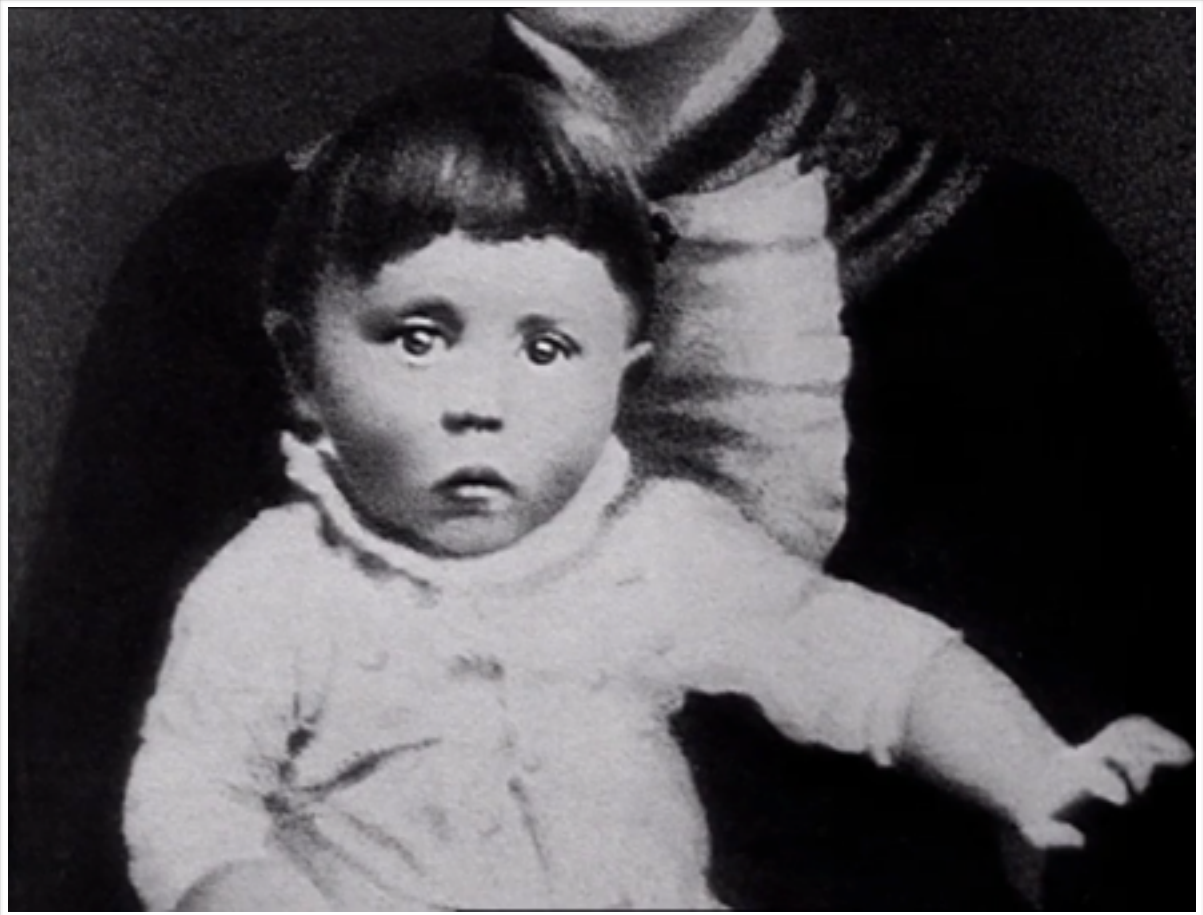
L'origine du mal.