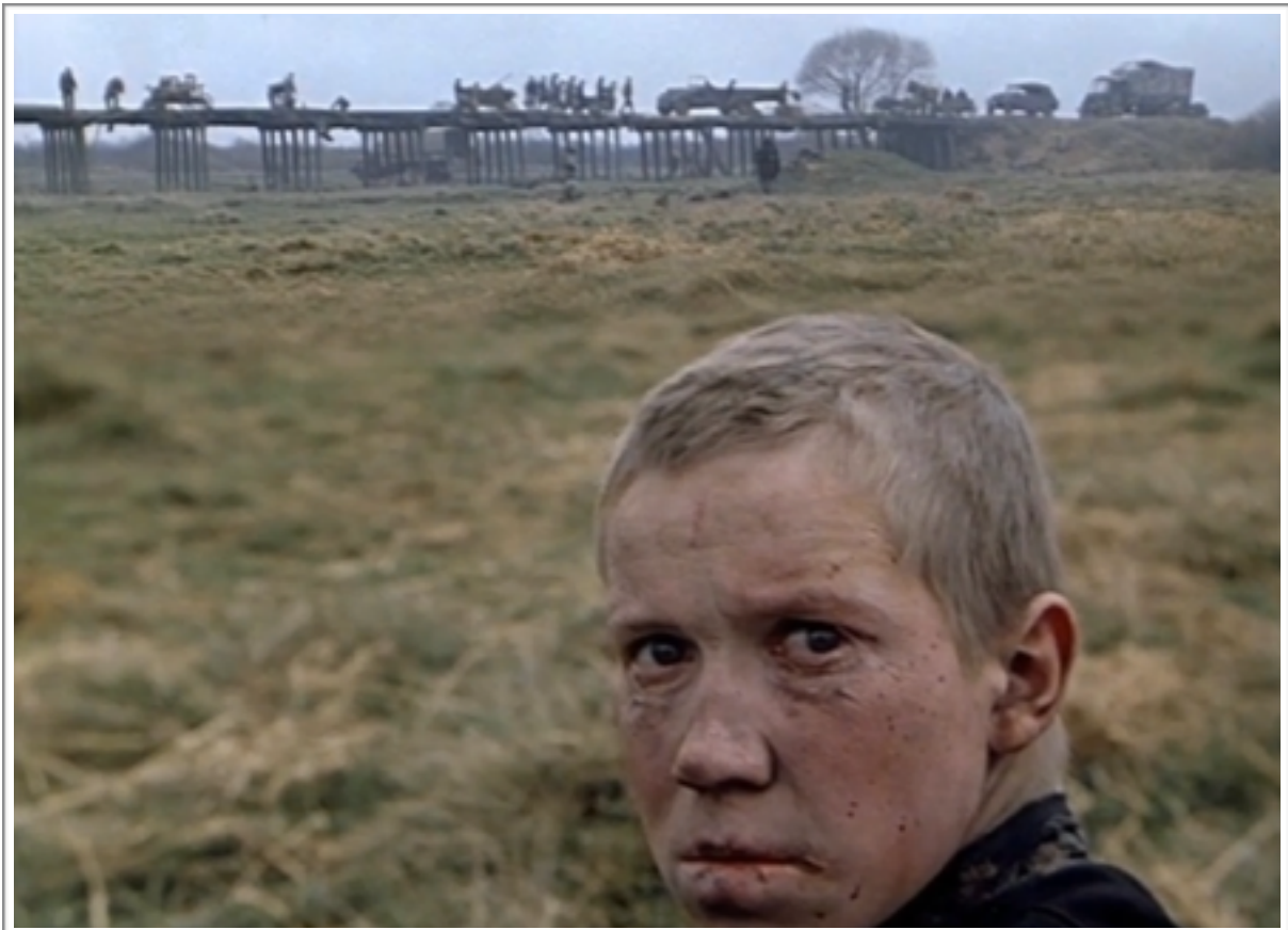
Le spectre de Flora, après le massacre.

Mais à présent que nous avons rendu compte de cette figuration de la folie à travers une appréhension directe des visages des comédiens, de leur physionomie, il est nécessaire de faire remarquer que sa présence à l'écran va bien au-delà de ce qui y est figuré. En effet, la mise en scène paraît également habitée par une forme de démence qui semble totalement échapper à son contrôle, et qui trouve son paroxysme dans la séquence du massacre.