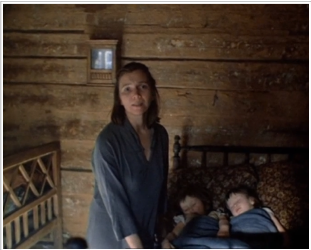
Atmosphère russe, Va et regarde d'Elem Klimov