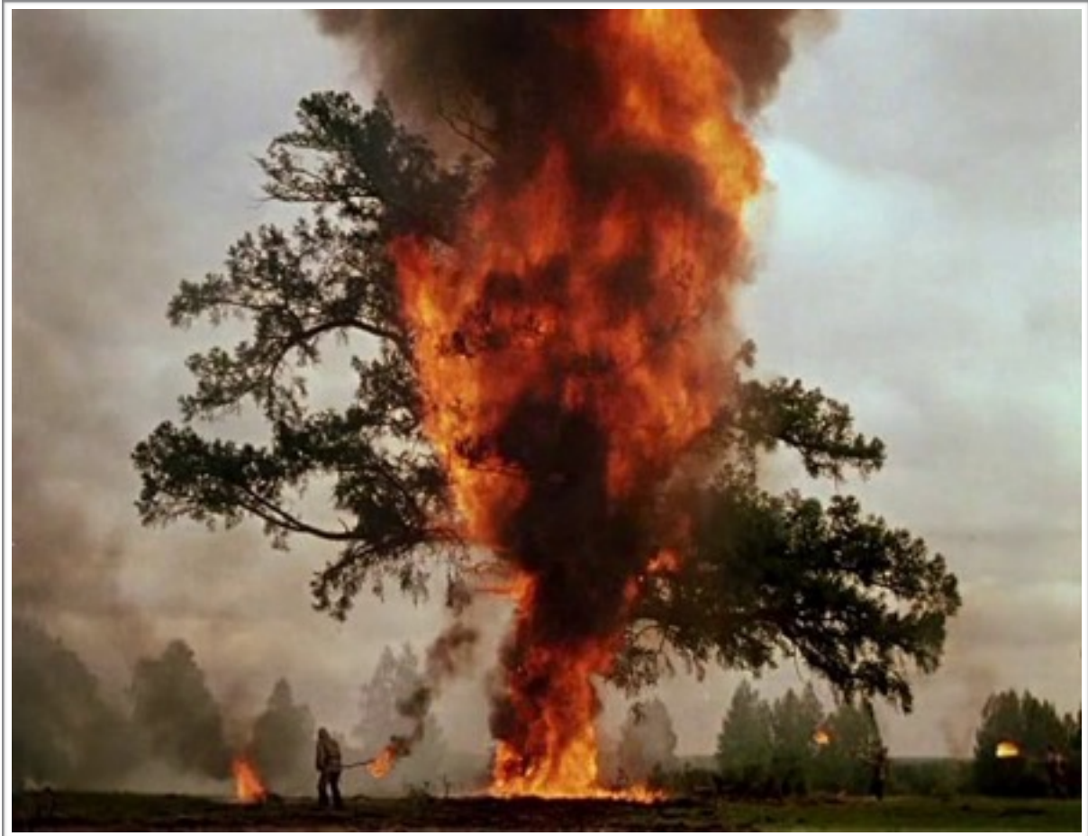
La destruction de la nature dans Les adieux à Matorra d'Elem Klimov.

Dans cette considération de la nature empreinte de spiritualité, on comprend la place particulière et primordiale qu'elle occupe au sein de Va et regarde : l'environnement est autant victime de la guerre que l'homme. Néanmoins, remarquons que cette dégradation de l'environnement ne se limite pas à une plate