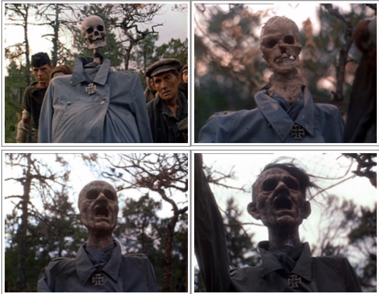
Memento Mori : régénération d'un corps.

naturellement, les éléments fondamentaux du système des images grotesques, et vont s'opposer aux images classiques d'un corps humain achevé, en pleine maturité. À partir du moment où l'esthétique grotesque s'appuie sur l'image d'un corps qui se