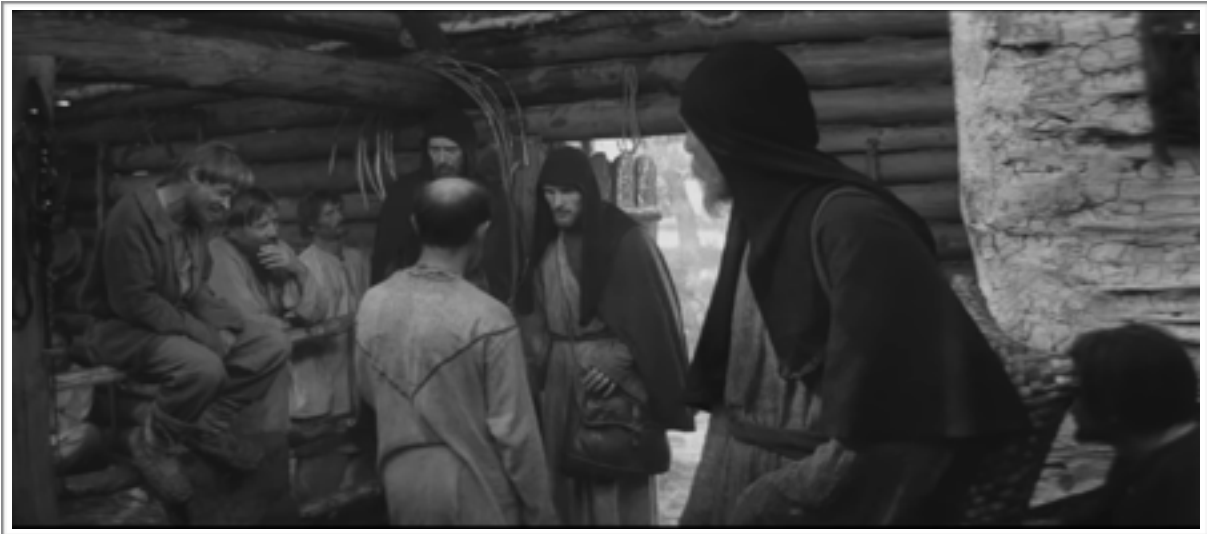
La reconstitution médiévale dans Andreï Roublev d'Andreï Tarkovski, 1966

contrôlables puisque soumis à leur environnement), toutes ces constituantes de la reconstitution semblent comme capter dans l'instant, et à aucun moment ne se posent dans l'esprit du spectateur des réflexions tel que : « les costumes sont bien faits, les accessoires font vrai, les décors sont réels », qui ne renvoient qu'à une forme d'acceptation de l'illusion recrée mais qui, dans le même temps, créent une certaine distance vis-à-vis des événements et des situations qui s'en trouvent charger de cette illusion, et donc de cette artificialité.