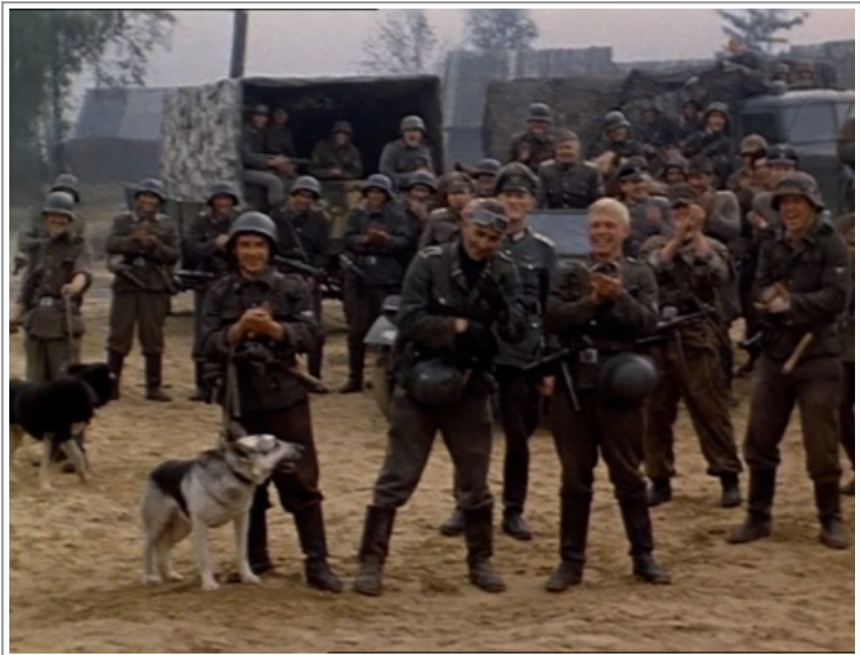
Les soldats allemands rient et applaudissant pendant la mise à feu de la grange.

d'intelligence. Et c'est de cette idée dont s'imbibe l'horreur du film de Klimov, car elle en est à l'origine : toute cette entreprise exécrable qui donne lieu à l'extermination du village n'est pas purement aléatoire, elle n'est pas la résultante d'une folie passagère où la raison aurait un moment abandonné la conscience de ces hommes, encore moins celle de bêtes sauvages dans la nécessité de se nourrir ; non, elle est opérée