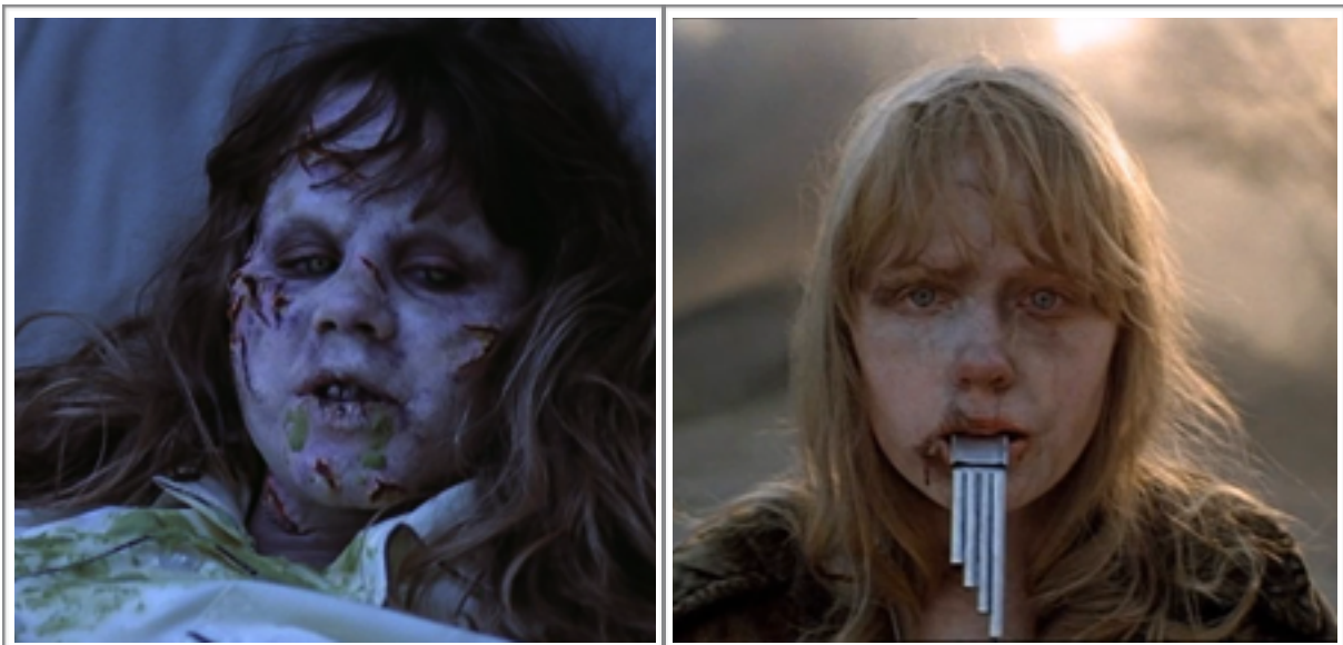
Le corps ravagé de Regan par la présence du démon dans L'exorciste et le corps ravagé de Glacha par la guerre dans Va et regarde.

adolescente possédée par le démon ? Dans ce film, la manifestation de la possession, si elle s'exprime en premier lieu par des considérations d'ordre comportementales (les crises épileptiques, la vulgarité qui s'empare de son langage, les pensées obscures dont elle témoigne, etc...), trouve également son expression à travers le corps, et ce de manière spectaculaire, puisque au bout d'un moment, le corps, dont la peau est recouverte de plaies infectées et prend une teinte verdâtre, signe de sa décomposition, ressemble à celui d'un mort-vivant. Pourtant, la jeune fille ne paraît pas avoir subi de violences physiques directes (en tout cas, cela ne nous est pas montré) : c'est un peu comme si le corps réagissait de lui-même à la présence du mal qui s'était emparé de lui. N'est-ce pas quelque chose de similaire que propose Va et regarde à travers la décomposition du corps de son jeune