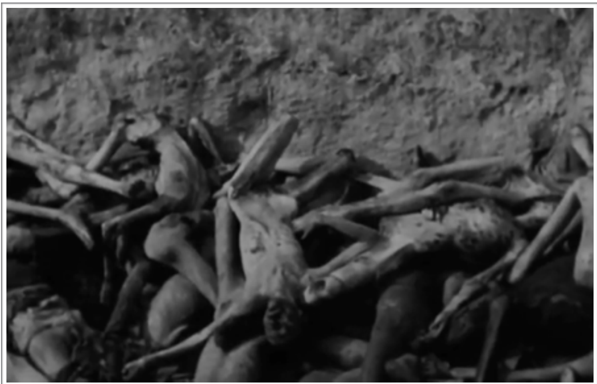
Nuit et brouillard d'Alain Resnais, 1956

drame écrivait à propos de Nuit et brouillard d'Alain Resnais : « Toute la construction du film, toute son écriture, concourt à laisser place à l'activité mentale du spectateur. c'est ce que Resnais appelle la "mémoire active", que l'on pourrait nommer "mémoire en construction" » 31 . Va et regarde constitue certainement l'inverse le plus pertinent de cette définition, tant il ne laisse justement aucune place à « l'activité mentale du spectateur ». Il ne laisse aucune place à ces moments où l'on peut prendre conscience de ce qui se passe, y réfléchir, rationalisé ou même intellectualisé à propos. Et c'est ce qui fait sa force et peut-être même la noblesse de sa volonté à représenter l'immontrable, comme nous allons le voir. Du reste, c'est peut-être cela qui constitue la particularité de ce cinéma d'immersion : empêcher à tout prix le spectateur de réfléchir à ce qui se passe, à ce qui nous est montré, percevoir les événements avec le moins de recul possible. C'est pourquoi il nous importe à présent d'analyser cette spécificité du dispositif immersif auquel a recours Va et regarde .