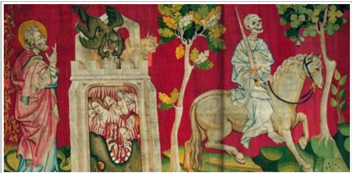
Tenture de l'Apocalypse n d'Anvers.

L'Apocalypse de Saint Jean, Chapitre VI, Versets 6 et 7