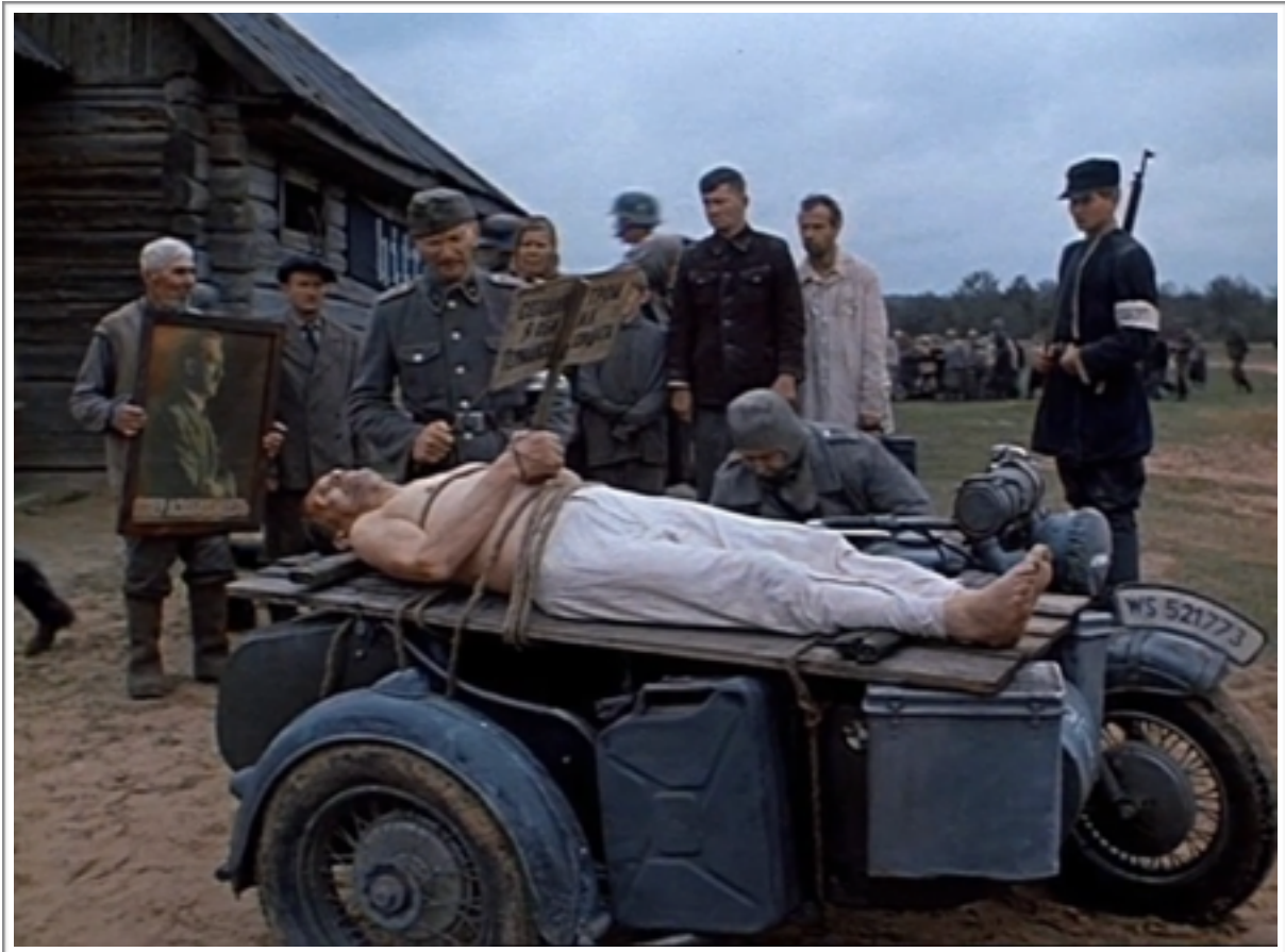
Le corps troué de balles de l'homme affublé de la pancarte : « J'ai vexé un soldat allemand ce matin ».

élaboré par des esprits intelligents, rappelant celui d'une usine à la chaîne, élaboré selon le modèle de Ford. Le plus déconcertant dans cette disposition, et le plus insupportable à la raison, c'est cette idée que le progrès, le développement humain, son intelligence, son mûrissement intellectuel (ce par quoi il s'élève par rapport à son