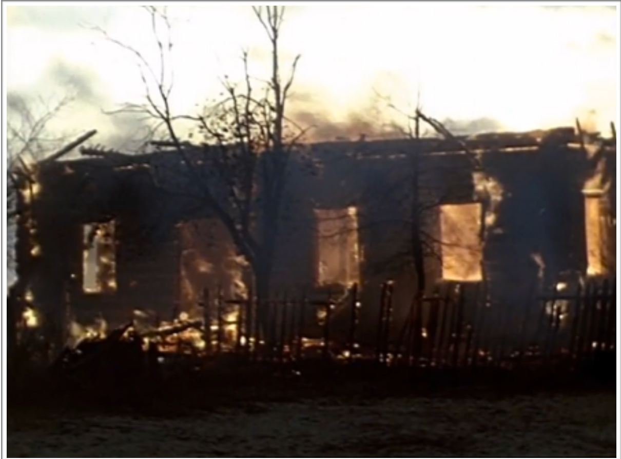
Paysage apocalyptique après le passage de la horde.

affecte le monde finit par engloutir tout résidu de naturel, toute trace de beauté : c'est l'apocalypse. Cette apocalypse a lieu au moment où cette horde de démons envahit le village pour en détruire la vie, vie végétale et animale. La nature est éclipsée : plus un arbre à l'horizon. Seules subsistent les flammes qui rongent les granges et les maisons.