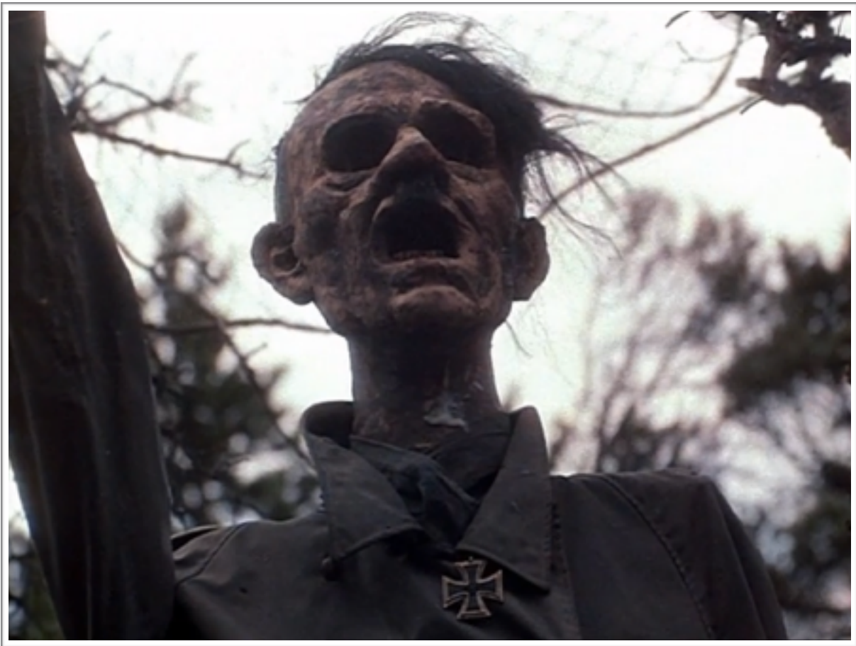
La reconstitution en boue d'un d'Hitler maléfique.

Évidemment, cette figure totémique étrange et inattendue au milieu de ce camp de réfugiés et à laquelle le cinéaste loue une attention particulière s'imprègne d'une aura obscure, pour ne pas dire maléfique. De plus, étant donné que cet objet ne dessert aucunement les enjeux dramatiques propres à la fiction, sa présence laisse libre cours à une interprétation symbolique de la part du spectateur. Mais la cérémonie ne s'arrête pas là puisque cet épouvantail de la mort va être amené à évoluer tout au long de la séquence, à se former, et par le même coup, à révéler sa véritable nature. À partir de ce squelette que quelques hommes enduisent de boue, une figure va progressivement se révéler. Au cours de sa reconstitution, la « chose » prend des allures effroyablement grotesques et difformes, au fur et à mesure qu'on lui reconstitue une partie du visage, puis qu'on lui ajoute un nez, puis des oreilles... Nous voyons les hommes s'adonner à cette tâche avec un malin plaisir. À la fin, nous sommes tout à fait disposés à comprendre de quels traits la figure tient-elle, lorsqu'une fois habillée de cheveux et d'une moustache, nous la retrouvons en plan