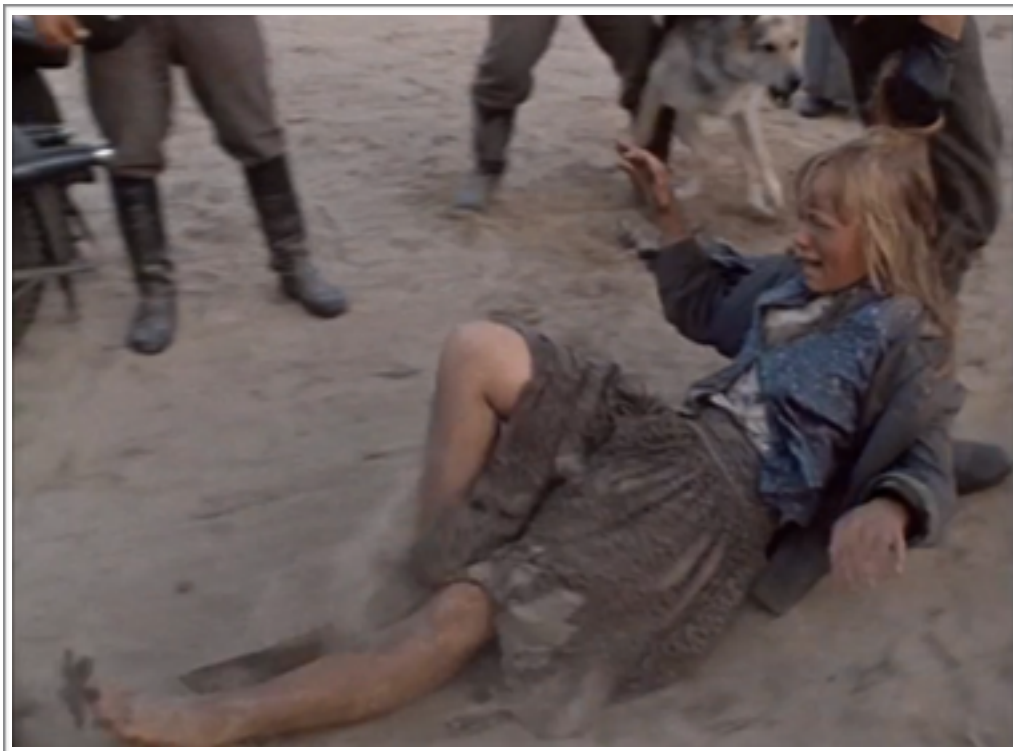
La femme tirée par les cheveux.

recours à un trucage invisible dans la figuration de cette action, tel que l'utilisation d'une perruque). Néanmoins, l'impact réaliste est saisissant (d'autant plus que le jeu de la comédienne est particulièrement convaincant). Maintenant imaginons la même scène décomposée par plans avec une valeur plus rapprochée : dans l'un, uniquement la femme trainée, dans l'autre, uniquement l'homme la trainant. Dans cette disposition, même si le raccord entre les deux plans peut-être relativement bien maîtrisé, l'impression réaliste sera par essence moindre, parce que le spectateur est tout à fait disposé à penser que la femme ne se fait pas réellement trainer, parce qu'on ne la voit ainsi que par le raccord entre les deux plans de l'action (c'est la particularité du trucage cinématographique, trucage permis par le montage). L'impression réaliste du film, et en particulier de la séquence du massacre, tire grandement parti de ce procédé car, comme nous le dit Bazin à propos du documentaire, la « rupture ( par le montage donc ) transformerait la réalité en sa