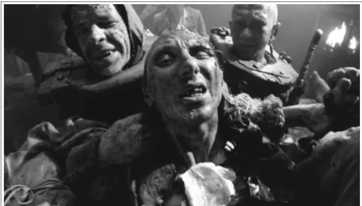
Un personnage prenant conscience de la présence de la caméra dans Il est difficile d'être un dieu d'Alexeï Guerman (2013).

En effet, ces regards-caméra ne participent pas non plus d'une approche que l'on pourrait qualifier de documentaire - dans le sens où une caméra dépêchée au milieu d'une population non avertie de sa présence (par exemple dans la rue) captera nécessairement des regards déplacés ou curieux. Cela est plus surprenant il est vrai au sein d'une fiction, où tous les figurants sont a priori au courant de la présence de l'appareil. Néanmoins, on trouve des exemples frappants de cette utilisation du regard-caméra, notamment chez un contemporain de Klimov, Alexeï German que nous avons déjà eu l'occasion de citer, dans l'un de ses films de fin de carrière, sorti en 2013. Le film en question s'intitule Il est difficile d'être un dieu et juxtapose de manière étrange et bizarre la science-fiction et le film médiéval. Tout le film est tourné à travers de très longs plans séquences quasiment sans interruption de l'action. Dans ce film, la présence physique de la caméra est non seulement très discernable à l'écran, de par sa mobilité dans l'espace et sa continuité dans le temps (pas de montage par collage de plans successifs), sans pour autant s'accorder au