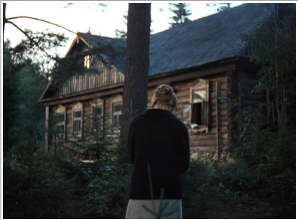
Atmosphère russe 2, Le miroir d'Andreï Tarkovski

quand il affirme ceci : « J'ai attaché dans mes films une grande importance aux racines, aux liens avec la maison paternelle, avec l'enfance, avec la patrie, avec la terre. Il était primordial pour moi d'établir mon appartenance à une tradition, à une culture, à un cercle d'hommes ou d'idées ». Et de continuer : « de grande signification sont ainsi pour moi ces traditions de la culture russe qui tirent leur origine de Dostoïevski. Or, pour l'essentiel, elles n'ont pas pu se développer dans la Russie contemporaine, où elles sont plutôt déconsidérées ou même totalement ignorées. Il y a des raisons à cela. D'abord leur complète incompatibilité avec la tradition matérialiste. Ensuite, le fait que la crise spirituelle que vivent tous les héros de Dostoïevski et qui inspire toute son oeuvre et celle de ses continuateurs, suscite l'inquiétude et la méfiance. Pourquoi craint-on tellement cet état de « crise spirituelle » dans la Russie d'aujourd'hui ? » 21