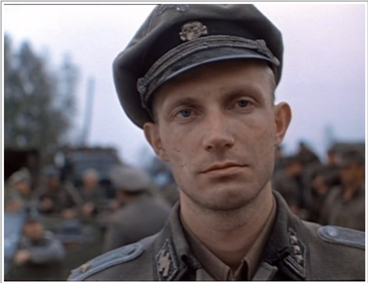
Le commandant nazi, incarnation de la plus manifeste de la « mauvaiseté du coeur humain ».

Ainsi se révèle toute l'entreprise du film, qui, conscient de cet état abstrait du mal, se lance malgré tout dans une quête d'éradication de son essence, d'exorcisation de son existence. Va et regarde cherche le mal, traque le mal, ne se contente pas de nous en montrer la manifestation avec toute l'impuissance de notre position par rapport à lui. Voilà là tout le défi du film : regarder le mal dans les yeux. Mais pour cela, comme nous le disions, il a besoin de l'incarner, de lui octroyer une figure à partir de laquelle il pourra ritualiser.