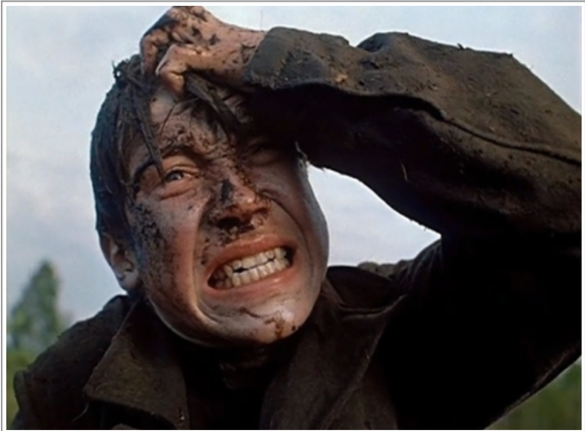
La grimace difforme de Flora lors de la séquence du marécage.

nous a rarement été donné d'éprouver à ce point la folie au simple contact de son comédien, qui semble littéralement se muer en un monstre difforme. L'ébranlement que procure un tel plan échappe à l'entendement, et serait presque capable de nous faire éprouver la folie, la démence, rien qu'en la voyant se modeler sur les traits d'un visage.