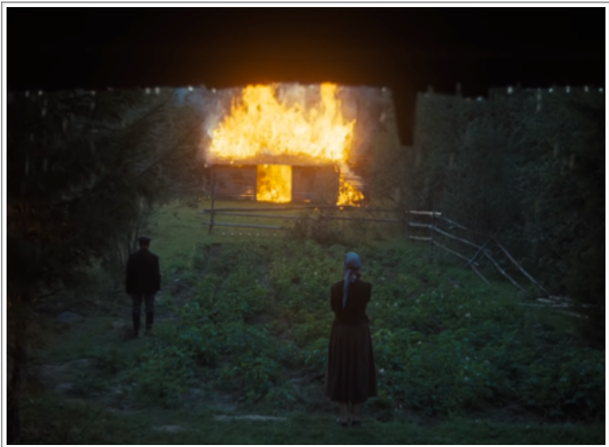
La mère devant la grange en feu dans Le miroir.

On peut en déduire que chez Klimov, le plan-séquence participe d'un rapport pragmatique de l'action. Il est aussi le plus souvent motivé par la dimension subjective qui s'accommode à la vision telle que nous la percevons : c'est-à-dire