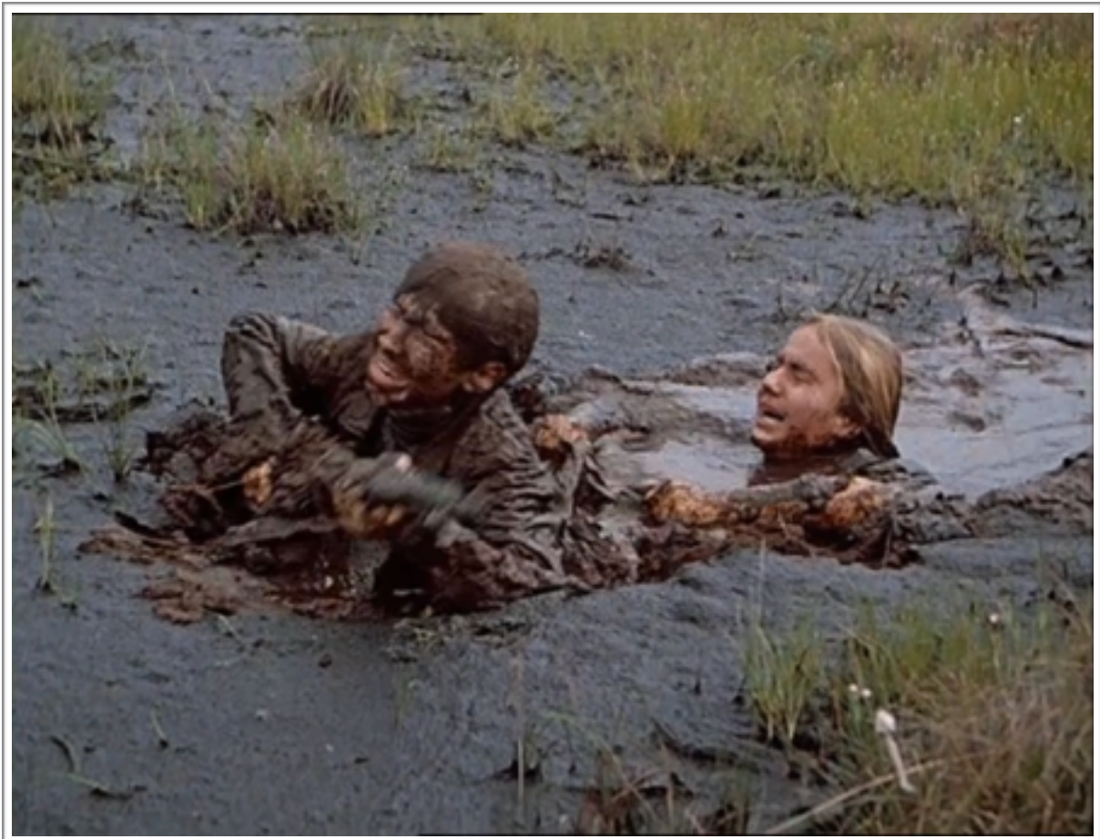
La traversée du marécage.

Cette « esthétique de la boue » n'est pas un cas isolé dans le paysage du cinéma russe, dans lequel on la voit souvent apparaître. Andreï Roublev de Tarkovski, par exemple, témoigne souvent de paysages désolés marqués par la boue (l'épisode de l'averse vers le début du film, où les trois moines rencontrent un