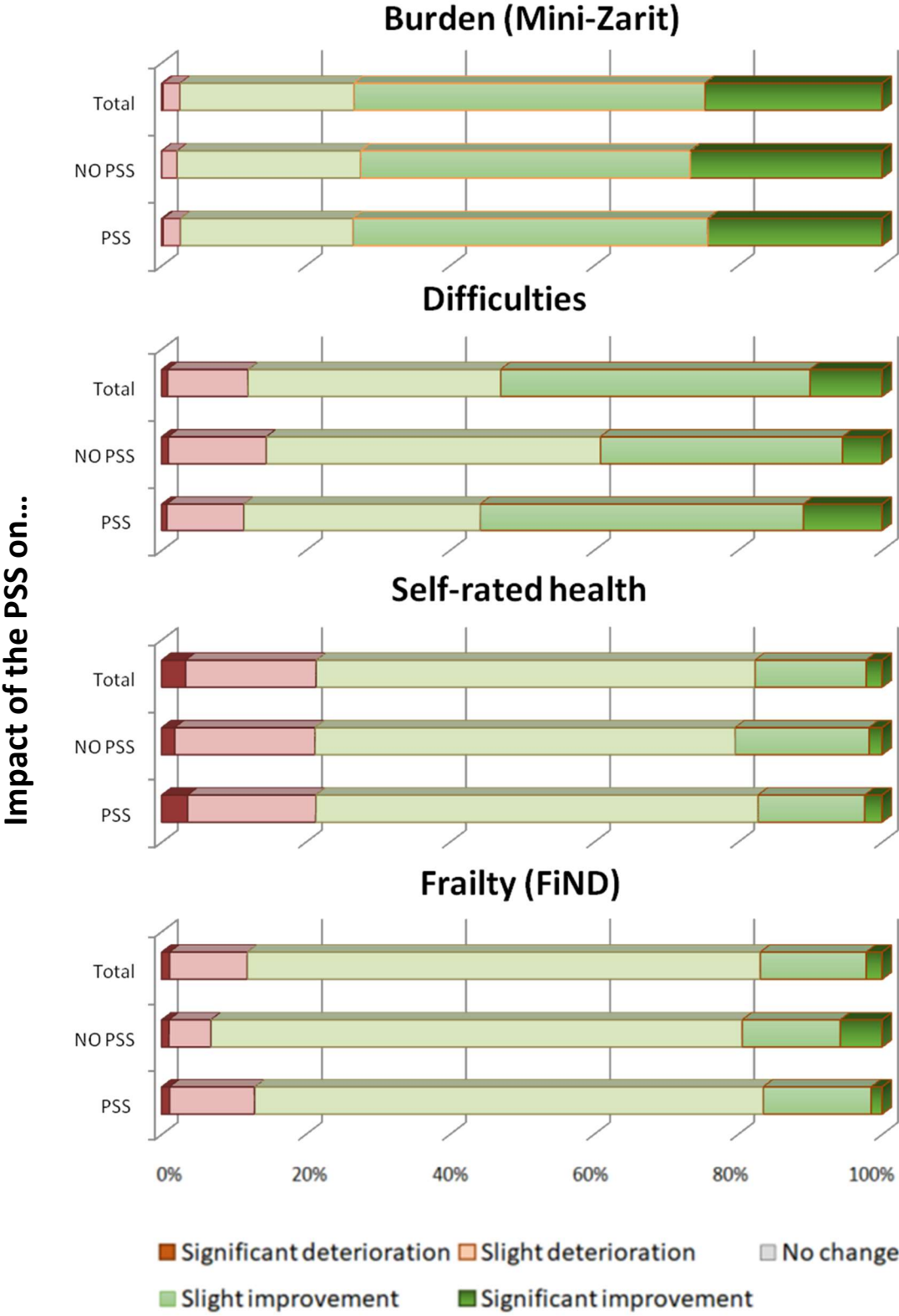
Figure 2_ Impact of the HCP on burden, hardship, self-rated health and fragility