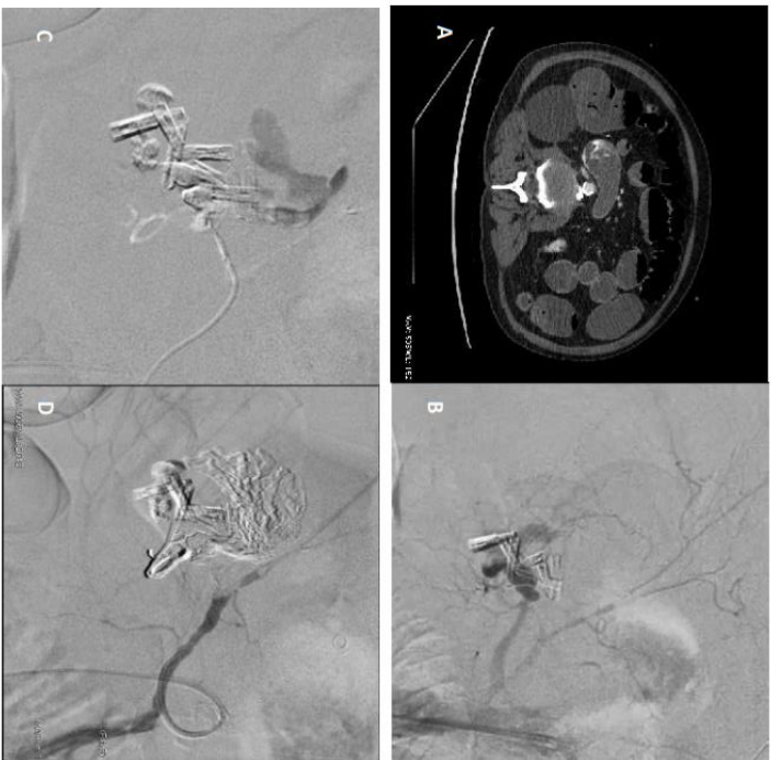
Figure 1 a. Enhanced Abdominal CT at portal phase reveals active arterial bleeding of a gastro-duodenal artery erosion with endoluminal extravasation iodinated contrast medium within the duodenum b. Abdominal angiography centered on digestive bleeding, and performed after failure of an attempted endoscopic hemostasis, finding the persistence of bleeding from a branch of the gastro-duodenal artery in projection of endoscopic clips. c. Angiographic control during expansion of Onyx® through micro catheter. d. Final angiographic control after Onyx® instillation and subtraction showing the success of the intervention with no more bleeding from the gastro-duodenal branch.