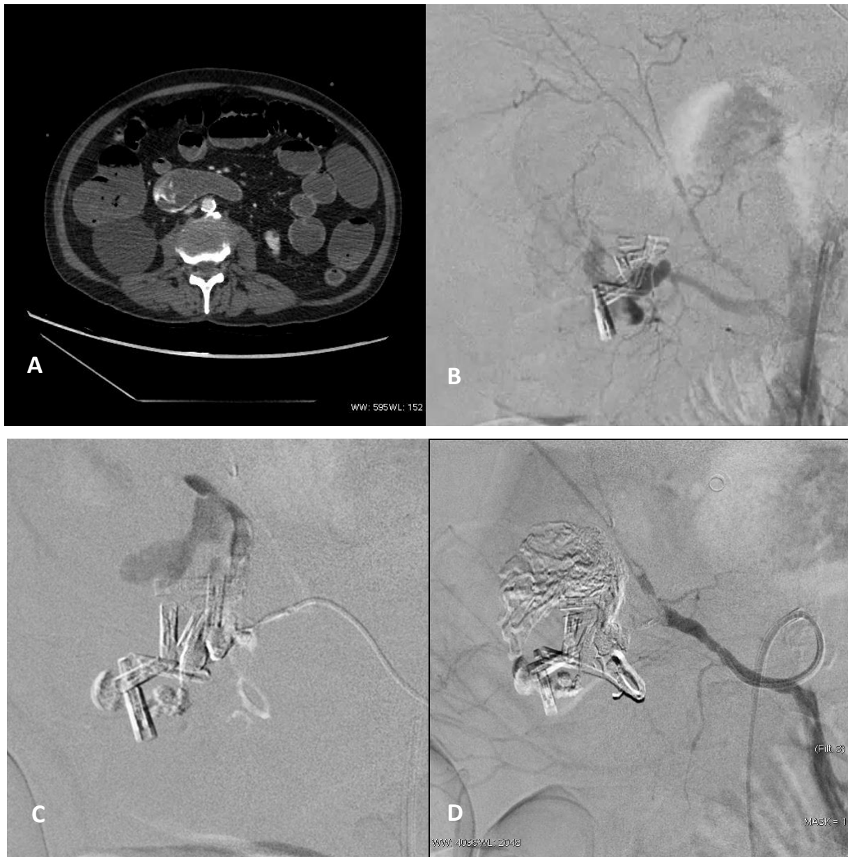
Figure 1 A. Scanner abdominal au temps portal de l'injection révélant un saignement actif artériel sur érosion d'une branche de l'artère gastro-duodénale avec extravasation endoluminale de produit de contraste iodé au sein du duodénum.

B. Angiographie abdominale centrée sur le saignement digestif, réalisée après échec d'une tentative d'hémostase par voie endoscopique, retrouvant la persistance du saignement d'une branche de l'artère gastro-duodénale en projection des clips endoscopiques.