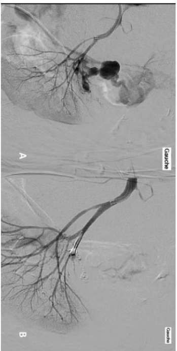
Figure 2a Catheterization of the left renal artery revealing several ruptured false aneurysms from an upper polar angliomyolipoma. b. Final control after injection of one Onyx® vial showing complete devascularization of the angliomyolipoma and complete stoppage of bleeding