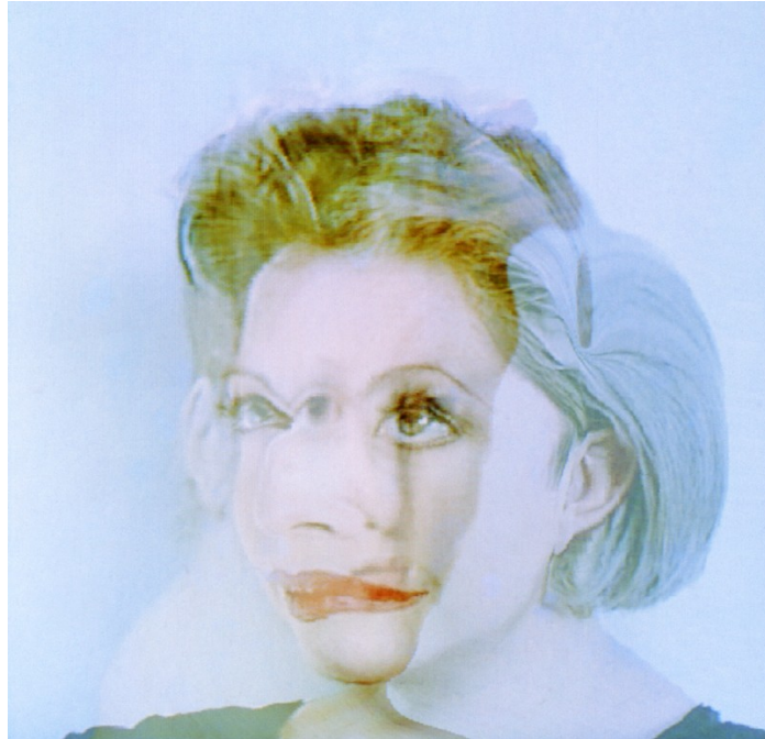
Self-Hybridation : Entre-Deux avec le portrait d'ORLAN n°1 , 47 × 63 cm, photographie couleur dans une boîte lumineuse, 1994