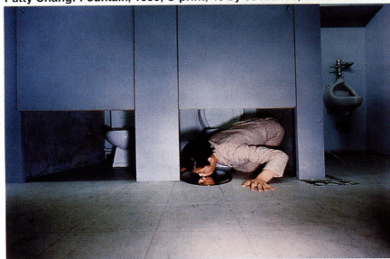
Patty Chang: Fountain , 1999, C-print, 40 by 60 inches; at Jack Tilton.

gender-savvy material; that response seemed to be both attraction and revulsion.