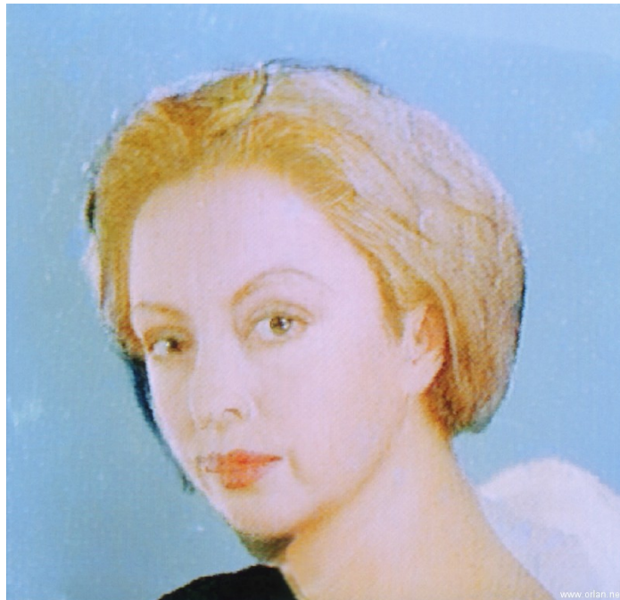
Self-Hybridation : Entre-Deux avec le portrait d'ORLAN n°3 , 47 × 63 cm, photographie couleur dans une boîte lumineuse, 1994