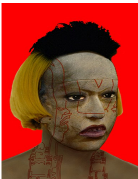
Défiguration-Refiguration, Self-hybridation précolombienne n°1 , 150 × 100 cm, cibachrome, 1998

Source : http://www.orlan.eu/works/photo-2/ (dernière consultation le 02/09/2019)