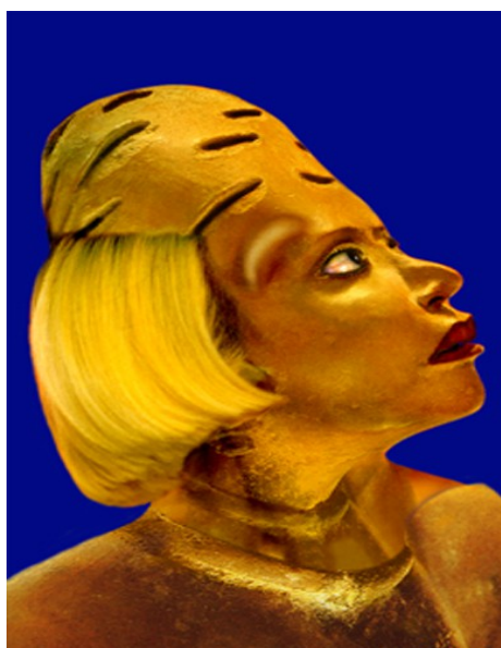
Défiguration-Refiguration, Self-hybridation précolombienne n°2 , 150 × 100 cm, cibachrome, 1998