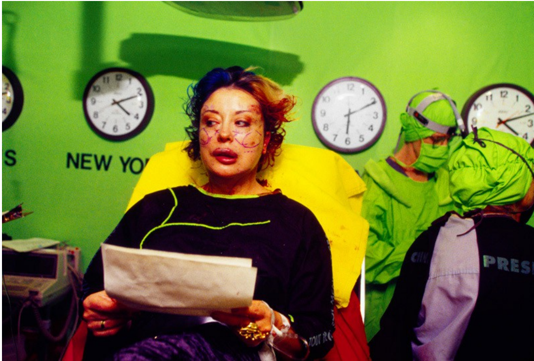
7 ème Opération-chirurgical-performance dite « Omniprésence », 21 novembre 1993. Cibachrome en diasec. 65 × 63 cm