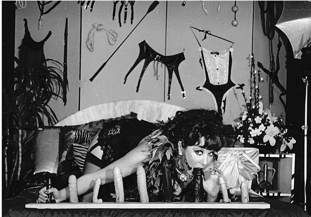
SPRINKLE Annie, Post porn modernist show , photographies de Leslie Barany, New-York, Harmony Theater, 1989