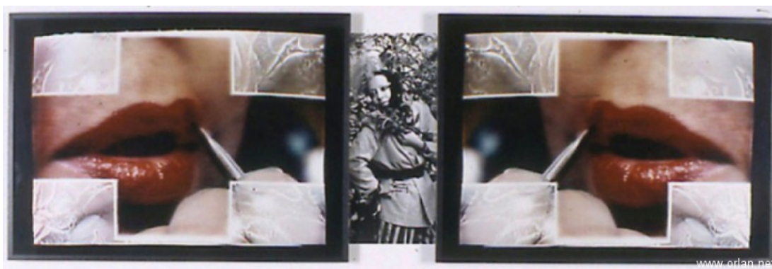
Séduction-contre-séduction. Triptyque photographique opération-opéra n°6, 1993 89 × 272 x 5 cm, deux cibachromes, cadre en bois noir, photographie noir et blanc.