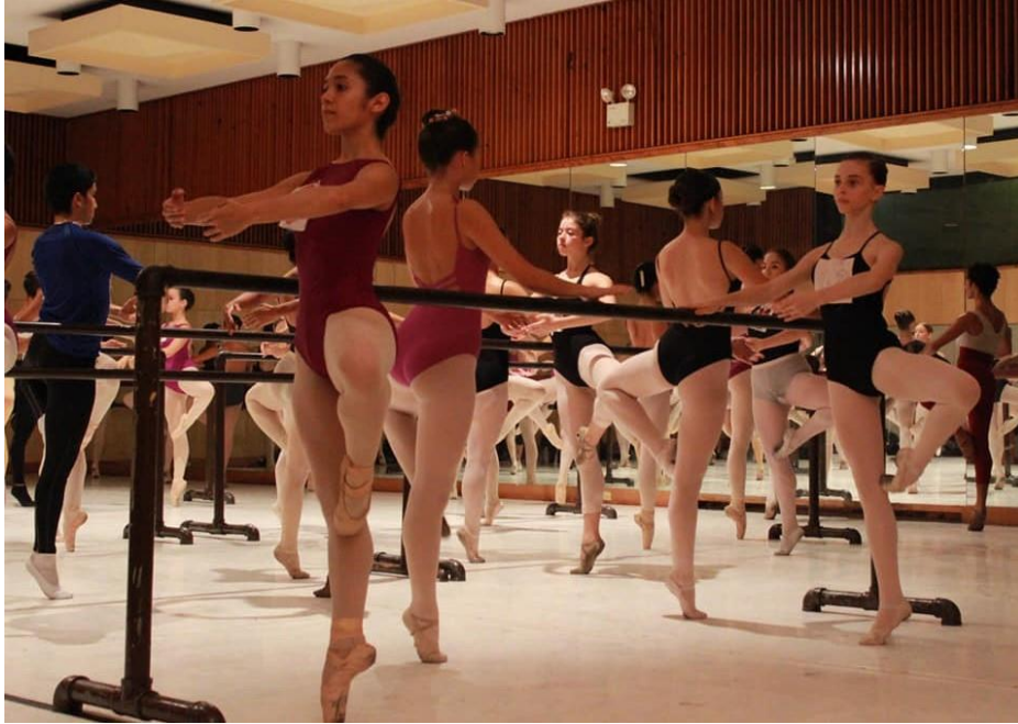
Fig. 15 Auditions Ballet Juvenil Teresa Carreño 2017 @ Teatro Teresa Carreño