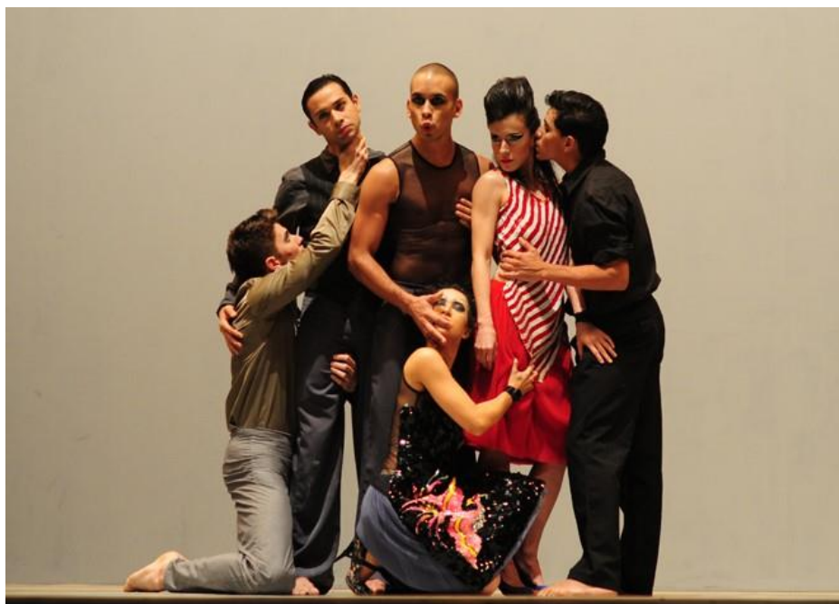
Fig. 13 Compañía Nacional de Danza @ Javier Gracia