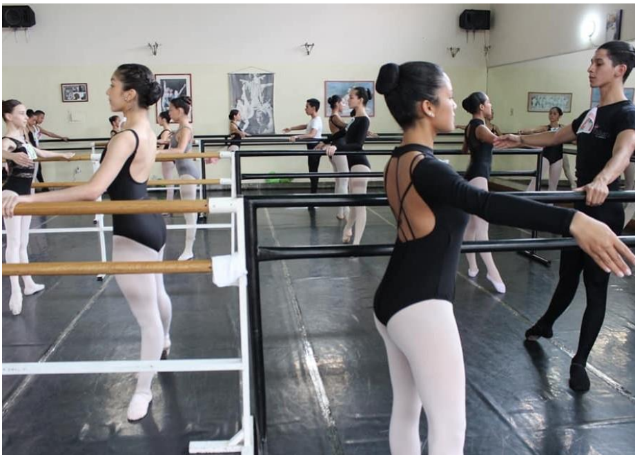
Fig. 15 Auditions Ballet Juvenil Teresa Carreño 2017 @ Teatro Teresa Carreño