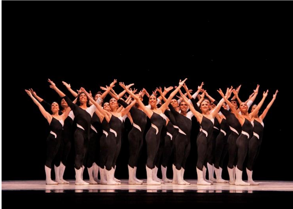
Fig. 11 Ballet Teresa Carreño