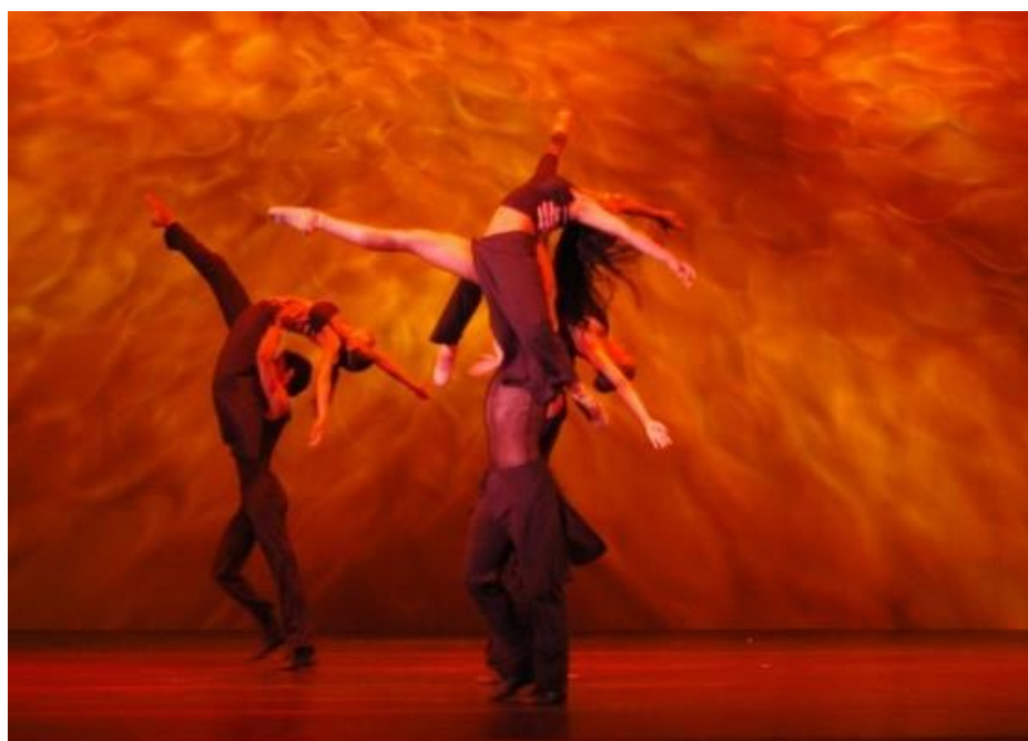
Fig. 14 Compañía Nacional de Danza