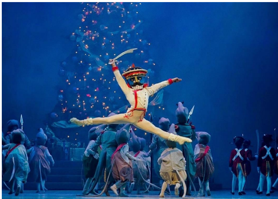
Fig. 12 Ballet Teresa Carreño @ Teatro Teresa Carreño