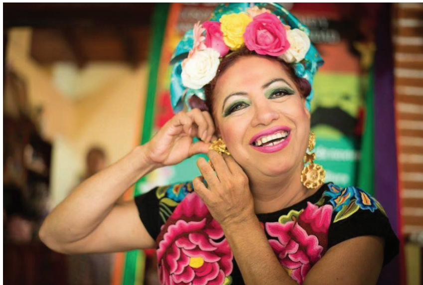
Figure 6 : Muxe

Les muxes, qui existent toujours dans la société actuelle, exercent des rôles socialement reconnus au sein de la famille et de la communauté : s'occuper du foyer, des grands parents, prendre soin des enfants. Traditionnellement, ils avaient également un rôle d'initiateur à la sexualité pour les adolescents.