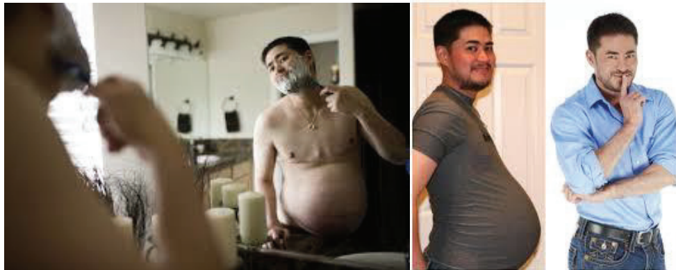
Figure 9 : Thomas Beatie , transsexuel FtM, premier homme enceinte

Nous commencerons par nous intéresser à la question du désir d'enfant chez le sujet transsexuel, désir qui, nous l'avons vu, se situe à la base du processus psychique conduisant à devenir parent. Il s'agira ensuite de traiter de la parentalité dans une approche plus juridique en nous intéressant à la filiation que peut établir un sujet transsexuel. Enfin, nous nous attarderons sur le terme de « transparentalité » dont fait usage un certain nombre d'études sur lesquelles nous avons appuyé notre travail, avant de nous attacher à comprendre quelles peuvent être les particularités de la parentalité transsexuelle, tant dans son expérience que dans sa pratique.