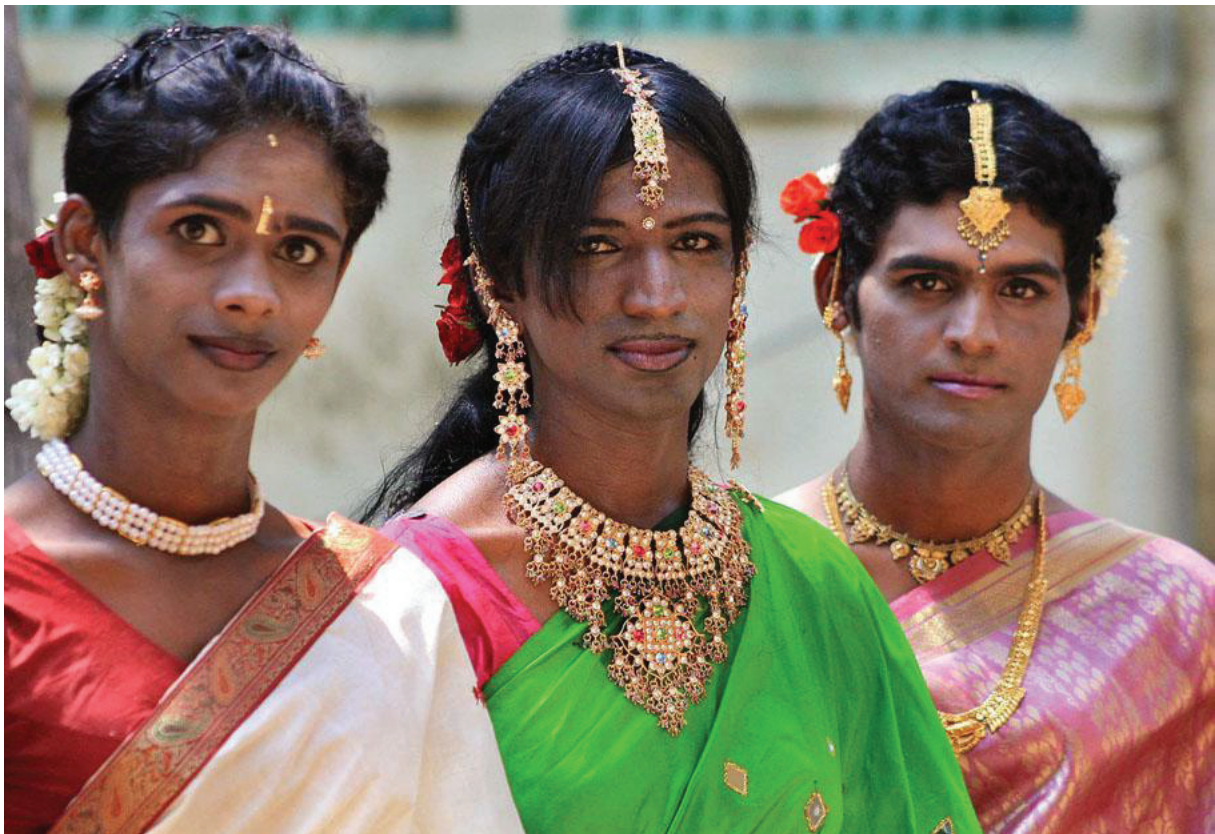
Figure 3 : Hijras

Plus récemment, en avril 2014, la Cour suprême de l'Inde a déclaré que le transgénérisme était un « troisième genre » dans la loi indienne. 12