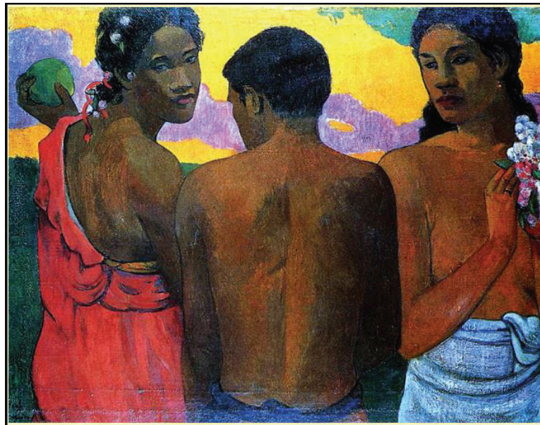
Figure 4 : Trois tahitiens

Mahu et RaeRae ne correspondent donc pas tout à fait à la même entité même si certains travaux les englobent sous le terme de « troisième genre ». Les RaeRae correspondrait plutôt à des individus à l'identité de genre féminin tandis que les Mahu s'apparente davantage à des hommes avec une expression de genre féminin.