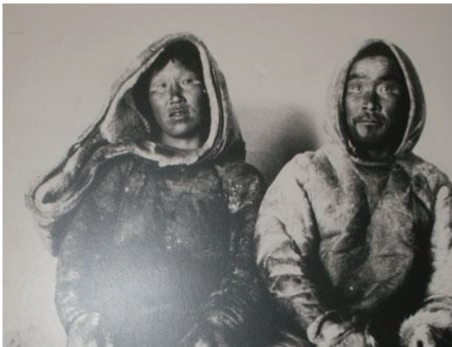
Figure 5 : Inuits

Dans la culture Inuit existe aussi l'idée que le bébé peut changer de sexe à la naissance, dans les deux sens. On les appelle les Sipiniit .