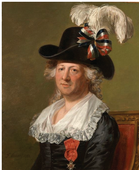
Figure 2 : Portrait de Charles de Beaumont, Chevalier d'Éon (1792)

Charles d'Éon de Beaumont, dit « chevalier d'Éon » (Delay, Deniker, Lempérière, Benoit, 1954), diplomate, espion, soldat et homme de lettres français du XVIIIème siècle est resté célèbre pour l'énigme qu'a représenté son identité sexuelle sa vie durant. D'Éon vécu en effet la première partie de sa vie, quarante-neuf ans, en tant qu'homme et la seconde partie, trente-deux ans, en tant que femme. En 1771, il affirme être une femme et non un homme. Condamné par Louis XVI à quitter l'uniforme et à ne porter que des habits de femme, il paraît à la Cour en robe à panier et corset mais voulant participer à la Guerre d'Indépendance des Etats Unis, il ne tarde pas à reprendre l'uniforme ce qui lui vaut d'être exilé. A la fin de sa vie, en Grande Bretagne, il continue de se battre à l'escrime habillé en femme. C'est à sa mort, qu'on découvre qu'il était anatomiquement un homme. C'est du nom de ce chevalier que provient le terme d'éonisme, goût pour le travestissement.