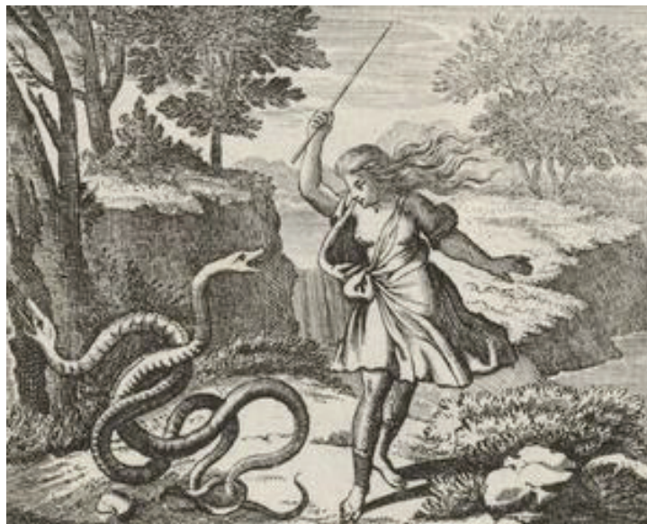
Figure 1 : Tirésias frappant de son bâton les deux serpents.

Le mythe de Tirésias est souvent avancé comme le premier cas de transsexualisme. La différence est néanmoins majeure entre Tirésias et le sujet transsexuel: alors que le héros grec se voit forcé à changer d'identité, le sujet transsexuel choisit ce changement et le réclame.