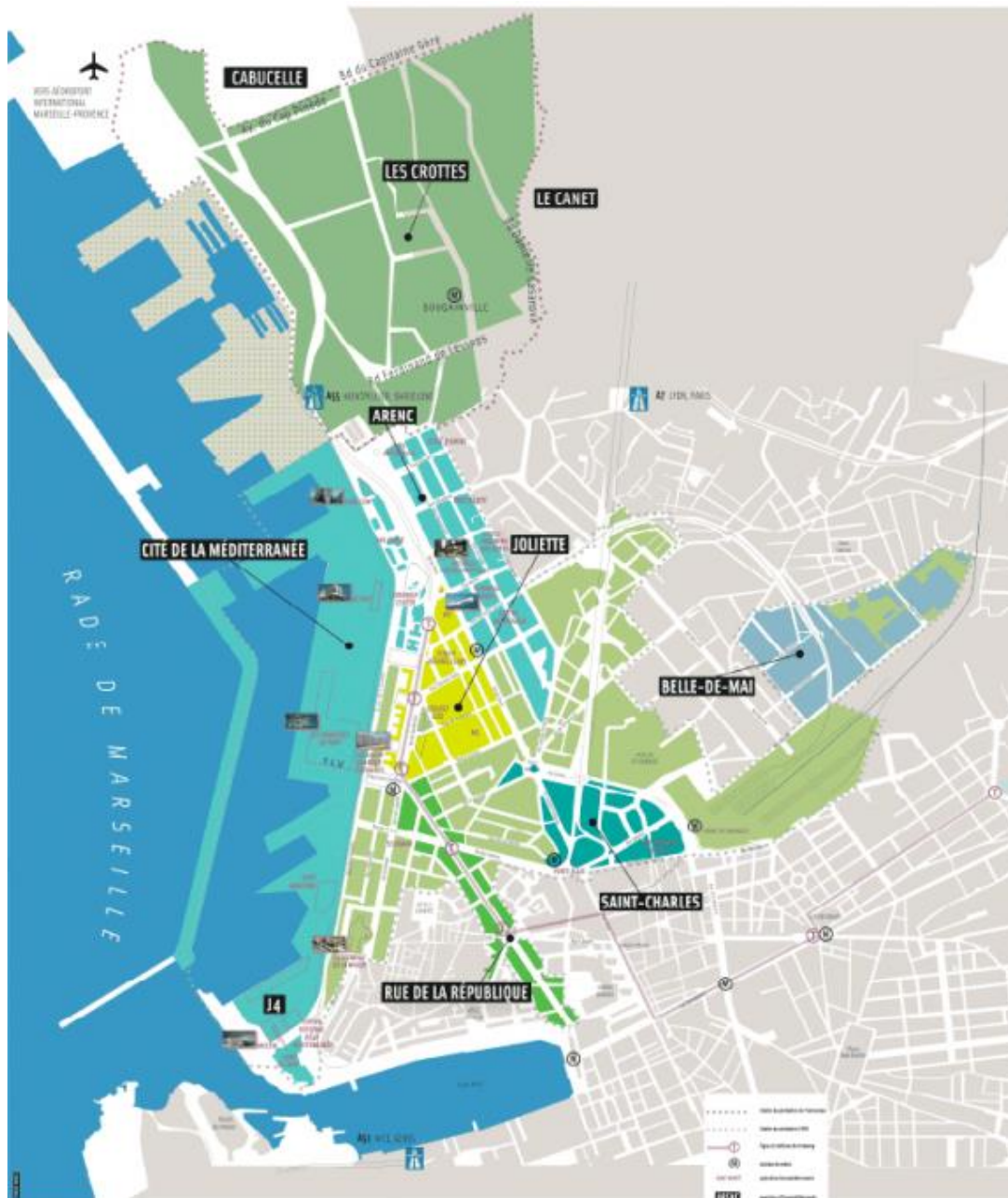
Périmètre d'Euroméditerranée

Le chantier vise un double objectif : retisser la trame urbaine entre des quartiers isolés les uns des autres par une topographie difficile, et rendre à ce périmètre sa vocation historique de principale porte d'entrée de la ville.