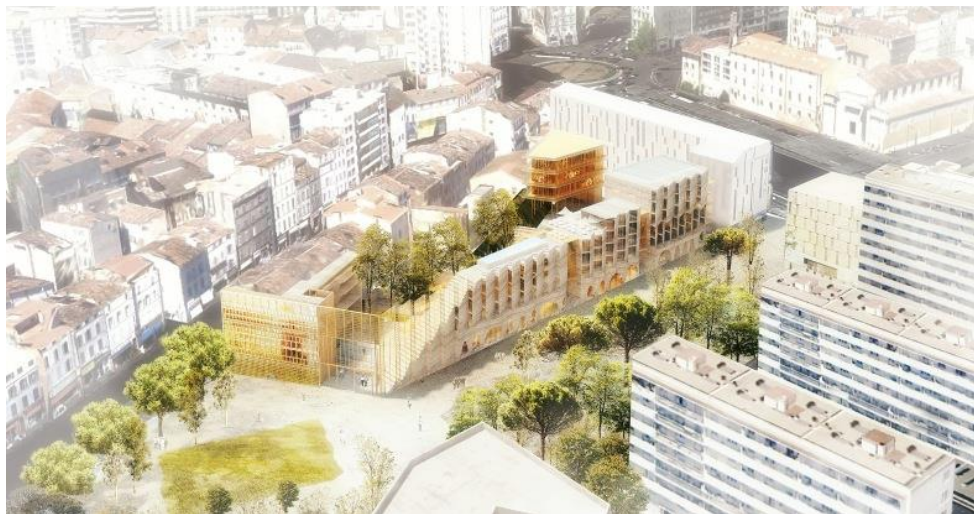
L'îlot du parc - Crédits : YTAA

Futur point de convergence de la vie étudiante marseillaise, ce nouveau pôle a également comme objectif de créer une véritable synergie avec les établissements supérieurs déjà existants de Saint-Charles, Colbert, Canebière, Aix-Marseille Université et ceux d'enseignement privés (École de Commerce et Management - EMD, École Axe Sud d'arts graphiques et de design, Maison méditerranéenne des métiers de la mode...)