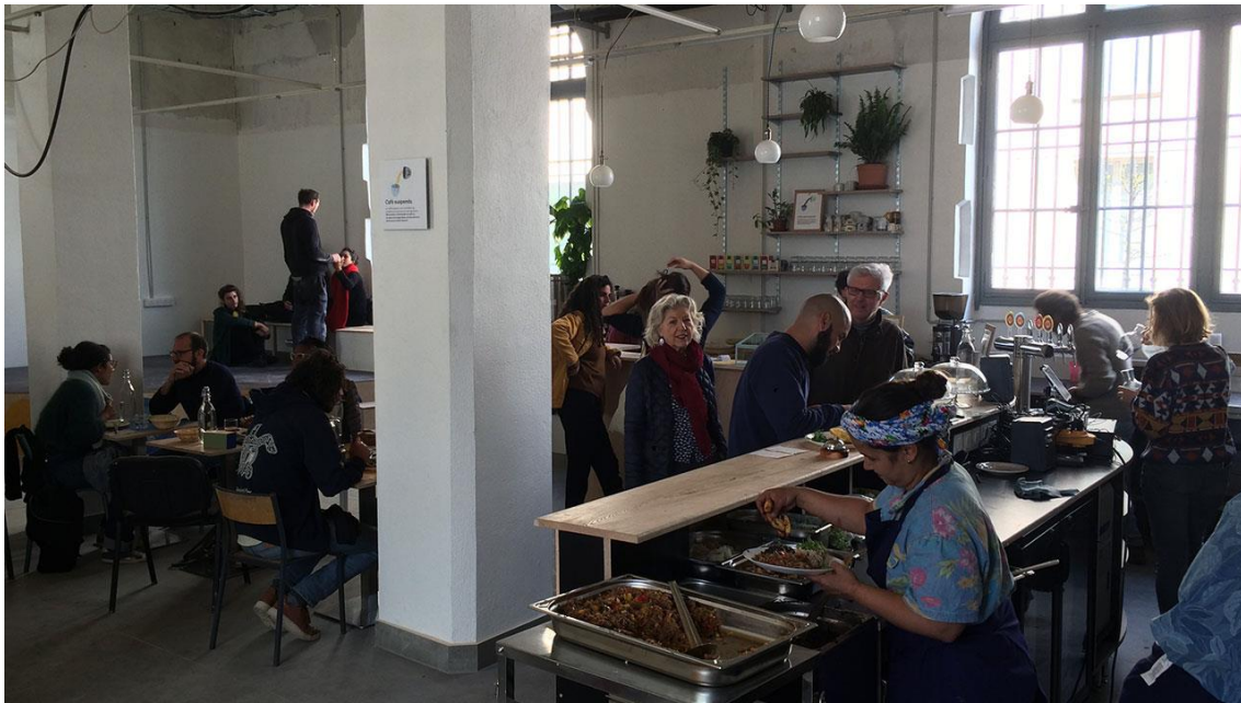
La cantine