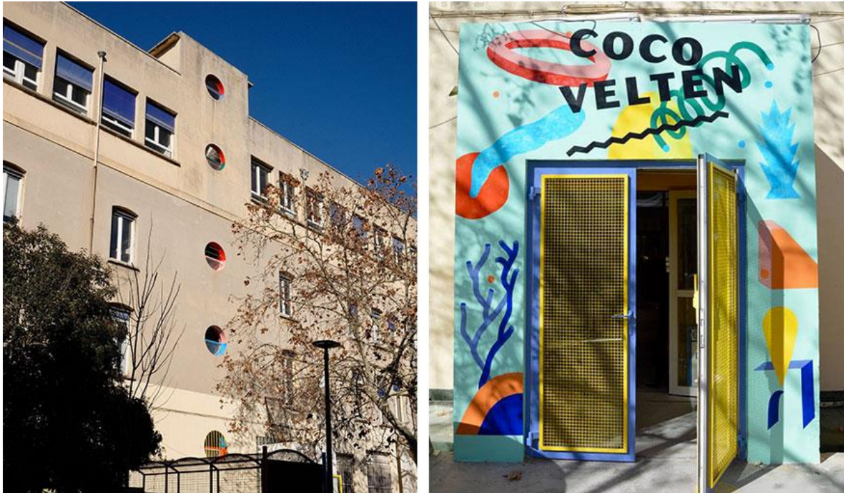
Façade et entrée de Coco Velten

« Il y a eu une période où chaque ville voulait son musée puis plus récemment, sa friche culturelle et aujourd'hui tout le monde veut avoir son « Grands Voisins ». Ce côté recette est dangereux car il ne faut pas perdre de vue que les singularités d'un site et d'un projet doivent rester au centre » (Fremaux, 2018).