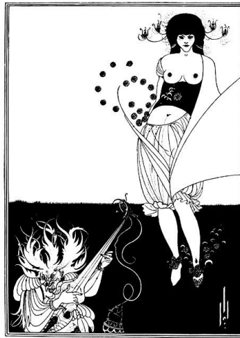
Aubrey Beardsley, The Stomach Dance , 1983, dessin

peuple. Cette idée de retrait des voiles a poussé de nombreux critiques à considérer Wilde comme le père du strip-tease, art qui explosa au XX e siècle, mais aussi, comme Toni Bentley dans Sisters of Salome , à lier Salomé et Inanna, une déesse qui devait retirer un vêtement ou un bijou devant chacune des sept portes des Enfers pour retrouver son amant, et qui est la première strip-teaseuse décrite. 63 Si l'on regarde les dessins de Beardsley, et plus particulièrement celui de la danse en question, on peut aussi lier Salomé l'Orientale à la danse du ventre qui avait été introduite à Londres la même année à l'occasion de l'Exposition Universelle :