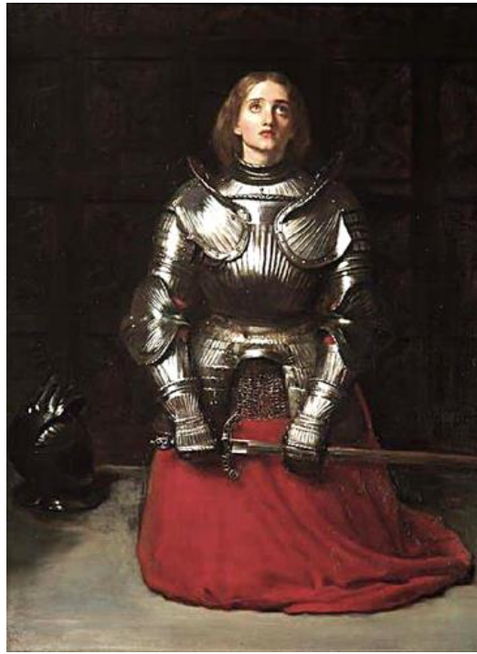
John Everett Millais, Joan of Arc , 1865, huile sur toile, 82x62 cm

en 1876 (Peinture 2). Grâce à leurs œuvres s'affiche alors clairement la dichotomie entre les représentations de l'époque médiévale et de l'Orient à travers les traits de ces héroïnes :