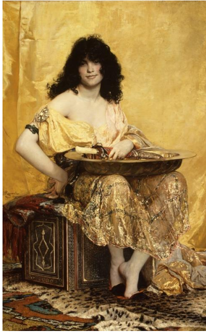
Henri Regnault, Salomé , 1870, huile sur toile, 160x103 cm