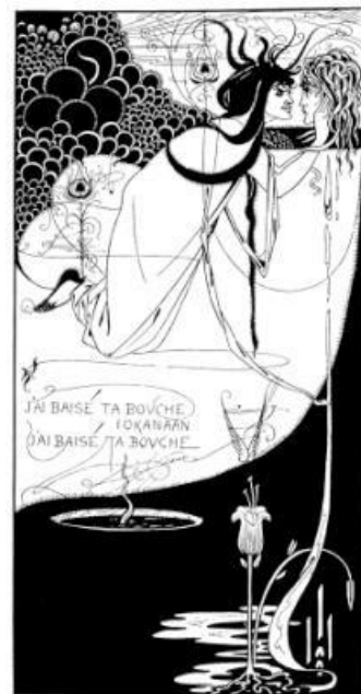
Aubrey Beardsley, The Climax , 1894, dessin J'ai baisé ta bouche, Iokanaan , 1894, dessin

Les dessins de Beardsley reprennent un élément important de la pièce de Wilde, qui l’associe une fois de plus avec le mouvement décadent : l’obscène. Étymologiquement, le mot « obscène » vient du latin « obscenus » (« sinistre, de mauvais augure, dégoûtant, indécent »), désigne ce qui ne peut pas être montré, ce qui heurte la décence, et est souvent lié à la sexualité. Dans la pièce de Wilde, ce qui peut être considéré comme décadent, que ce soit la luxure de la Princesse, une danse hypothétiquement trop osée, ou le baiser d’une tête décapitée, peut tout aussi bien être vu comme obscène, et est pourtant visible de tous, se déroule sur scène et sous les projecteurs. Comme la femme fatale que l’on ne doit pas regarder et qui est pourtant « montrée » par le dramaturge, les éléments obscènes ont une place importante, voire primordiale, dans la pièce : tout ce qui devrait être caché sous un voile de pudeur est montré (mis à part la fin même de l’héroïne, dont nous reparlerons plus tard).