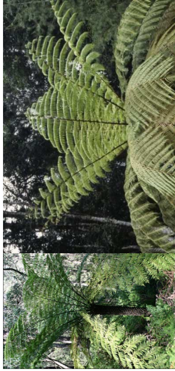
CYATHEA australis H= 6 m / mi-ombre-ombre / feuillage semi-persistant - Australie