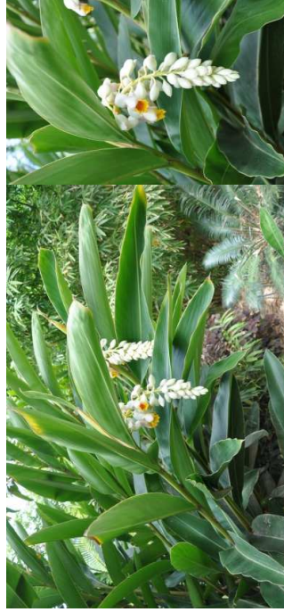
ALPINIA zerumbet H=2,50 m/9 à 11/soleil – mi-ombre/feuillage persistant – Asie S/Est