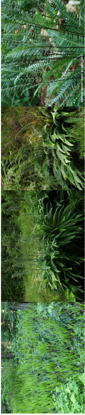
BLECHNUM spicant H=0,60 m / 3 u/m 2 /mi-ombre-ombre/ feuillage persistant - Europe, Asie du Nord, Amérique du Nord