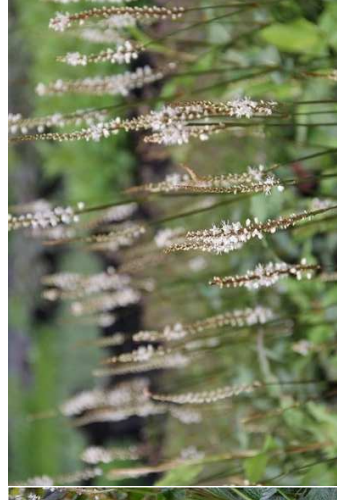
PERSICARIA amplexicaulis 'Alba' H=0,80 m/ 6 u/m 2 / soleil-mi-ombre - Himalaya