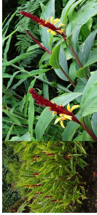
CAULEYA spicata 'Robusta' H=0,75–1 m/08 à 10/mi-ombre-Nord Inde