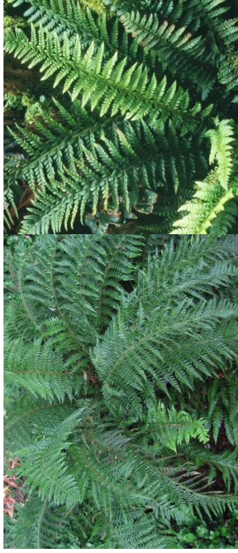
POLYSTICHUM aculeatum H=0,60 m /3 u/m 2 /mi-ombre-ombre/ feuillage persistant Europe