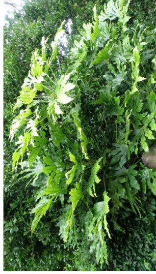
FATSIA japonica H= 3 m /07 à 08/soleil-mi-ombre/feuillage persistant – Corée, Japon