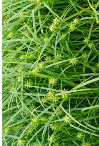
CAREX grayi H=0,50 m / 6 u/m 2 /soleil-mi-ombre/ feuillage persistant Amérique du Nord