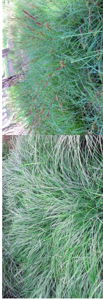
CAREX flacca H=0,40 m / 6 u/m 2 /soleil-mi-ombre/ feuillage persistant - Eurasie