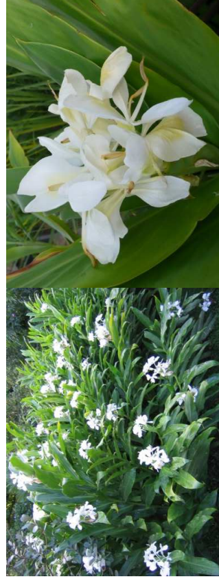
HEDYCHIUM coronarium H=1,50 m /08 à 09/soleil-mi-ombre/ Inde, Asie S/E