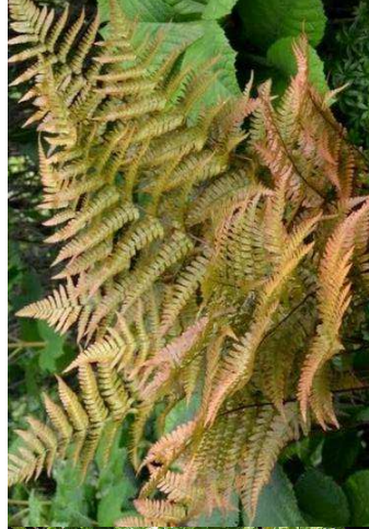
DRYOPTERIS erythrosora H= 0,80 m / 3 u/m 2 /mi-ombre-ombre/ feuillage persistant – Asie orientale