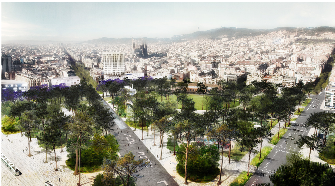
Fig. 10 - Perspective projet : Mise en avant des îlots de végétation et de la structuration par les axes routiers- Auteur : Agence TER© - Source : AGENCE TER, 2014.

Ainsi, le trio met directement en avant sa volonté d'expérimenter son principe d'écosystème vertical. Cette volonté transparait via les actions mises en place dans le projet. TER propose en effet de maintenir une continuité au sol afin de ne pas rompre avec les quartiers environnant tout en proposant des espaces déminéralisés facilitant les échanges naturels entre sous-sol et atmosphère. Ces actions permettent d'offrir une canopée végétale au sein même du parc/place et donc de former un réseau horizontal sur les strates supérieures. La canopée s'intègre dans le « vélum construit » de Barcelone et devient un « échangeur écologique ». C'est le concept de « nodes », développé par TER, qui est ici expérimenté pour la première fois.