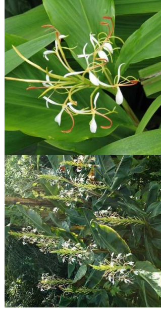
HEDYCHIUM spicatum H= 1 m/08 à 09/soleil-mi-ombre/ Asie