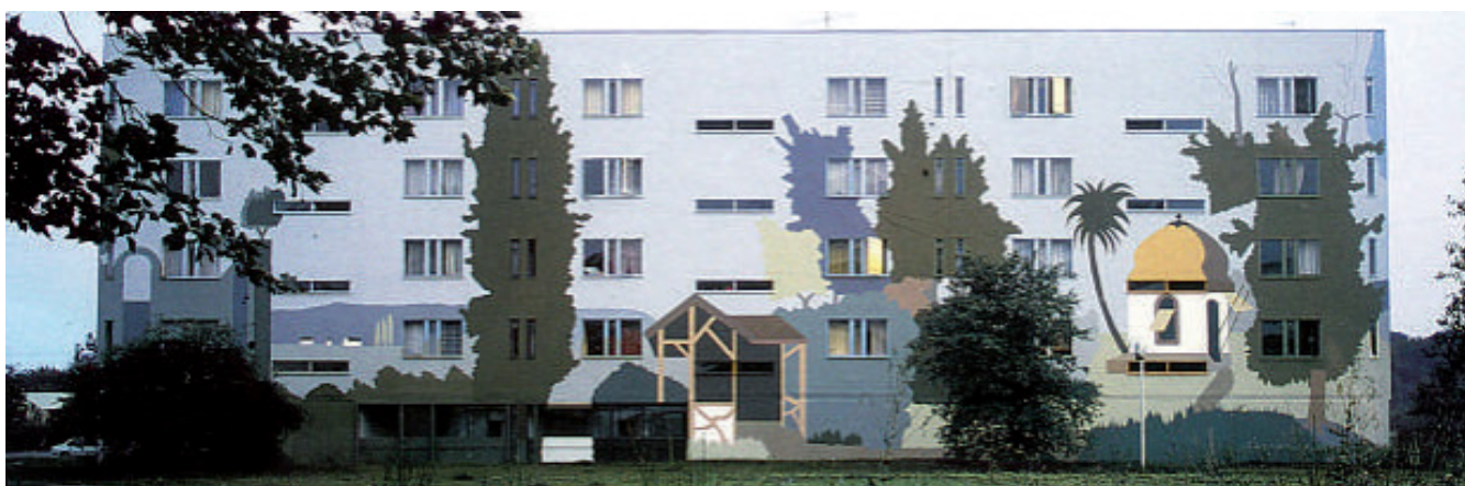
Fig. 1 - Coloration de façade sur un bâtiment HLM à Uckange par Bernard Lassus - Auteur : Monika Nikolic © - Source : Villes-paysages.couleurs en Lorraine , Bernard Lassus (1989)

Suivant la vaste période de crise, le désarroi du territoire fut fort. Ainsi, dans le courant des années 1970, une politique de requalification des espaces publics fut lancée afin de redorer l'image des villes-usines. Bernard Lassus, paysagiste et plasticien de la couleur, intervint sur plusieurs communes du bassin thionvillois. L'idée de l'artiste fut de reprendre et réinterpréter le paysage local au gré de peintures murales. Les façades des HLM autant que celles des pavillons furent concernées (Fig. 1). La recoloration des façades eut pour objectif de faire ressortir auprès des habitants les spécificités de leur paysage et de leur architecture. En outre, les pavillons et immeubles, qui jusque là étaient standardisés, s'en trouvèrent personnalisés.