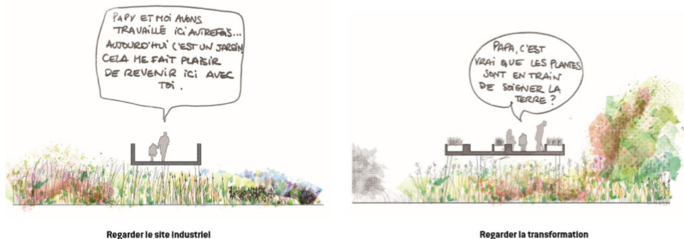
Fig. 7 - Illustration des divers usages du projet et du rapport avec le vécu - Auteur : Agence TER© - Source : AGENCE TER, 2015.

Concrètement, le vécu fut valorisé par l'intégration de visites guidées par l'association MECILOR, ayant participé à la protection du Haut Fourneau U4. Leur parcours pédagogique permit à d'anciens employés de conter le site et de partager l'expérience du lieu, son évolution, son histoire et les sentiments associés. (Fig. 7)