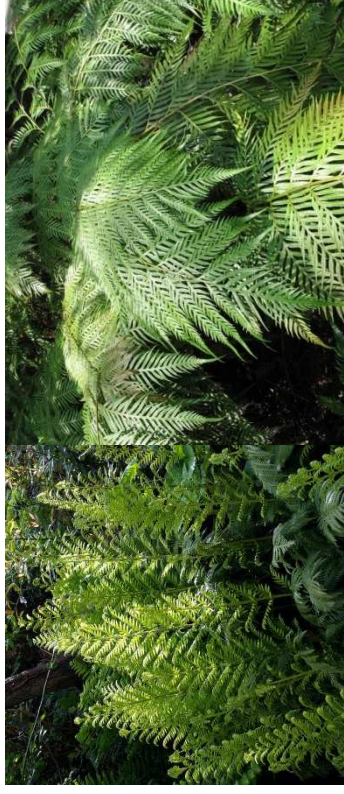
WOODWARDIA fimbriata H=1,60 m /1 u/m 2 – feuillage persistant Amérique du Nord