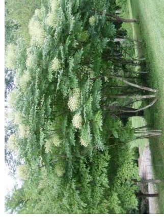
ARALIA elata H= 7 m /09 à 10/mi-ombre / Sibérie, Mandchourie, Corée, Japon