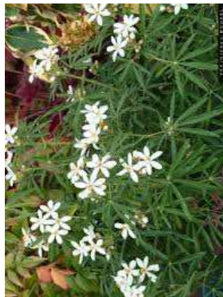
50 % CHOISY ternata White Dazzler' H= 1,50-2 m / 04 à 05 puis 08 à 09/ 1 u/m 2 feuillage persistant