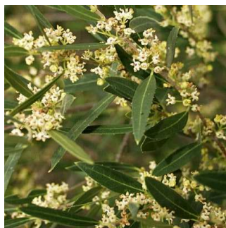
25% PHYLLIREA angustifolia H=3 m /05 à 06/ 1 u/m 2 - feuillage persistant