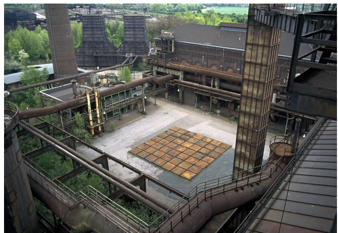
Fig. 2 - Piazza Metalica au coeur du site industriel - Auteur : Latzundpartner© - Source : [5]

Les architectes firent le choix de conserver, au centre de la place, une plaque métallique massive servant autrefois au travail de la fonte. Celle-ci s'éroda naturellement au gré des saisons et continua d'évoluer. La mise en valeur du patrimoine se fit dans une continuité du vivant et du mouvement et non par une mise sous cloche des structures. Ce choix est d'autant plus important qu'il fut accompagné de nombreuses craintes liées aux risques de pollution du site.