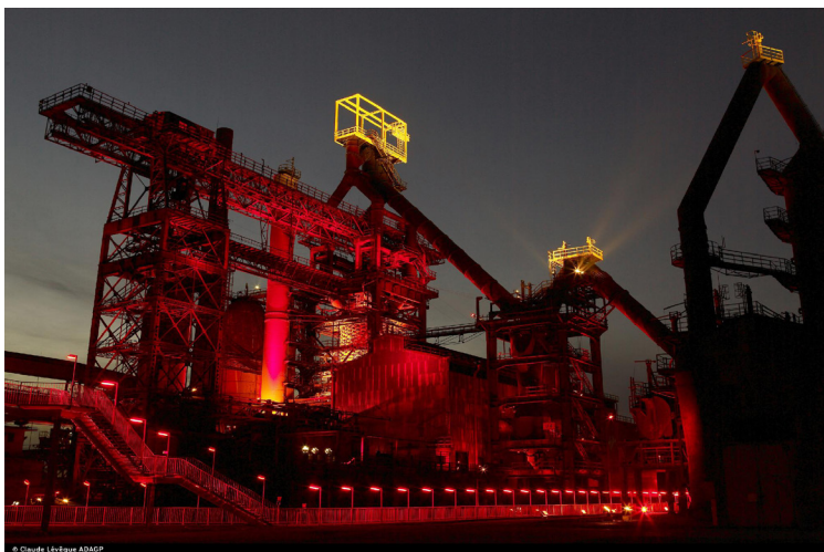
Fig. 6 - «Tous les Soleils» de Claude Lévêque- Auteur : ADAGP Claude Lévêque©

Enfin, Evolu4 intégra les problématiques environnementales de l'ancienne usine. Pour ce faire, un programme de recherches autour de la phytoremédiation fut lancé avec l'aide du Centre de Culture Scientifique, Technique et Industrielle (CCSTI). Cette démarche eut également pour intérêt de sensibiliser les visiteurs aux problématiques environnementales du site via un parcours pédagogique au cœur des parcelles étudiées.