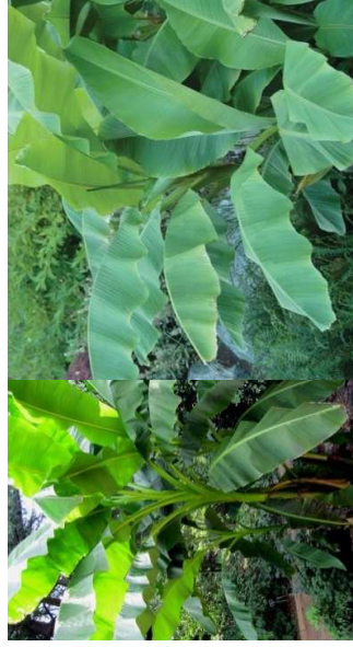
MUSA basjo H=3-4 m/soleil-mi-ombre – Chine