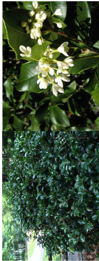
25% OSMANTHUS fragrans H=1,50-2,50 m/05 puis 08/1u/m 2 - feuillage persistant