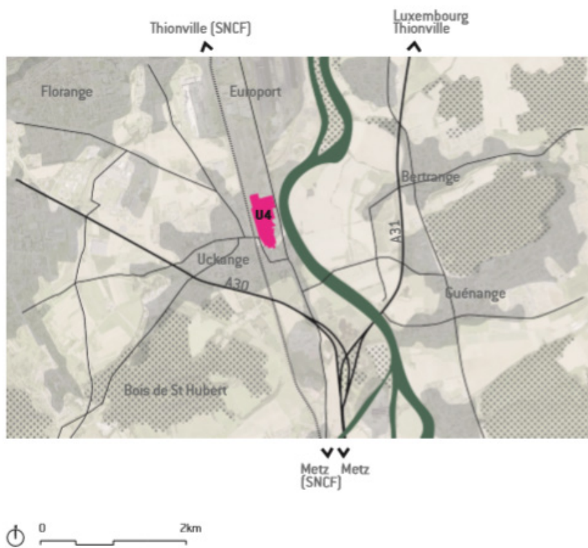
Fig. 5 - Localisation du site du Haut Fourneau U4 au sein du réseau routier et ferroviaire - Auteur : Agence TER© - Source : AGENCE TER, 2015.

En second lieu, l'ancienne usinesituaitstratégiquement à l'entrée nord de la commune d'Uckange. En effet, comme de nombreux sites industriels, le tissu urbain s'était développé