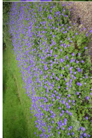
70 %GERANIUM 'Brookside' H=0,60 m/06 à 10/6u/m 2