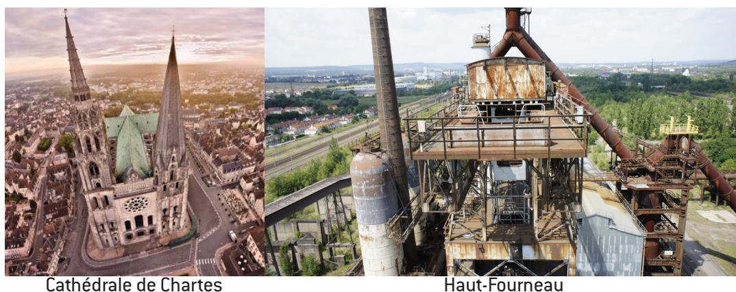
Fig. 8 - Mise en perspective de la monumentalité du Haut Fourneau U4 par comparaison avec la Cathédrale de Chartres - Auteur : Agence TER© - Source : AGENCE TER, 2015.

Par un processus de patrimonialisation du site, d'interprétation du vécu et d'intégration des enjeux environnementaux, l'Agence TER amena le site d'Uckange à se renouveler et à intégrer la dualité d'usage : un usage de proximité ouvert aux locaux dans un souci de mémoire et cicatrisation du passif social ; un usage de découverte d'un site d'exception par des usagers extérieurs.