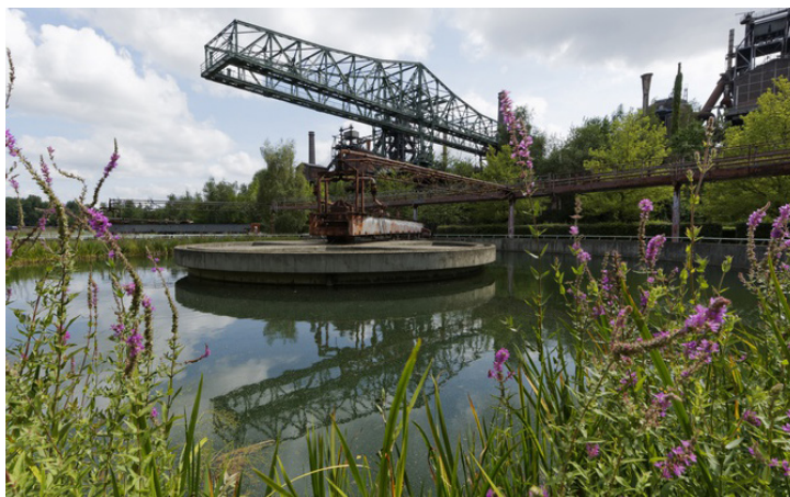
Fig. 3 - Mise en scène des installations sur le canal de l'Old Emscher - Auteur : Latzundpartner© - Source : [6]

Le Waterpark ou Parc des Eaux fut un autre élément emblématique du rapport prégnant que surent créer les architectes entre environnement et esthétisme. [6] Cet ancien canal de l'Old Emscher traversant d'est en ouest le parc devint un espace de biodiversité et de promenade. Les architectes firent le choix de conserver les artefacts du canal industriel via des cuves ou des passerelles. (Fig. 3) Le canal fut néanmoins alimenté par les eaux de pluie du site dans une volonté d'assurer une restauration écologique des milieux adjacents. Des processus semblables aux processus naturels furent mis en place au cœur de ce canal dont l'entretien et la mécanique sont totalement artificiels. Latz décrit son processus de la sorte : « L'homme se sert de cet artefact pour en faire un symbole pour la nature, mais il reste responsable du processus ». [6] C'est une naturalité dominée par l'Homme qui met en lumière le site industriel.