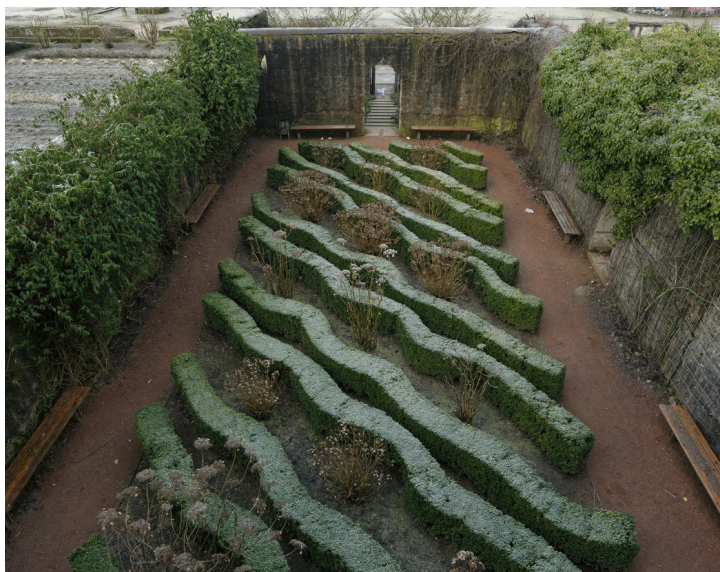
Fig. 4 - Une végétation horticole au sein d'une ancienne zone de stockage de déchets - Auteur : Latzundpartner© - Source : [7]

Le parc des crasses ou Sinter Park prit vie au sein de l'ancienne usine d'agglomération du site industriel. [7] Ce bâtiment fortement pollué fut démolé pour des raisons sanitaires. Néanmoins, les vestiges des fondations de l'usine furent mis en valeur par un parc horticole et paysager. (Fig. 4) Ce terrain anciennement employé pour stocker et traiter des déchets minéraux et du charbon, représenta dès lors un lieu d'apaisement. Il sembla essentiel aux architectes de proposer un tel lieu de contemplation au sein d'un parc au passif si important. Le visiteur fut invité à observer les cicatrices du passif industriel et à prendre du recul sur les aménagements et le processus de mutation des sites. La conservation d'une passerelle, de hauts murs et de déchets rendus inertes permit de conférer au site une atmosphère particulière, employée à nouveau pour des festivités ou simplement pour le repos.