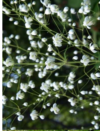
THALICTRUM delavayi 'Album' H= 1,20 m/ 06 à 08/6 u/m 2 / soleil-mi-ombre Chine Nord