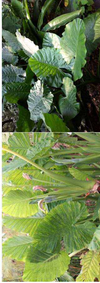
ALOCASIA macrorrhiza H= 2 m à 4,50 m /mi-ombre - ombre / Malaisie, Sri Lanka, Inde