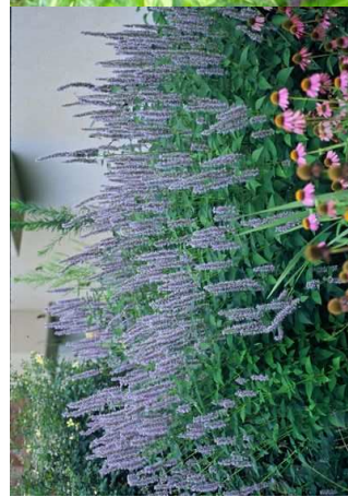
30% AGASTACHE foeniculum H= 1 m/07 à 08/3 u/m 2