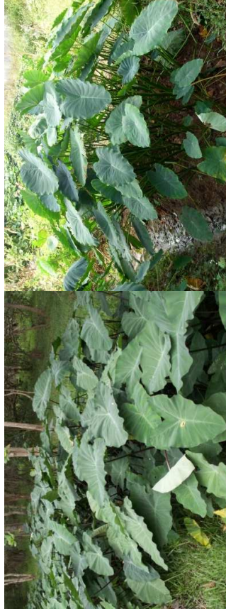
COLOCASIA esculenta H= 0,80 m/soleil – mi-ombre – Asie