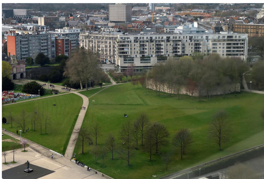
Fig. 9 - Îlot de biodiversité inaccessible au sein du Parc Matisse à Lille - Auteur : Florent Marceau © - Source : [10]

Néanmoins, d'un point de vue pratique et gestionnaire, en ville, on peut se demander comment faire accepter le « délaissement » d'espaces, notamment au regard de la pression foncière mais également au regard d'une esthétique du lieu. Sur des espaces publics jardinés et aménagés, Gilles Clément a rendu possible ce « délaissement » par l'impossibilité d'accéder à certains endroits des sites. Par exemple, sur le projet du parc Matisse à Lille, le paysagiste a rendu à la ville un espace de nature inatteignable, nommé île Derborence (Fig. 9). Localisé sur un promontoire aux parois verticales infranchissables de 7m de hauteur, Clément offre un espace libre de gestion ayant le potentiel et la possibilité de trouver son propre équilibre et sa propre dynamique au sein même d'un espace entretenu. (COLLEU-DUMOND, 2019). Il prouve ainsi que l'on peut trouver des lieux de biodiversité au centre de parcs urbains. Il amène également la preuve que les usages peuvent cohabiter au sein d'espaces mixtes. Un lieu de vie animé et fréquenté par de nombreux usagers côtoie un milieu de vie où l'Homme n'est pas accepté. Les dualités peuvent co-exister