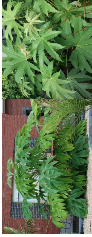
TETRAPANAX papyrifera 'Rex' H= 2-3 m – 6 m/09 à 11/soleil-mi-ombre/feuillage persistant – Asie S/Est