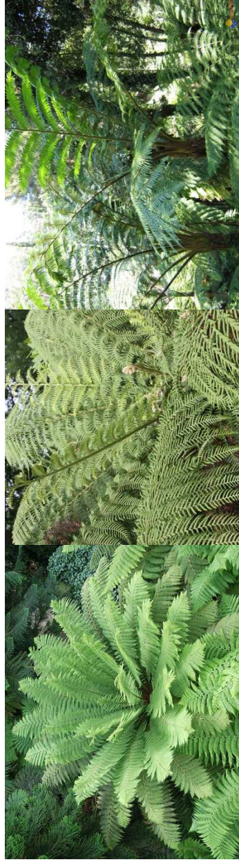
DICKSONIA antarctica H= 2-3 m / mi-ombre-ombre / feuillage persistant - Australie