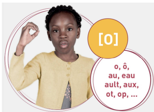
Figure 3 : Représentation du geste associé au phonème [o]