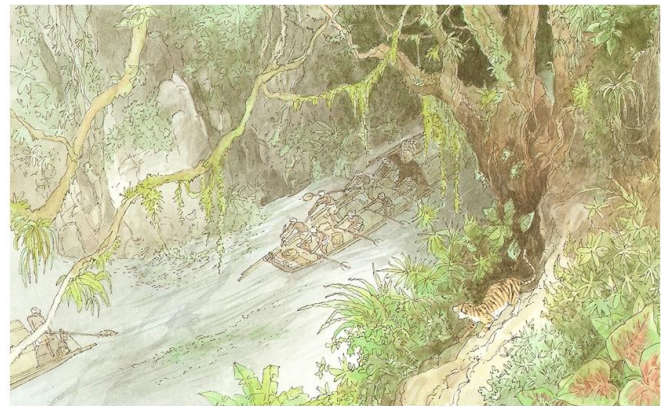
Les Derniers Géants , François Place. 1992 : pages 16-17.

En amont de ce passage, les falaises disparaissaient sous une végétation luxuriante. La jungle nous submergea de ses miasmes fétides, saturés d'odeurs lourdes d'humus et de moisi. Parfois, un tigre rôdait sur la berge, nous adressant au passage un feulement réprobateur, puis s'évanouissait dans l'épaisseur des taillis.