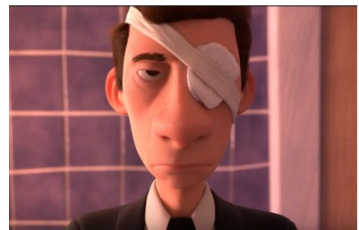
Fig. 3, La cour , 2016 [00:02:42]

L'action principale se déroule hors-champ; nous ne voyons ni le mouvement du bouchon en direction du visage de l'homme, ni le moment où il est blessé. Cependant, nous comprenons implicitement ce qu'il s'est déroulé. La question posée était la suivante : «A ton avis, que se passe-t-il dans la scène avec la bouteille de champagne?»