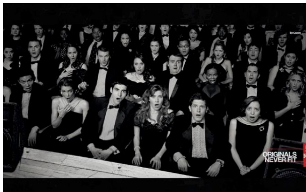
Fig. 8, Photographie publicitaire «Levis», Audience , Bartle Bogle Hergarty, 2007