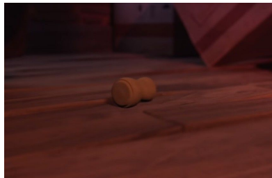
Fig. 2, La cour , 2016 [00:02:38]