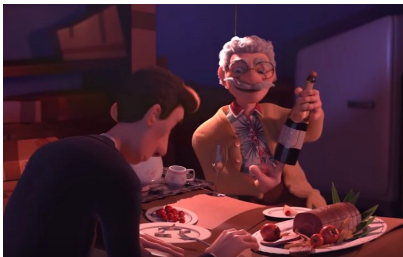
Fig. 1, La cour , 2016 [00:02:36]

La première inférence à faire concernait un implicite logique, dont l'inférence se fait quasiment inconsciemment à l'aide du montage. On retrouve le principe d'inférence de cause/effet, développé par Giasson en littérature. Il s'agit ici d'inférer l'action de l'ouverture d'une bouteille de champagne, le saut du bouchon, et le résultat de l'homme blessé à l'oeil.