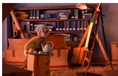
Fig. 4, La cour , 2016 [00:06:11]

Enfin, la troisième manière de venir interroger l'implicite à l'aide du hors-champ s'est inscrit dans une posture plus imaginative. Elle vient s'appuyer sur la chute du court-métrage, où nous assistons à la disparition des personnages à l'intérieur d'un canevas vierge de peinture. Il s'agit alors d'interprétation libre, car l'action fantastique permet de se détacher de la nécessité précédente de proposer un argument plausible.