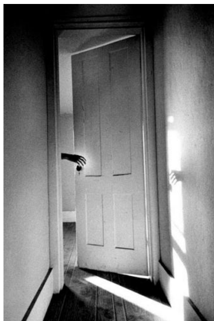
Fig. 7. Ralph Gibson, The somnambulist , 1970

Cette photographie a été très évocatrice auprès des élèves. Nous avons d'abord prélevé les indices liés au lieu ( une porte, un couloir, une pièce que nous devinons indiquent que nous sommes dans une maison. )