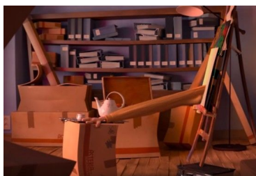
Fig.5, La cour , 2016[00:06:16]