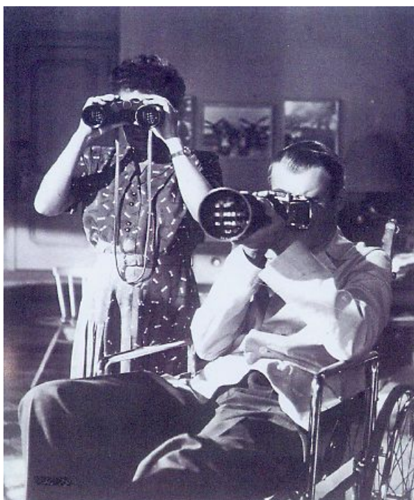
Fig. 9, photogramme de Fenêtre sur Cour , Alfred Hitchcock, 1962

Pour faire émerger le terme de jumelles, les élèves ont de nouveau étayé les réponses des autres. La majorité des élèves approuve l'idée de l'espionnage, sauf deux élèves qui proposent deux alternatives. La première proposition est plutôt imaginative, parlant de la mer en hors-champ (réplique 18). La seconde est plus pragmatique, liée à la présence d'un appareil photo, associé au métier de caméraman.