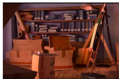
Fig. 6, La cour , 2016 [00:06:19]

Cette posture est celle qui a été la plus difficile d'accès aux élèves : comme énoncé, le travail sur le hors-champ s'appuie sur ce que nous avons précédemment construit comme ressort imaginaire chez