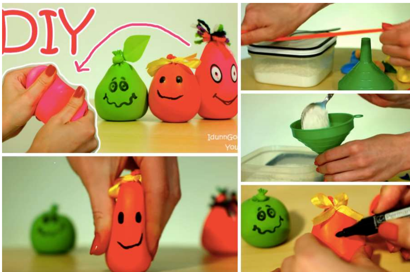
Image issue du site desidees.net présentant la démarche de conception des balles antistress de la classe (balle effectuée par les élèves en arts plastiques, pour les élèves > dans une boîte au fond de la classe)

Les cartes yoga sont issues d'un travail sur le support « Petit Yogi » travaillé en classe. Un tapis de yoga se trouve derrière le bureau avec l'ensemble du matériel du coin retour au calme.