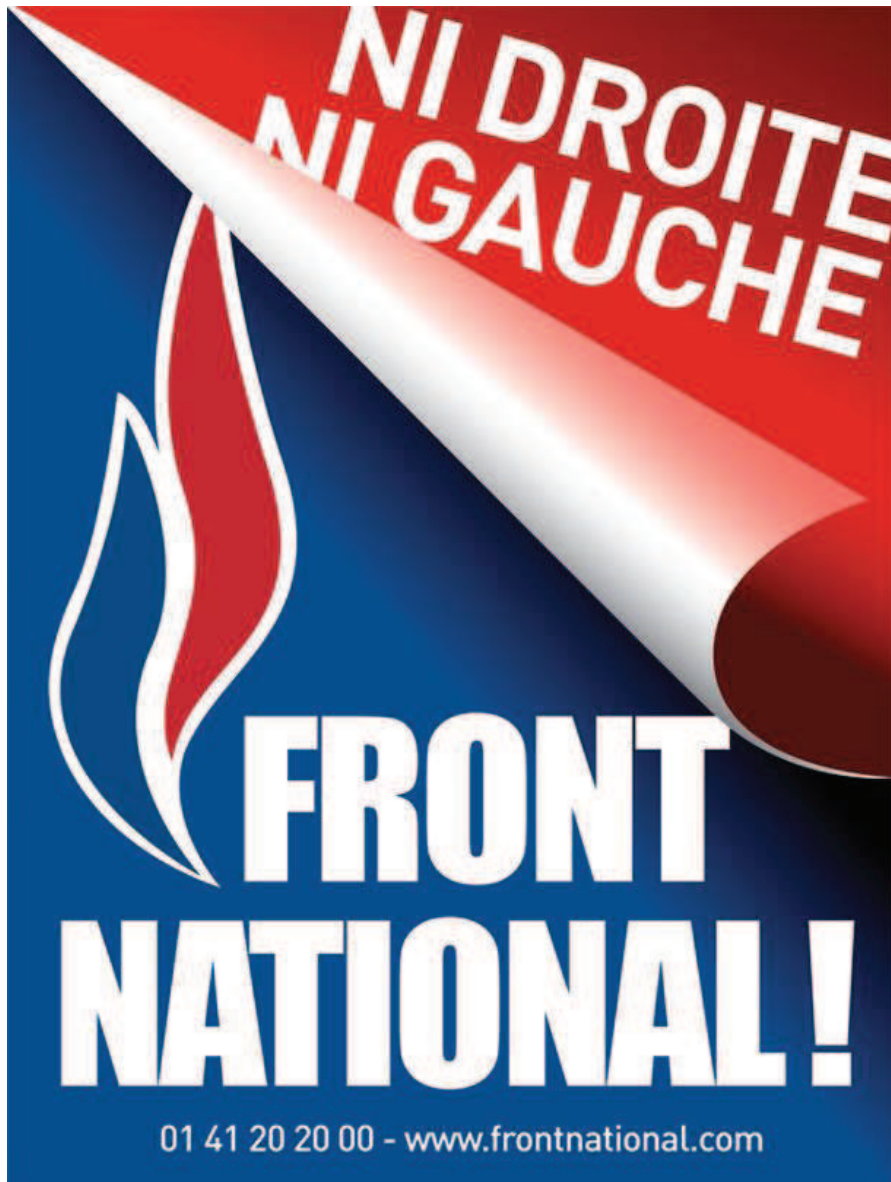
Annexe 1 : Tract du Front National illustrant son positionnement « ni droite ni gauche » (2013)