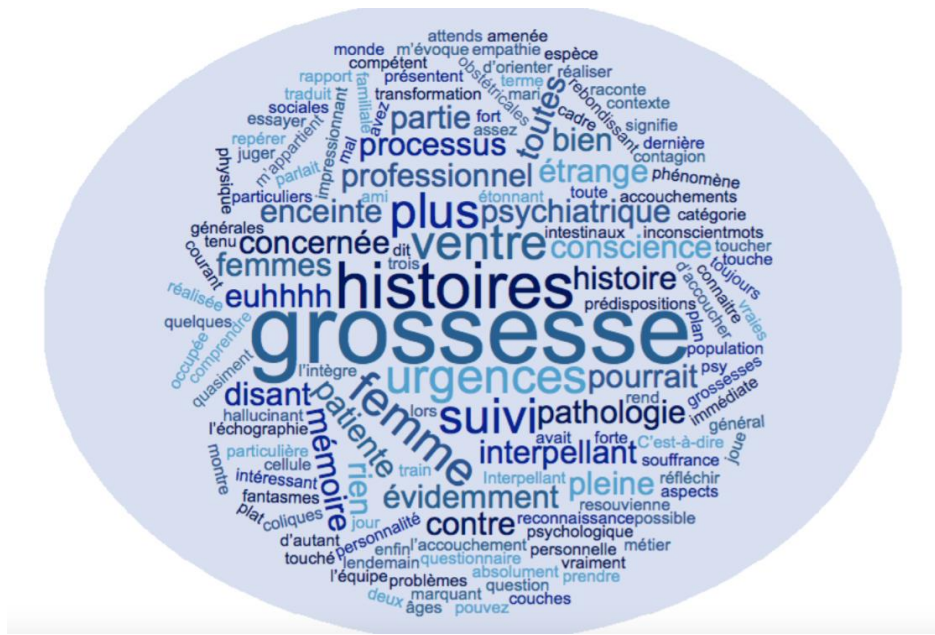
Figure 3 : Nuage de mots de l'entretien n°8