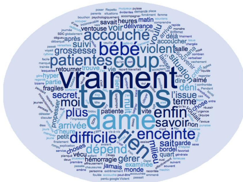
Figure 2 : Nuage de mots de l'entretien n°1

Nous avons donc utilisé un logiciel sur un site internet dédié à la création de nuages de mots (nuagesdemots.fr). Voici quelques exemples de nuages de mots réalisés à partir de chaque entretien et obtenus via ce procédé. Nous pouvons notamment lire, dans le nuage de mots de l'entretien n°1, cette fameuse notion de temps ou l'emploi du superlatif avec l'adverbe « vraiment ». Dans le nuage de mots de l'entretien n°8, nous remarquons en premier lieu les notions de psychiatrie, de pathologie, ou les mots tels que « interpellant ». Enfin, dans le nuage de mots de l'entretien n°10, nous retrouvons vraiment cette idée de superlatif avec les mots mis en avant tels que « hyper » ou « plus ».