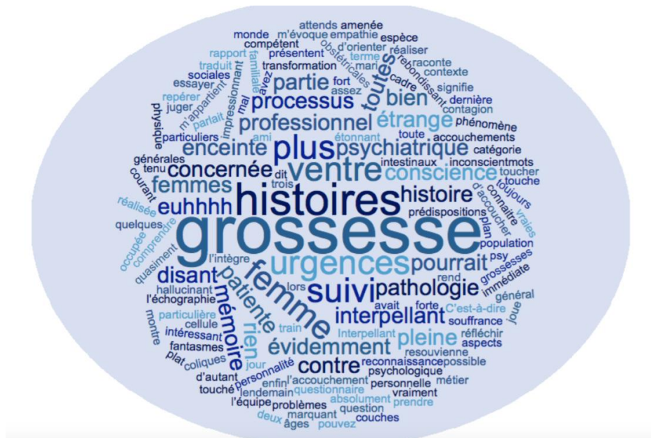
Figure 3 : Nuage de mots de l'entretien n°8