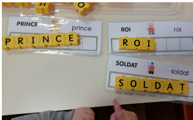
Fig 4 – Photo de l'atelier des semaines 3 et 4 de la P3

L'atelier pour les semaines 3 et 4 de la P3 était le suivant :