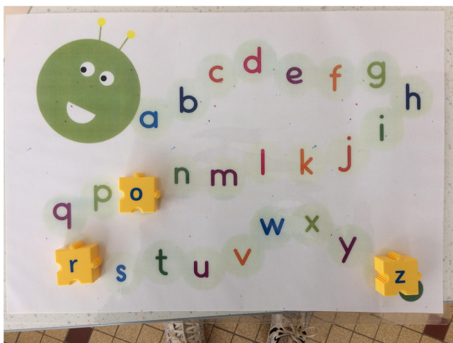
Fig 5 – Photo de l'atelier des semaines 3 et 4 de la P3

L'atelier pour les semaines 3 et 4 de la P4 était le suivant :