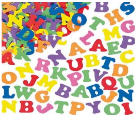
Fig 6 - Affichage mis sur les fiches d'inscription pour l'espace lettres/graphisme en P3