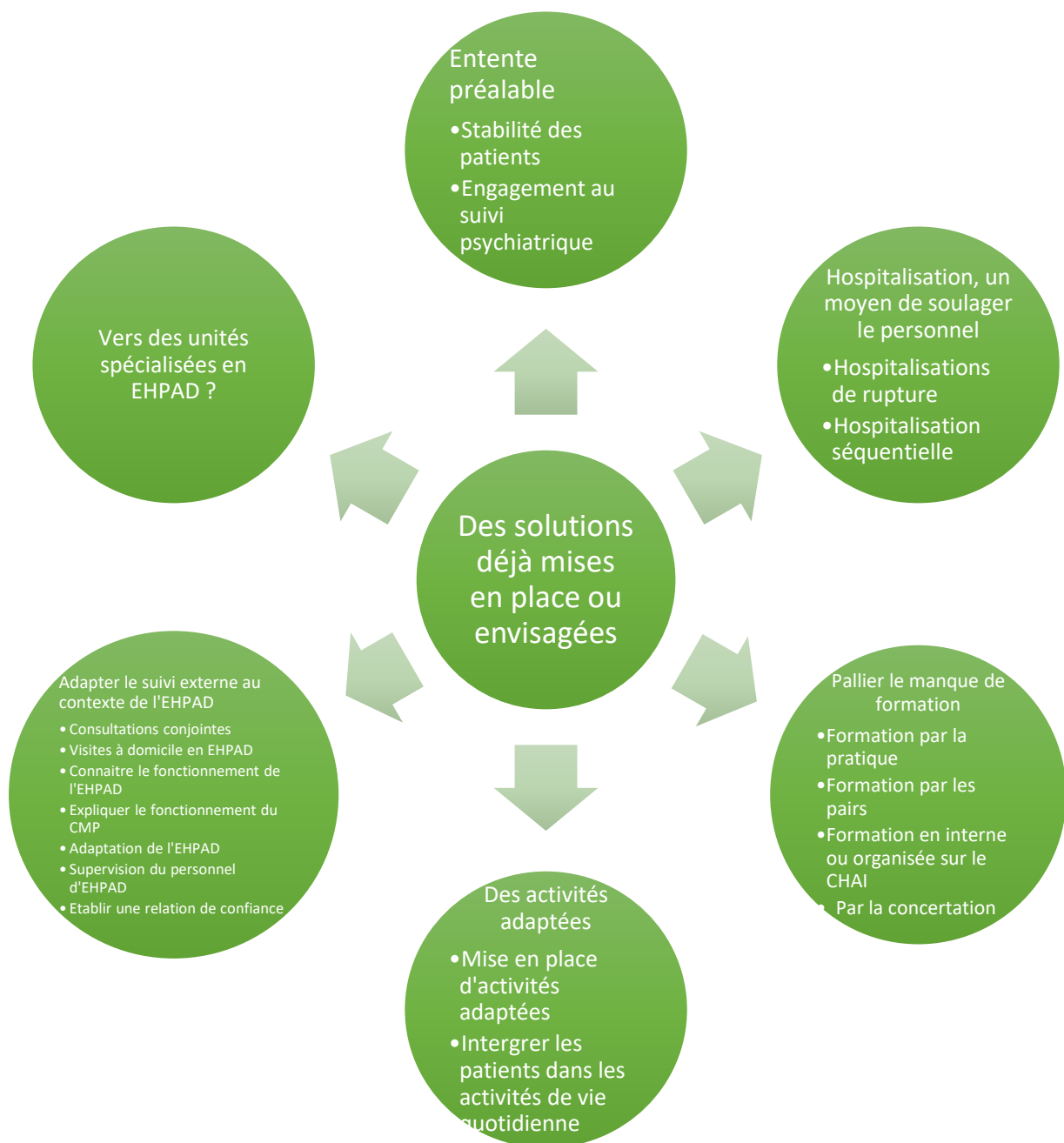
Schéma récapitulant les solutions mises en place ou envisagées au sein des EHPAD