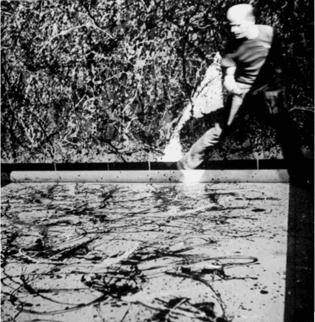
Figure 1 : Hans Namuth, Jackson Pollock , 1950, Atelier, The Springs, East Hampton, Long Island.