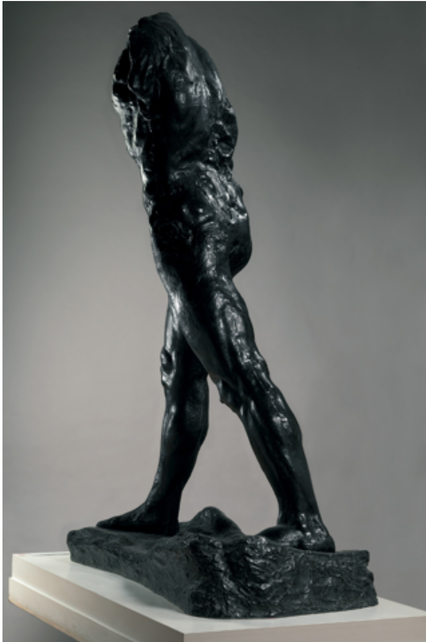
Figure 7 : Auguste Rodin, L'Homme qui marche , 1907 bronze, 213,5 x 71,7 x 156,5 cm.

La question de la sculpture serait alors comment la finir : finir un volume, quelle ligne définie sépare l'espace, délimite les extrémités. A quel moment on sépare ou confond volume et espace ? Le scandale du moulage de Rodin touchait à ces questions.