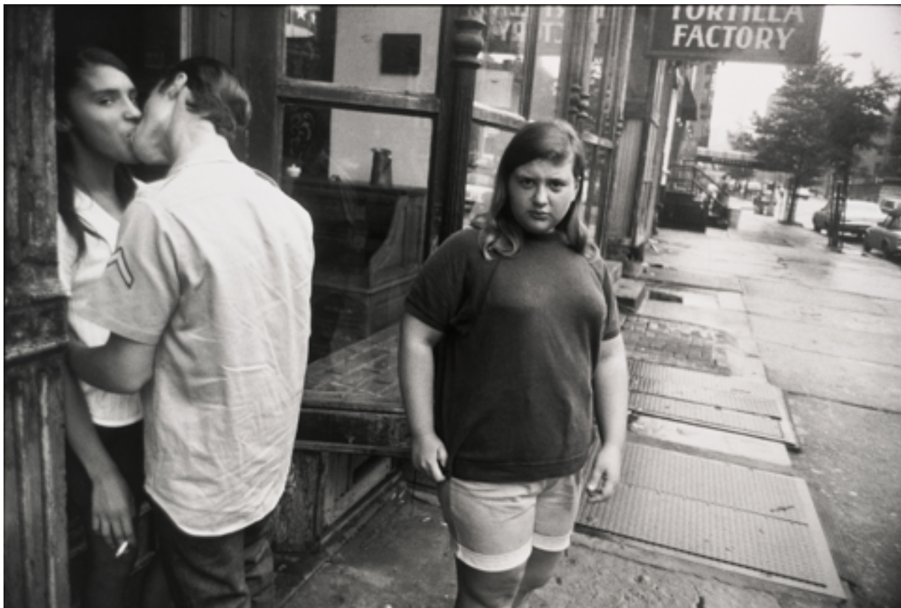
Figure 12 : Garry Winogrand, Couple kissing, girl staring at camera, tortilla factory , 1969 Épreuve gélatino-argentique, 27,94 cm x 35,56 cm, New York Collection SF MOMA, Don de Carla Emil et Rich Silverstein ; © Propriété de Garry Winogrand

Winogrand est un cas unique dans les exercices parallèles du regard : toute sa vie ou presque il aura été à la même distance du sujet ; cette “distance” n’étant pas mesurable uniquement par le mètre de l’arpenteur ou les enjambées du futur locataire d’un espace habitable, non que ce soit d’ailleurs une distance si différente de celle des autres regardeurs qu’elle finisse par caractériser une sorte de label “Winogrand”. 64