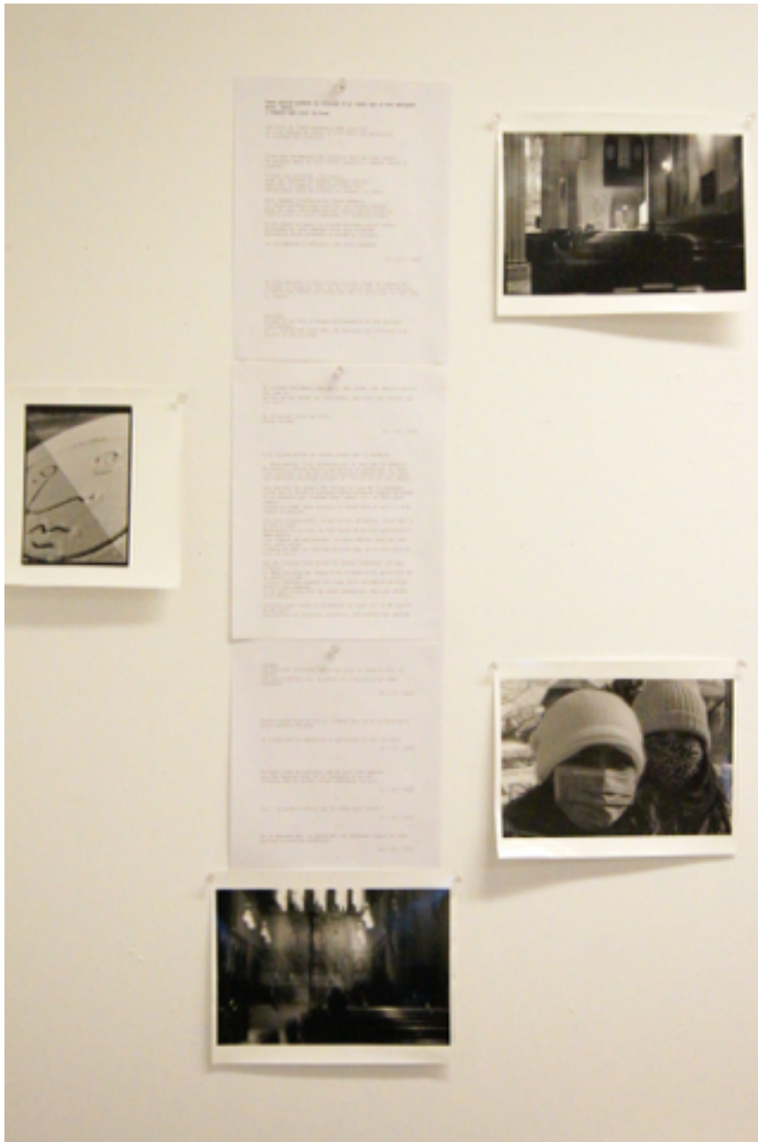
Figure 17 : Travail personnel, vue d'un ensemble texte - photographies, 2015.