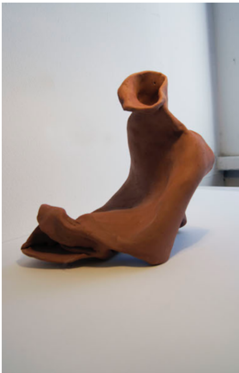
Figure 9 : Exemples d'un recherche de la forme, travail personnel, argile crue.