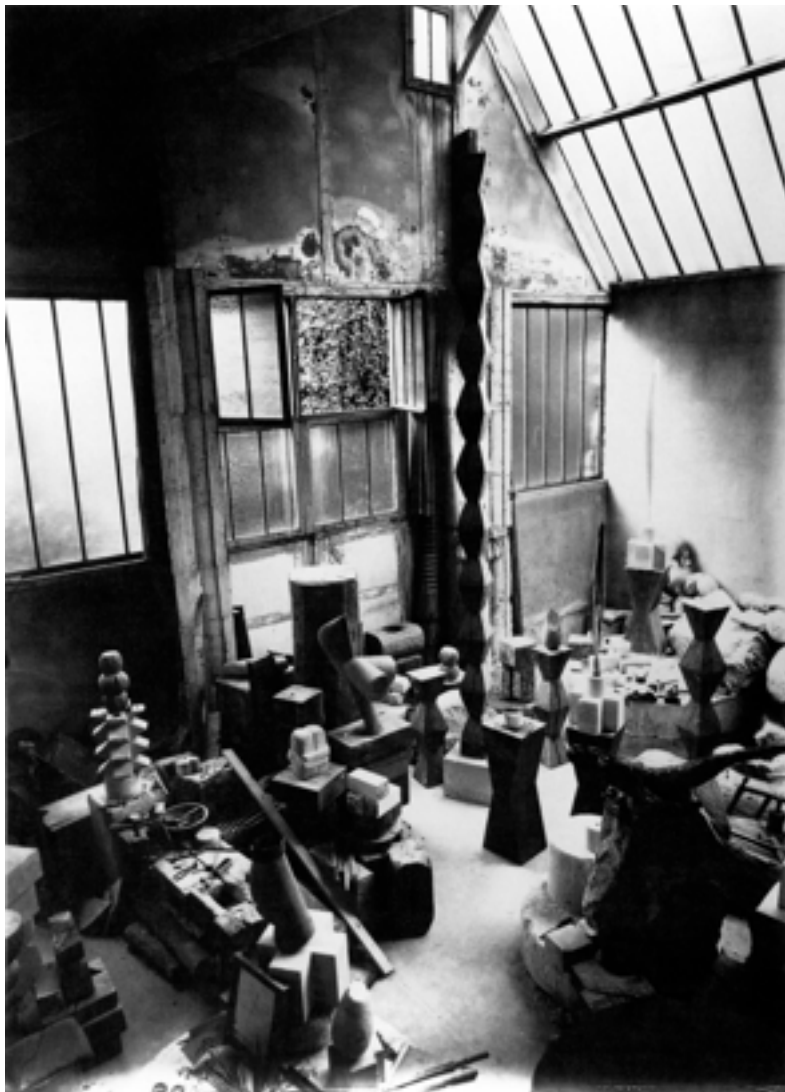
Figure 18 : Vue de l'atelier de Constantin Brancusi.

Aussi le montage de l'atelier de Brancusi est le moyen de parfaire son oeuvre, il est son accomplissement. L'intensité continue qui nous préoccupait avec Paul Valéry se retrouve dans la constellation des oeuvres entre elles, de l' ergon avec le parergon , d'une oeuvre continuellement inachevée, ouverte sur le dialogue, et qui par là constitue son unité. À l'image de la tradition orale des peuples nomades, le savoir dont le récit immatériel le récit se perpétue et se renouvelle au fil des générations. Il ne s'établit jamais réellement, il est en construction permanente dans ce mouvement d'inachevé, ouvrant par là une brèche sur l'erreur, la connaissance fragmentaire et le provisoire (d'un auteur à l'autre des éléments du récit se perdent), et l'interférence (cette perte est l'occasion d'une création continue).