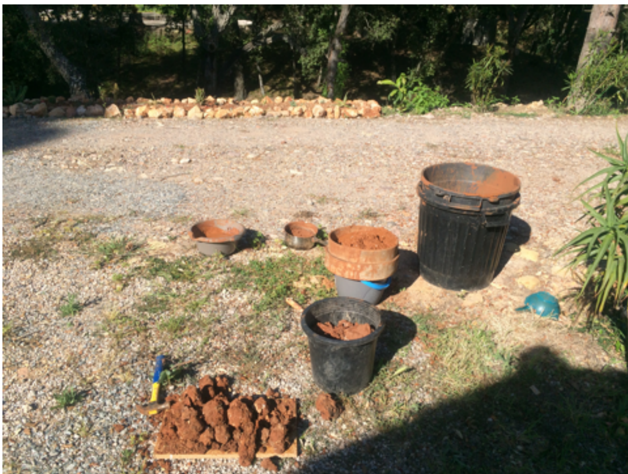
Figure 4 : Travail personnel de récolte de la terre, 2016, Roquebrune-sur-Argens, Var, France.

distinction des territoires, relevant de traditions à la fois européennes, américaines, africaines et asiatiques. 13 », rejoignant l'idée d'un matériau paradigmatique de l'errance.