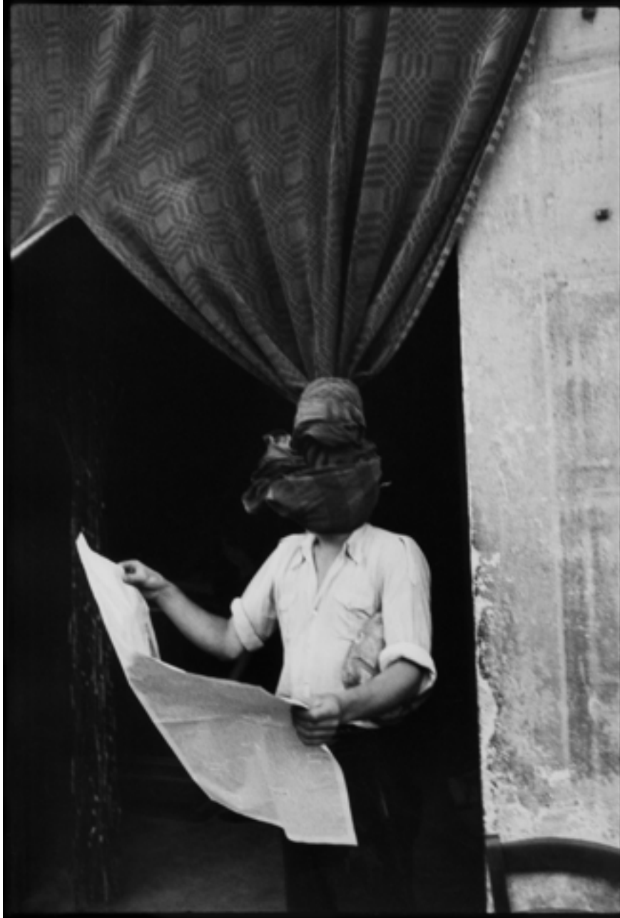
Figure 5 : Henri Cartier-Bresson, Livourne , 1933, Épreuve gélatino-argentique, tirage réalisé dans les années 1980 36 x 24,3 cm, Toscane, Italie.