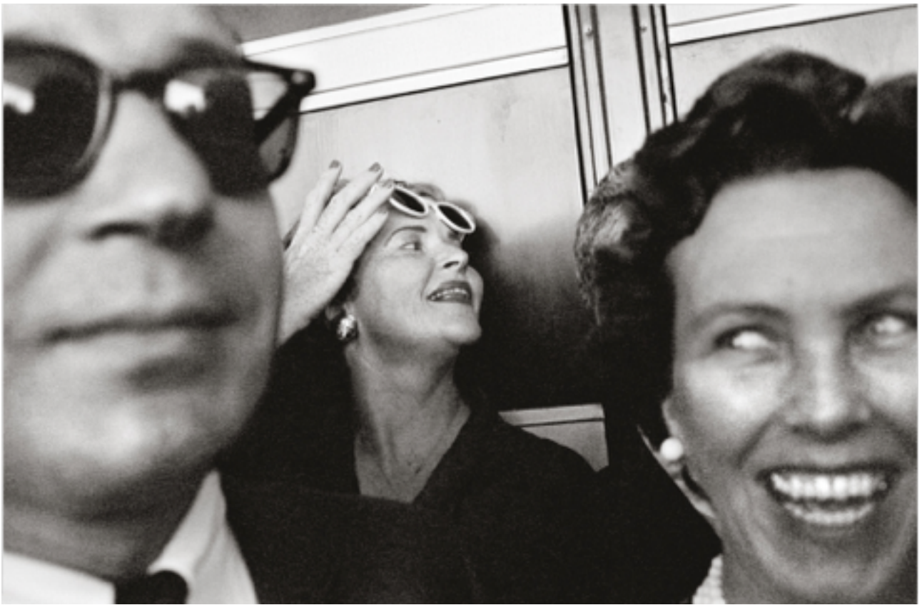
Figure 6 : Garry Winogrand, Metropolitan Opera , épreuve gélatino-argentique, 1951, New York.