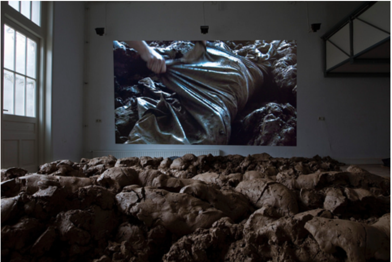
Figure 8 : Alexandra Engelfriet, Dust to Dust , 2011