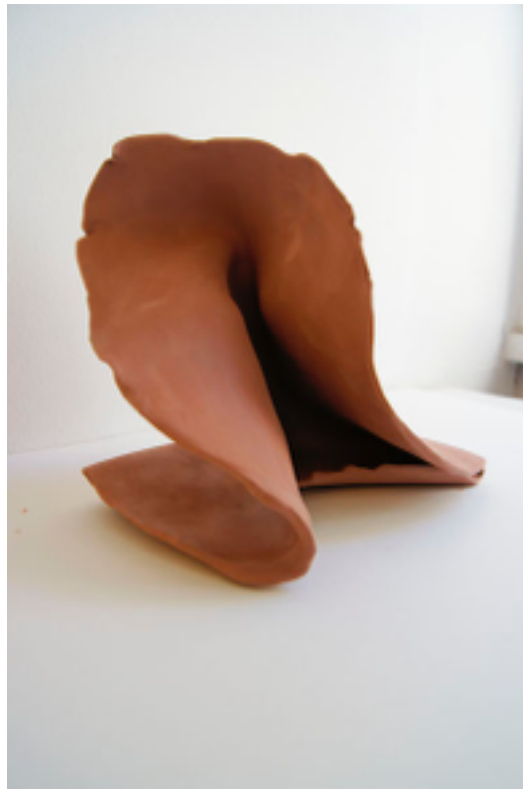
Figure 10 : Travail personnel d'une recherche de la forme, 2015.