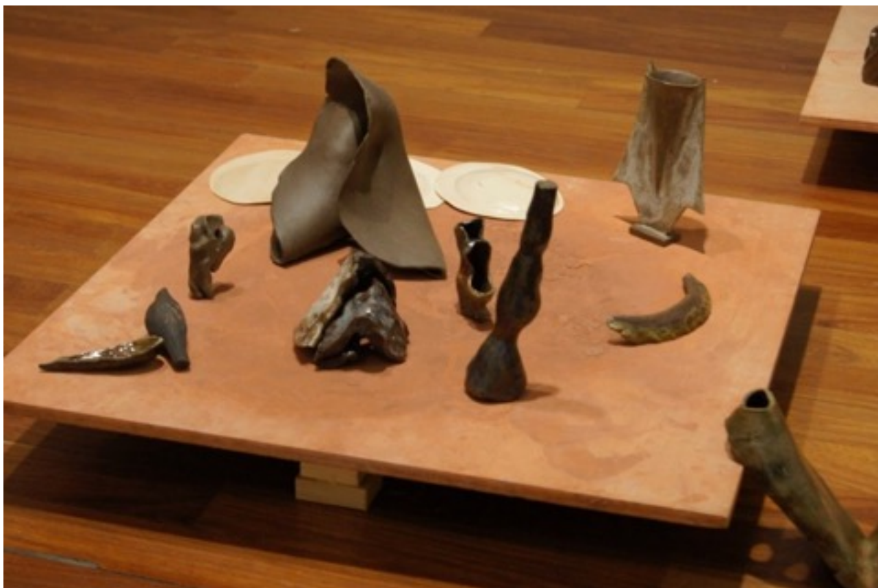
Figure 14 : Travail personnel, What remains , céramique, bois, argile, dimensions variables, New York, 2015.

Il s'agit d'aller à la rencontre d'une intensité continue dans l'exposition au moyen du fragment, et par là d'étendre cette mise en relation de l' ergon au parergon à l'ensemble des oeuvres entre elles.