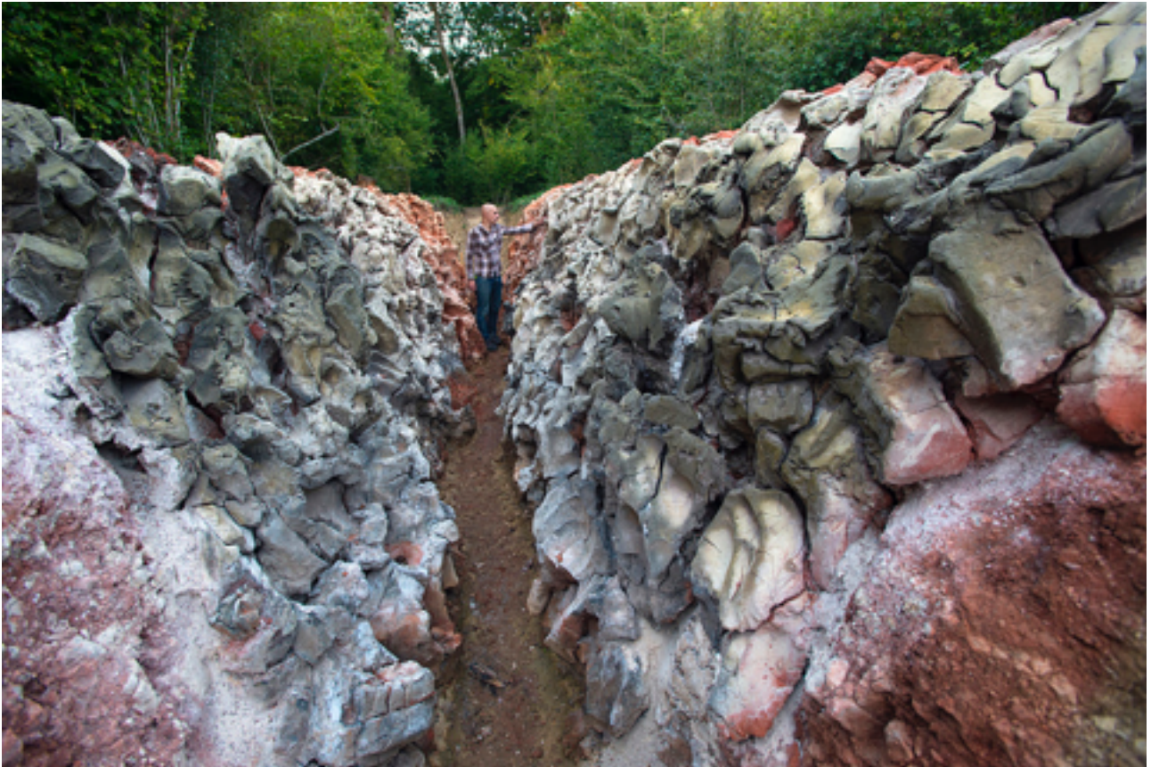
Figure 3 : Alexandra Engelfriet, Tranchée , 2013, argile cuite au feu de bois, 10 x 2.30 m, Le Vent des Forêts, La Meuse, Lorraine, France.