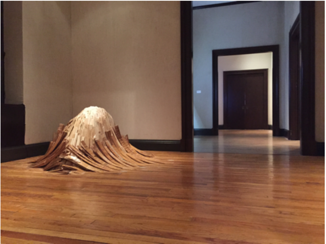
Figure 2 : Serra Victoria Bothwell Fels, Untitled (flooring) , 2015, lattes de plancher, plâtre, 68, 58 x 391 x 388, 62 cm.