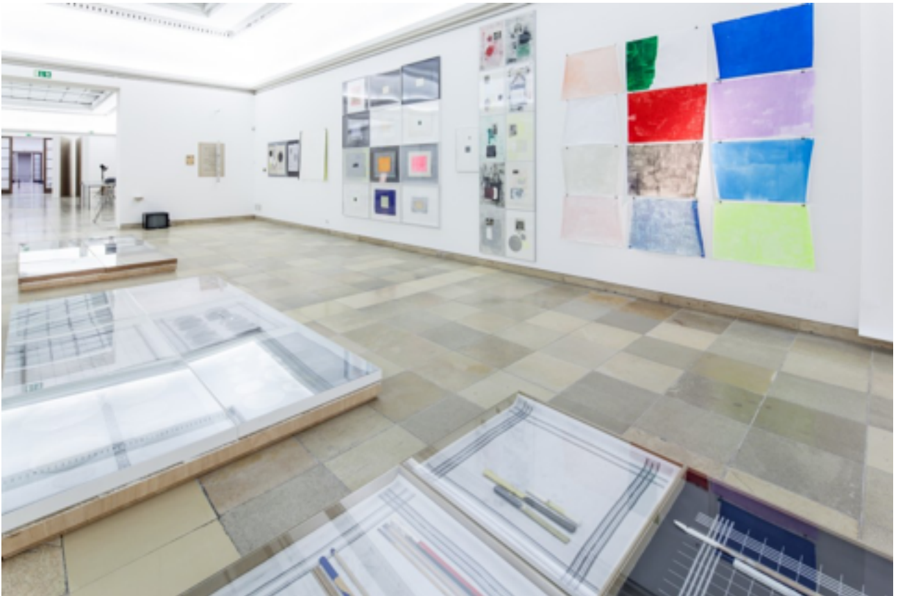
Figure 16 : Joëlle Tuerlinckx, vue de l'exposition « WOR(LD)K IN PROGRESS » au WIELS Centre d'Art Contemporain à Bruxelles, décembre 2013 - mars 2014.