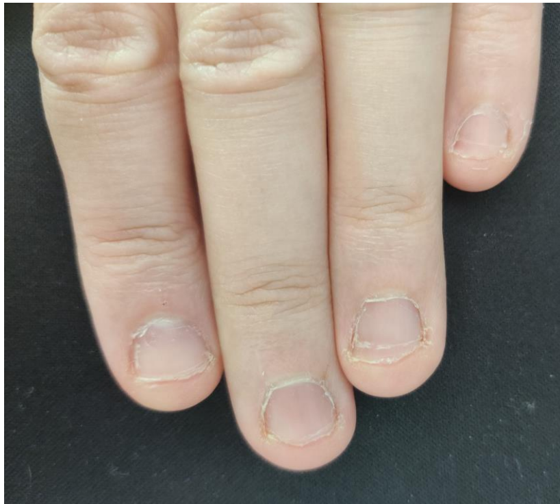
Figure 12 : Main d'un patient onychophage

Chez les patients onychophages, les premières séquelles évidentes se retrouvent au niveau des mains. Tous les ongles sont généralement abîmés de façon égale, ils présentent un aspect anormalement court et des bords irréguliers. Les cuticules présentent aussi un aspect déchiré. Des hémorragies sont parfois observées lors d'épisodes intenses, correspondant souvent à des périodes de stress. On observe une augmentation dans la vitesse de croissance des ongles, entraînant une réparation plus rapide des dommages, et entretenant la parafonction. Cette croissance accélérée serait due à une stimulation de la matrice de l'ongle lors de la parafonction 62 .