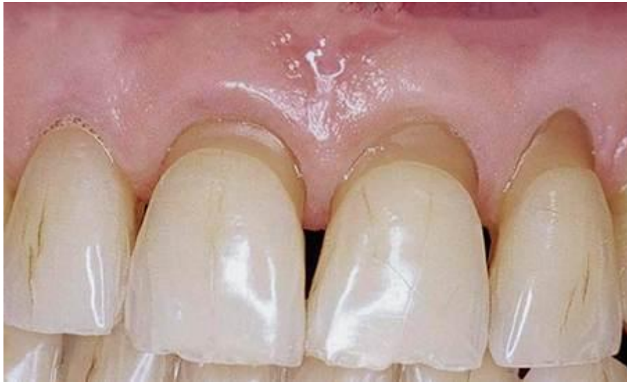
Figure 7 : Lésions vestibulaires lisses et concaves touchant préférentiellement la dentine cervicale, caractéristiques d'un brossage horizontal traumatique

Source : Kaleka, « Comprendre l'usure des dents : la clef du diagnostic », 2012