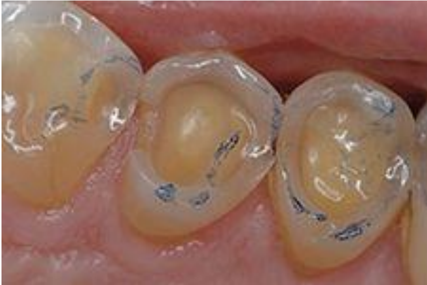
Figure 8 : lésions érosives en cuvettes, touchant préférentiellement la dentine