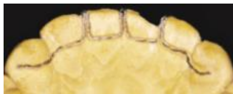
Figure 13 : Dispositif réalisé sur modèle avant la pose

Source : Marouane et al, « New approach to managing onychophagia », 2016.