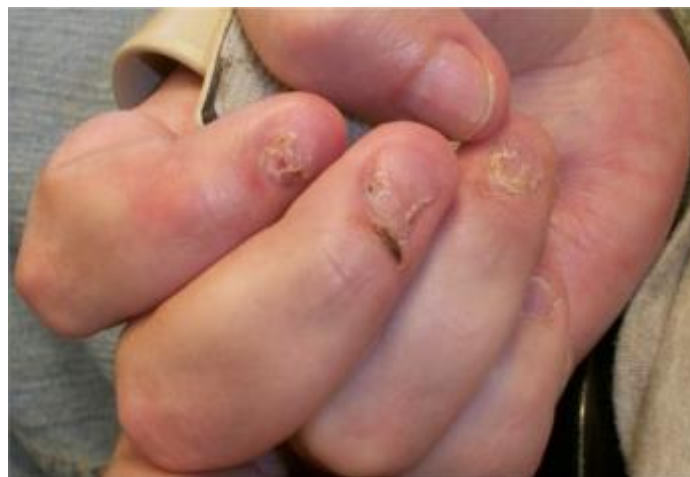
Figure 2 : Destruction visible des ongles chez un patient onychophage

Source : Nino, et Singarredy, « Severe onychophagia and finger mutilation associated with obstructive sleep apnea », 2013.