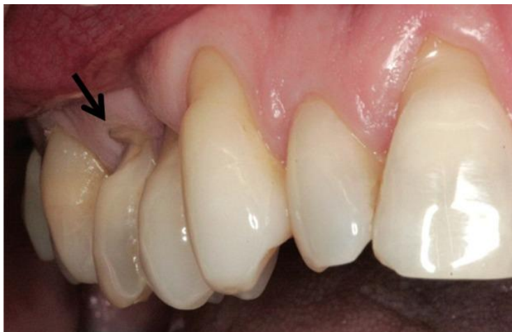
Figure 9 : Lésion supposée d'abfraction, en forme de coin présentant un angle interne aigu

Source : Marus, « Esthetic and predictable treatment of abfraction lesions », 2011