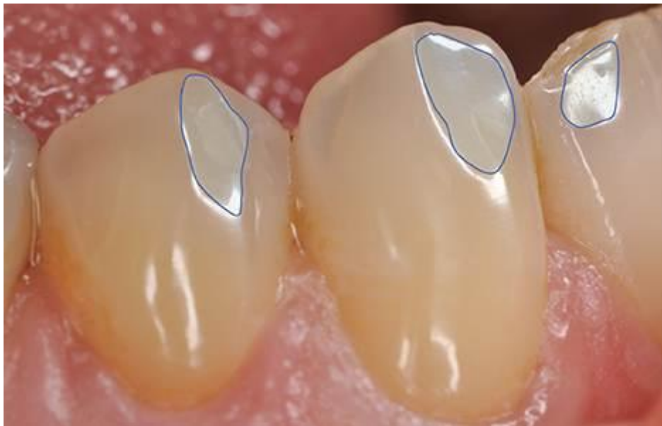
Figure 6 : Lésions d'attrition, d'aspect lisses et polies en rapport avec une supraclusion

Source : Kaleka, « Comprendre l'usure des dents : la clef du diagnostic », 2012