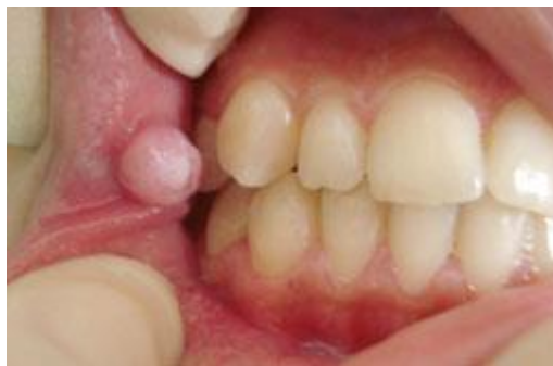
Figure 3 : Diapneusie liée à un tic de succion de la joue

Source : Bouzoubaa, Mdaghri, et Benyahia, « La diapneusie : du diagnostic au traitement », 2010.