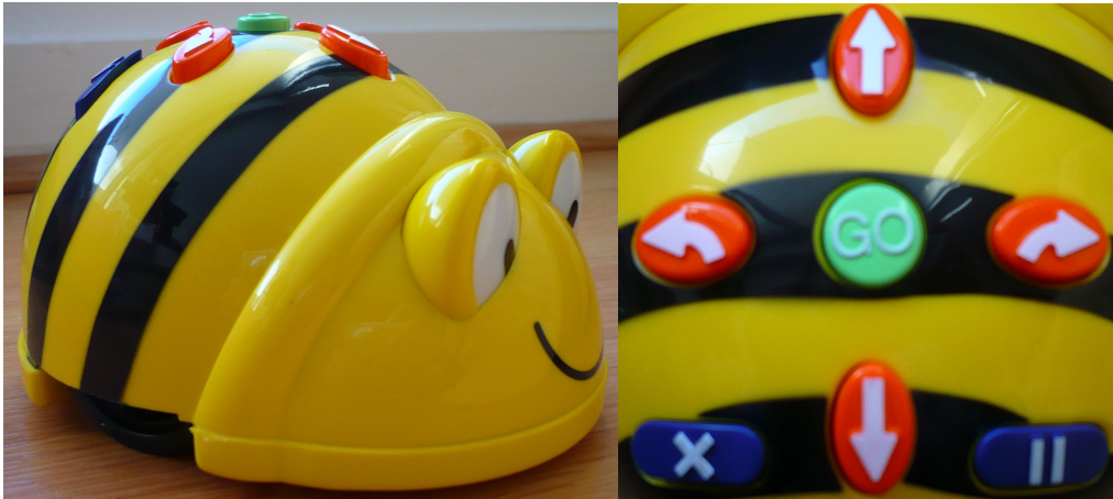
Figure 1 : Le jouet programmable Bee-Bot et son interface de commandes

est utilisable par des élèves de Cycle 1 et a fait l'objet de diverses exploitations pédagogiques dans des classes de maternelle.