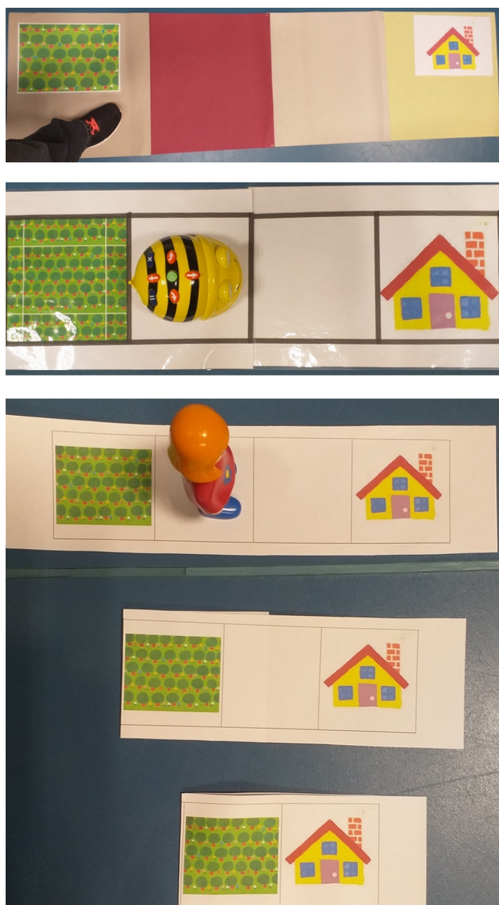
Figure 3 : Tapis vierges "élèves", tapis "Bee-Bot®" et tapis "Boucle d'Or" en configuration ligne de 4 cases

Ces tapis ont été construits pour deux configurations : un quadrillage de 3*3 cases et une ligne de 4 cases. Sur chacun des tapis, les cases "départ" et "arrivée" sont figurées, respectivement par la représentation de la forêt de l'album Les trois ours et par la maison des trois ours. Par ailleurs, deux versions de chacun des tapis ont été fabriquées : une "vierge" où toutes les cases sont blanches sauf les cases "départ" et "arrivée" et une sur laquelle figurent des images (tirées également de l'album) dans chacune des cases. La seconde version permet dans un premier temps de faciliter la communication, la verbalisation des déplacements des différents objets sur les quadrillages.