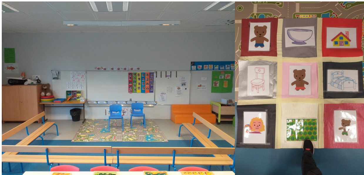
Figure 2 : Espace "Regroupement" de la classe de PS n°2 et aménagement de cet espace avec le tapis 3*3 destiné au déplacement des élèves

pour permettre la manipulation des Bee-Bots®. Cela permet également de s'affranchir des perturbations liées à une modification de l'environnement extérieur aux méso-espaces ou aux micro-espaces proposés aux élèves au cours des différentes situations pédagogiques. De plus, les tapis ont toujours été orientés de la même manière pour faciliter le transfert des informations collectées sur les tapis destinés aux déplacements des élèves vers les tapis destinés aux déplacements des Bee-Bots® ou de la figurine de Boucle d'Or.