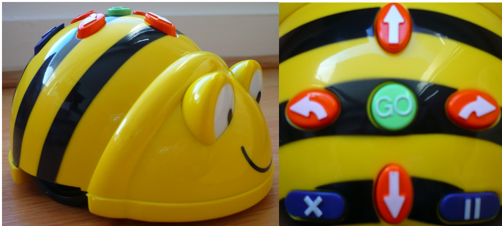
Figure 1 : Le jouet programmable Bee-Bot et son interface de commandes

est utilisable par des élèves de Cycle 1 et a fait l'objet de diverses exploitations pédagogiques dans des classes de maternelle.