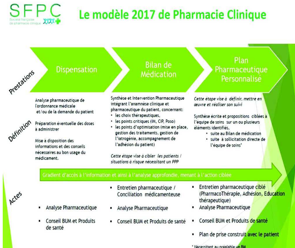
Figure 1 Modèle de Pharmacie clinique selon la SFPC d'après (SFPC 2019)