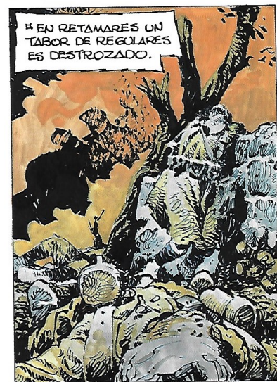
Figure 8. Aspect 'goyesque' des cases