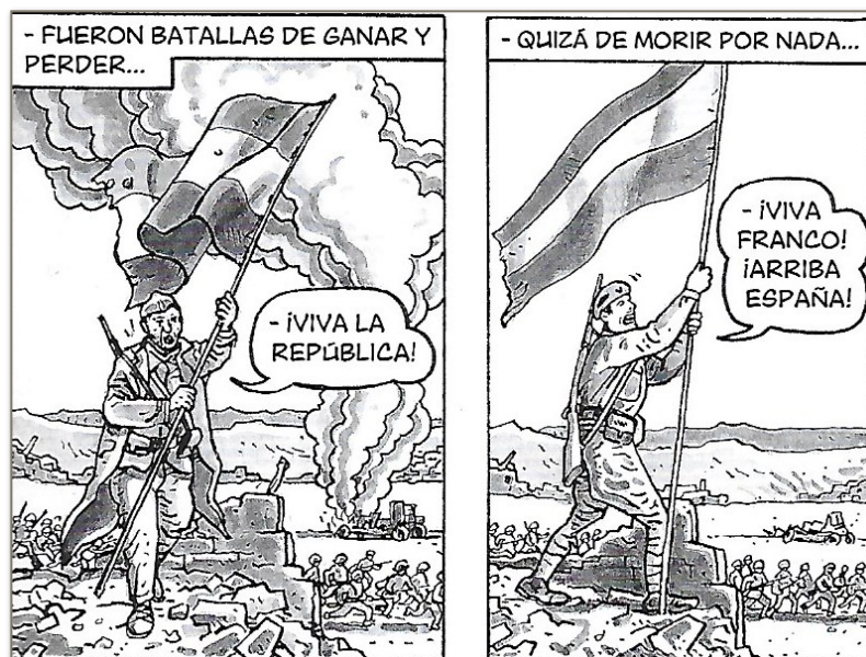
Figure 5. La Guerre Civile présentée comme fratricide

El arte de volar nous propose une interprétation du conflit où les personnages qui entourent Antonio sont tous espagnols, que cela soit l'anarchiste, le civil ou bien le franquiste. Ainsi, les étrangers ne semblent pas avoir de présence au cours du conflit. Il y a bien la présence d'une autre nationalité, incarnée par le communiste, qui se mêle au conflit et apporte d'une certaine façon la défaite. Cependant l'ingérence russe, aussi négative soit-elle, sera rapidement reléguée au second plan. La Guerre Civile nous est montrée comme une guerre fratricide menée par des espagnols, où ces derniers souffrent et meurent face à d'autres espagnols. Cette sensation domine tout du long du récit, comme avec les deux cases où un républicain plante un drapeau qu'un franquiste retire immédiatement. Les deux hommes ont presque la même posture, ils ont le même drapeau en main et ils crient un '¡viva!' pendant qu'ils accomplissent leur geste. Cette mise en parallèle les désigne comme des espagnols, que seule la différence de camp oppose au cours de cette lutte.