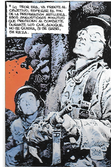
Figure 7. L’angoisse sur les visages