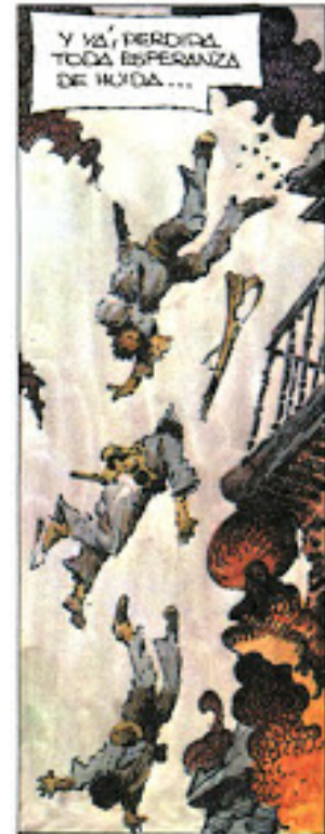
Figure 10. Le suicide des soldats républicains.

puissent avoir lieu en si peu de temps. Même si parfois elle se teinte de gloire ou d'héroïsme grâce au courage des soldats, les assauts sont présentés comme un gâchis d'hommes et de ressources. Elle est éprouvante tant sur le plan psychologique que physique, les combats se déroulent jour et nuit, transformant les lieux de confrontation en charnier où tous s'entretuent indifféremment : l'anarchistes, le républicain, le franquiste ou le marocain ou lorsque des soldats républicains se jettent du toit car ils n'ont aucune échappatoire. Les soldats prennent la fuite lorsque les choses tournent mal ou qu'ils se sentent sacrifiés. 91 Palacios présente de manière négative la façon dont la guerre fut menée. Les officiers qui accusent d'incompétence leurs subordonnés, comme quand Enrique Líster est le coupable des échecs pour prendre l'Alcazar, comme dans ce récitatif « En Santa Cruz, ya habían superado el estallido de los reproches, las acusaciones de flojedad ante el enemigo. » (C8, p°17, T1). Les prises des lieux, que cela soit à Madrid ou Tolède, tendent à ressembler à un espèce de jeu mortel du chat et de la souris, pour prendre des positions, les perdre, trouver les ennemis et les repousser. Les entreprises dangereuses aboutissant à des échecs, tendent à démoraliser les troupes épuisées.