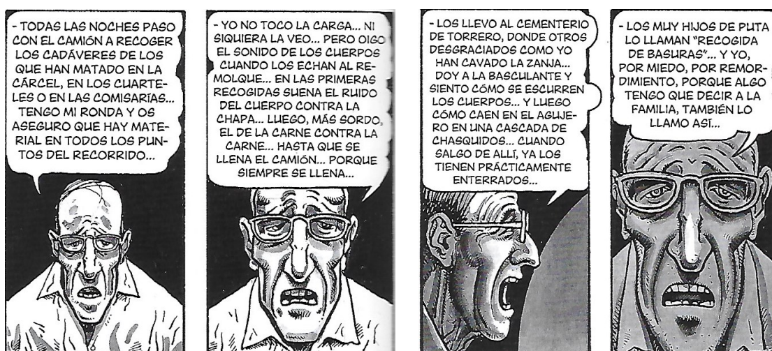
Figure 1. Usages de divers plans pour mettre en valeur le désespoir de l'oncle Secundo.

L'aspect avant tout humain de l'histoire poussera Kim à devoir jouer avec son dessin pour mettre en avant les sentiments des personnages, par leur gestuelle, leur visage, afin de les transmettre de manière directe au lecteur, en les exagérant et en les soulignant grâce à des touches de gris qui creuseront les ombres du visage, comme avec l'expression du désespoir le plus complet de l'oncle Secundo.