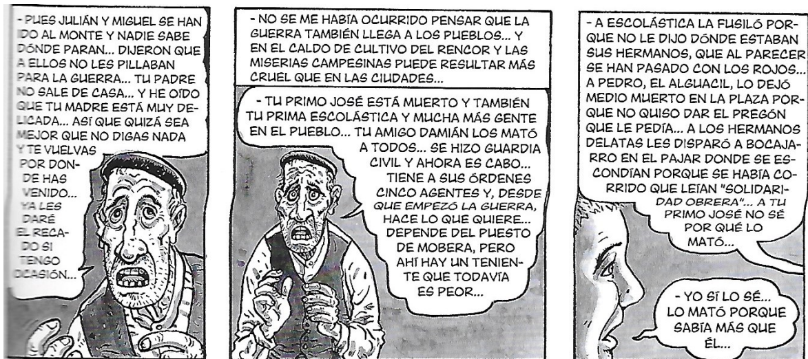
Figure 4. La surabondance du texte pour témoigner de l'horreur.

le scénariste ne transmet pas seulement le témoignage de son père, mais aussi celui d'autres témoins directs de la Guerre Civile. Sa parole n'est pas unique, elle est composée de voix multiples. Dans ces cas, le texte n'est plus au service de la case mais c'est la case qui est au service du texte. Il existe donc, parfois, un décalage volontaire entre l'image et le texte, ce qui va créer un jeu entre le visible et le lisible, entre ce que le lecteur voit et ce qu'il imagine. Ce qui va engendrer une complémentarité entre le texte et l'image, les deux forment un tout, et séparément ils peuvent raconter quelque chose, c'est leur mise en commun qui fait naître le sens et El arte de volar se base sur cette alternance.