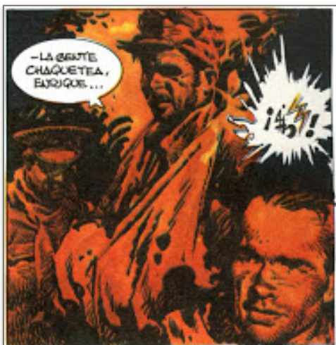
Figure 3. Le rouge source d'insécurité

marquée par l'esthétique hippie des années 1960. 73 Le noir joue un rôle important, car il permet de souligner les contrastes et vient appuyer la couleur, en faisant ressortir certains détails et en renforçant l'action. De plus, sa signification en tant que couleur du deuil et de la mort, rappelle que les soldats évoluent dans une époque troublée, comme avec les scènes de nuit où les balles apparaissent comme des éclairs jaunes qui fendent le ciel. Le rouge est