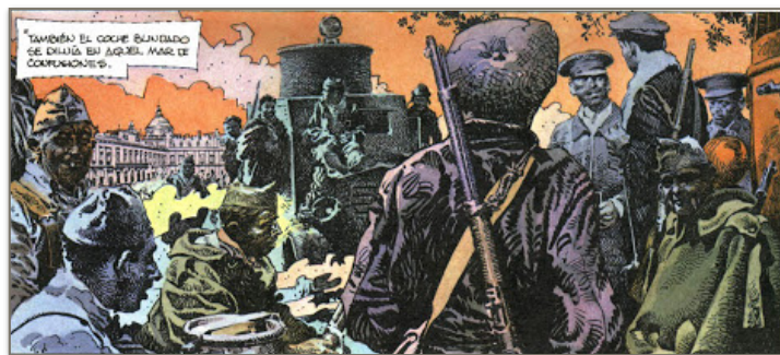
Figure 2. Le jeu des couleurs donne à cette case une ambiance surréelle.

Contrairement au monochromatisme des années 70, lorsqu'il s'agissait de dessiner la Guerre Civile, Palacios décida de prendre le contre-pied en créant une fresque historique aux couleurs agressives. Il le justifia dans la préface du premier tome : « En los archivos, en las hemerotecas, la guerra de España salvo pequeñísimas excepciones, estaba contada en blanco y negro. Yo había vivido la guerra en color, la recordaba en color y en color había de cristalizar.» 71 . L'usage de la couleur comporte des risques quant il s'agit de dessiner la guerre, comme l'explique Benoît Mitaine dans son article, Une guerre sans héros, la guerre civile dans la bande dessinée espagnole (1977-2009) : « soit qu'elle provoque l'admiration au lieu de la répulsion, soit qu'elle détourne l'attention sur le détail (le sang, la chair) au détriment de l'ensemble. » 72 . Cependant Antonio Hernández Palacios y échappa avec brio et en profita pour développer tout un langage narratif qui guide et transmet des sentiments au lecteur. Il utilisa une palette chromatique variée, reposant sur un jeu entre les couleurs chaudes et froides. Benoît Mitaine prétend qu'il serait même possible de parler de « débauche chromatique » car son utilisation de la couleur est