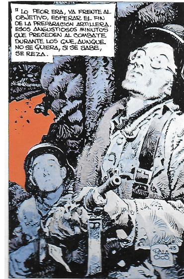
Figure 7. L’angoisse sur les visages