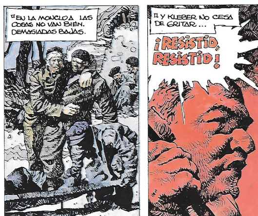
Figure 6. Contraste entre les scènes

d'horrible et de spectaculaire. De plus, Palacios compose avec des débordements 83 , il enlève parfois les bordures des cases faisant que ces dernières se fondent avec le blanc de la page, il utilise des superpositions, parfois les cases fonctionnent en décalage pour montrer des contradictions comme lorsque Kleber hurle l'ordre de résister malgré des soldats blessés et hors de combat. Le regard est