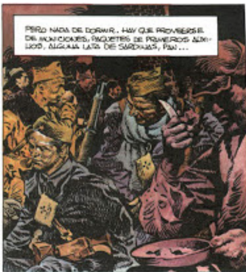
Figure 1. Exemple de surcharge.

Comme nous pouvons le constater de ses productions antérieures, comme El Cid ou même Manos Kelly , le style d'Antonio Hernández Palacios peut être qualifié de réaliste. Il décida de conserver le réalisme de son trait, tout en le surchargeant pour créer un graphisme qualifié de baroque par Benoît Mitaine. 70 L'usage de ce style apparaît comme le