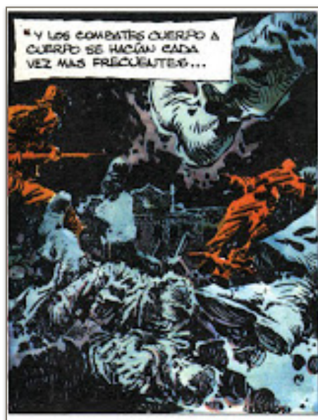
Figure 4. La bataille est un charnier

du champ de bataille. Lorsque la violence se déchaîne, les tons deviennent vifs et contrastés, avec du rouge, du jaune, du violet, du bleu. Par opposition aux couleurs ternes et terreuses qui seront utilisées dans les moments de calme, afin de montrer l'état d'âme des soldats, la tristesse et les conditions climatiques. Le réalisme du trait est contrebalancé par la couleur qui peuvent donner un aspect irréel à certaines scènes. Les contrastes, tout en faisant ressortir la violence avec intensité, permettent aussi de garder une distance avec la dureté des faits qui sont montrés comme avec les hommes se jetant les uns contre les autres avec brutalité, les couleurs empêchent de discerner l'identité de ceux qui sont à terre comme de ceux qui s'entretuent. Ainsi Palacios joue avec les couleurs