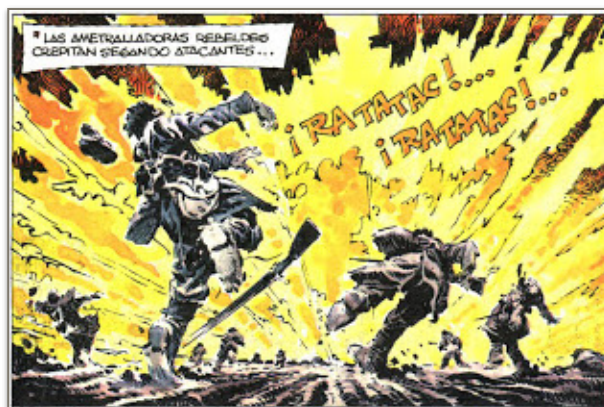
Figure 9. La violence de la bataille

qui, pour reprendre l'image d'Adrien GenouDET, « parle avec les mains » 84 , avec un langage qui lui est propre et unique, un langage qui lui permit de s'exprimer au travers du dessin pour transmettre une interprétation de la guerre qui se veut universelle et personnelle. Ce sont deux bandes dessinées qui sont là pour donner à voir