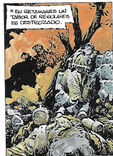
Figure 8. Aspect 'goyesque' des cases