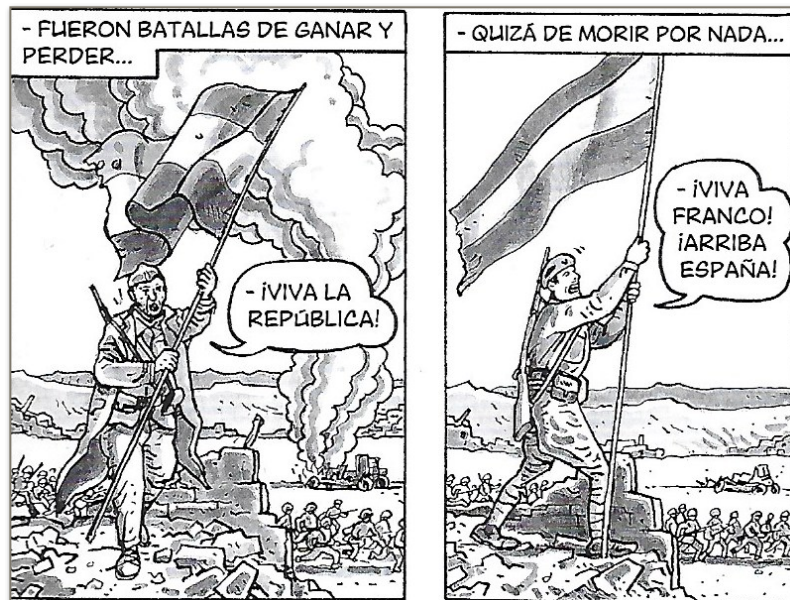
Figure 5. La Guerre Civile présentée comme fratricide

El arte de volar nous propose une interprétation du conflit où les personnages qui entourent Antonio sont tous espagnols, que cela soit l'anarchiste, le civil ou bien le franquiste. Ainsi, les étrangers ne semblent pas avoir de présence au cours du conflit. Il y a bien la présence d'une autre nationalité, incarnée par le communiste, qui se mêle au conflit et apporte d'une certaine façon la défaite. Cependant l'ingérence russe, aussi négative soit-elle, sera rapidement reléguée au second plan. La Guerre Civile nous est montrée comme une guerre fratricide menée par des espagnols, où ces derniers souffrent et meurent face à d'autres espagnols. Cette sensation domine tout du long du récit, comme avec les deux cases où un républicain plante un drapeau qu'un franquiste retire immédiatement. Les deux hommes ont presque la même posture, ils ont le même drapeau en main et ils crient un '¡viva!' pendant qu'ils accomplissent leur geste. Cette mise en parallèle les désigne comme des espagnols, que seule la différence de camp oppose au cours de cette lutte.