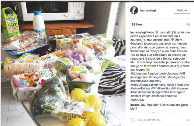
laurenalvtg Follow 128 likes 2d laurenalvtg Hello 🍌 ce matin j'ai tenté une petite expérience en allant faire mes courses, j'ai tout acheté #bio 🍌 étant étudiante je pensais pas avoir les moyens pour aller dans ce genre de rayons, mais finalement au total j'en ai eu pour environ 10€ de plus que d'habitude et encore j'ai renouvelé le stock de pâte, riz, semoule etc! Je suis trop contente, je peux vous dire que je ne ferais mes courses plus que dans ces rayons 🍌 #biologique #agriculturebiologique #AB #mangersain #mangerbien #mangerbio #healthyfood #healthy #reequilibragealimentaire #love #foodlover #follow4follow #14 #like4like #14 #course #fruit #vitamins #vegetables #instagood #instafit #fitgirl #instabio #colorful #goodday insane_lau Trop bien ! Dans quel magasin bio ?