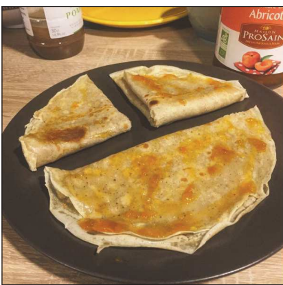
francoise_rssl Gironde 43 likes 6d francoise_rssl On sourit... c'est la chandeleur! Recette Vegan: 250g de farine, 1 pincée de sel, 1c à s de sucre, vanille en poudre, 1/4 de lait végétal, 1/4 d'eau 🍷 #vegan #veganirl #veganfood #veganlifestyle #chandeleur #repas #foodporn #recpe #recette #recettevegan #recetteidjour #health #healthy #healthyfood #foodlover #mangersain #diy #faitmaison Add a comment...