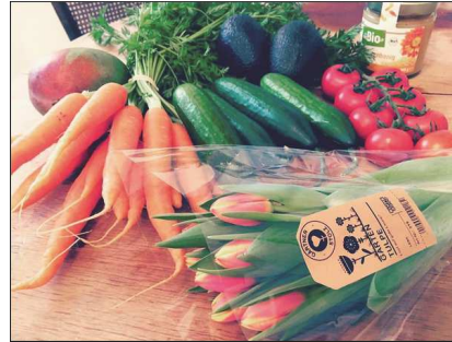
rus.aleksandra 26 Me gusta 5 días rus.aleksandra Back from the bio market 🍷🍷🍷🍷🍷 #bio #veggies #biofruit #tulips #flowersalways #fleurs #tulps 🍷 #healthy #happy #adore #legumesbio #fruitsbio Añade un comentario...