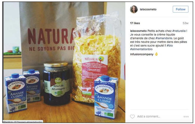
laicosmeto Follow 17 likes 53w laicosmeto Petits achats chez #naturala ! Je vous conseille la crème liquide d'amande de chez #amandorie. Le goût est très neutre pour mettre dans des pâtes et c'est sans sucre ajouté !! #bio #alimentationbio infusioncompany 🍌