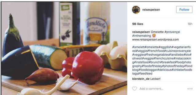
reissepisen Follow 98 likes 18h reissepisen Omelette #provençal #inthemaking 🍌 www.reissepisen.wordpress.com #omelette #omelette #eggdish #vegetarianfood #veggie #frenchfood #cuisineprovençale #veggies #freshvegetables #flandrie #bio #oliveoil #veggie #frenchcuisine #instacooking #instafood #brunch #breakfast #foodphotography #foodoftheday #photoftheday #foodblog #foodlogger #delicious #chilibe #foodlogs #feedfeed klarstein_de Lecker!