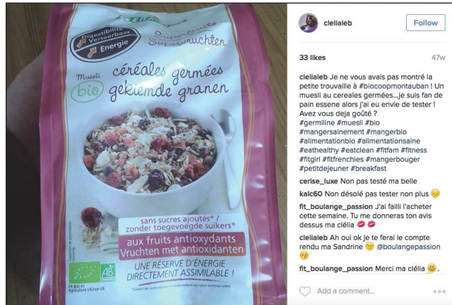
clielaleb 33 likes 47w clielaleb Je ne vous avais pas montré la petite trouvaille à #biocoopmontauban ! Un muesli au céréales germées... Je suis fan de pain essence alors j'ai eu envie de tester ! Avez vous déjà goûté ? #germline #muesli #bio #mangersainement #mangerbio #alimentationbio #alimentsainsaine #eathealthy #eatclean #fitfam #fitness #fitgirl #fitfrenchie #mangerbougier #petitdejeuner #breakfast cerise_luxe Non pas testé ma belle kaic60 Non désolé pas tester non plus fit_boulangre_passion J'ai failli l'acheter cette semaine. Tu me donnes ton avis dessus ma clélia 🥰 clielaleb Ah ouai ok je te ferai le compte rendu ma Sandrine 🥰 @boulangrepassion fit_boulangre_passion Merci ma clélia 🥰 ♥️ Add a comment...