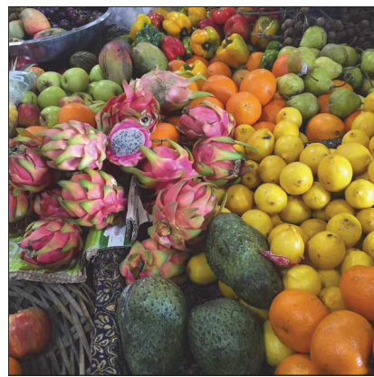
marinefabre_ 73 Me gusta 1 dia marinefabre_ De la verdure 🍷 Du soleil 🍷 Des sourires 🍷 Des moments et souvenirs partagés ... Voici un cocktail savoureux ... 🍷🍷🍷 #travel #voyage #ilemaurice #networkmarketing #fit #fitness #fitgirl #fitnessgirl #healthy #bienmanger #bienbouger #bienetre #eatclean #eathealthy #freedom #b2ulife #colors #fruit #market claire_fitnesslife I love your page and what you're sharing! Keep it up! ckpetersen Les couleurs 🍷 Añade un comentario...