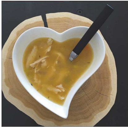
cuisine.moi.des.pail... 26 likes 16w Pour les bébés : je mixe un peu de poulet et je mets de la floraline à l'intérieur. Pour les grands : je mets des vermicelles et le poulet en morceaux. Recette - faire revenir dans un peu d'huile d'olive le poulet. Ajouter des carottes, un poireaux, une branche de céleri et un oignon coupés en petits morceaux. Couvrir d'eau, rajouter une feuille de laurier et un peu de thym et laisser cuire 30 min à feu fort. Enlever le poulet et laisser cuire 30 minute à feu moyen. Je mixe à part le bouillon pour bébé avec les légumes et un peu de poulet et rajoute à chaque repas la floraline au dernier moment. #souplesbio #healthyfood #petitpobio #petitpotsbebe #alimentation bébé #dietfood #cuisinemoidespaillettes #equilibrealimentaire #babycook #babyfood #faimdubebe ♥️ Add a comment...