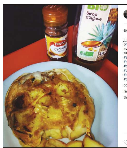
_lbikini_fit63 64 likes 13h _lbikini_fit63 On démarre bien la journée, 6h:30 ce matin protéine pancakes, cuite avec des pommes, un peu de cannelle et sirop d'agave bio. Bonne journée! #eat #eatclean #diet #nutrition #sport #proteinpancakes #bio #fitnessmotivation #bikiniprep #bikinicompetitor #muscle #strongwomen #fitgirl #motivation #matin #petitdejeuner #smile coseikawa Wonderfull rayelbe Sweet 🍷 thecross911 🍷 Add a comment...