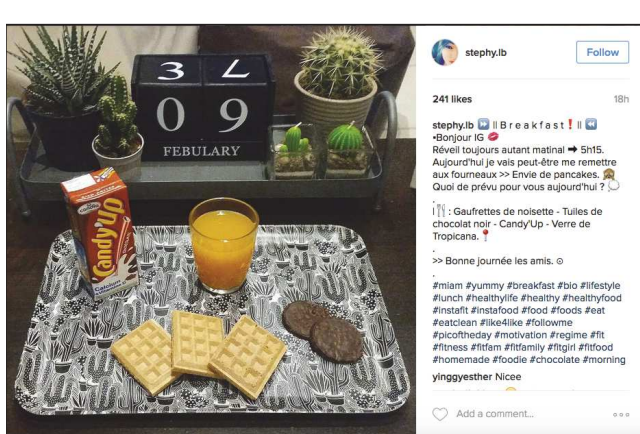
stephy.lib 241 likes 18h stephylib 📺 Breakfast ! 📺 -Bonjour IG 🥰 Réveille toujours autant matinal ➡️ 5h15. Aujourd'hui je vais peut-être me remettre aux fourneaux ➡️ Ennui de pancakes 🥞 Quoi de prévu pour vous aujourd'hui ? 🤔 📌 : Gaufrettes de noisette - Tuiles de chocolat noir - CandyUp - Verre de Tropicana. ➡️ Bonne journée les amis. 🌞 #miam #yummy #breakfast #bio #lifestyle #lunch #healthylife #healthy #healthfood #instafit #instafood #food #foods #eat #eatclean #ike4like #followme #picoftheday #motivation #regime #fit #fitness #fitfam #fitfamily #fitgirl #fitfood #homemade #foodie #chocolate #morning yinggyesther Nice ♥️ Add a comment...