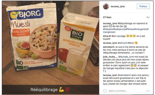
lauraa_lyne Follow 27 likes 2w lauraa_lyne Rééquilibrage on reprend le sport 🍌 (Go Go Go 🍌) #babybio #babybump #fitness #mangerbio #mangersain elina.b1 Bon courage 🍌🍌🍌 on y est toute!!! lauraa_lyne @elina.b1 Merci 🍌 sahrabenh Je suis à ma 2ème semaine de tbc moi, mais panique à bord car pas de rééquilibrage alimentaire... un conseil ? Julie_Louka ... @lauraa_lyne moi aussi j'ai décidé j'en peux plus de mon corps. Après grossesse ! Donc sport ce soir 🍌 et essayer de manger équilibré c'est pour le déjeuner ? 🍌 lauraa_lyne @sahrabenh alors moi perso j'avais fais avant grossesse et c'est top le tbc après niveau alimentation c'est juste que j'essais de manger des choses saine