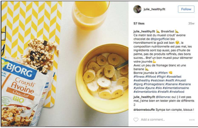
julie_healthyfit Follow 57 likes 35w julie_healthyfit Breakfast 🍌 Ce matin test du muesli crousti avoine chocolat de @bjorgofficiel bio. Honnêtement le goût est bon 🍌, la composition nutritionnelle est pas mal, les ingrédients sont top aussi, pas d'huile de palme, pas de produits raffinés, des bons sucres... Bref un bon muesli pour démarrer votre journée 🍌 Avec un peu de fromage blanc et une banane 🍌 Bonne journée la #fitfam 🍌 #fitness #fitfood #fitgirl #breakfast #eathealthy #eatclean #eatfit #muesli #bjorg #fromageblanc #banane #banana #yellow #jaune #bio #alimentationbio #alimentationbio #instafit #instafood julie_healthyfit @ilievrac oui ! Il est pas mal, j'aime bien en tester plein de différents 🍌 @drbonnebouffe Sympa ton compte, bisous !