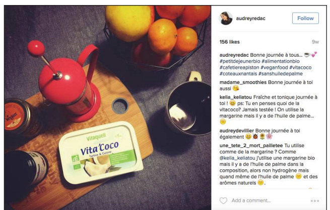
audreyredac Follow 156 likes 9w audreyredac Bonne journée à tous... 🍌 #petitdejeunerbio #alimentationbio #cafetiereapiston #veganfood #vitalocco #coteauxantais #sanshuiledepalme madame_smoothies Bonne journée à toi aussi 🍌 kella_kellatou Fraîche et tonique Journée à toi ! 🍌 ps: Tu en penses quoi de la vitacoco? J'aimais tester! On utilise la margarine mais il y a de l'huile de palme... 🍌 audreydevillier Bonne journée à toi également 🍌🍌🍌 une_tete_2_mort_paillette Tu utilise comme de la margarine? Comme @kella_kellatou j'utilise une margarine bio mais il y a de l'huile de palme dans la composition, alors non hydrogène mais quand même de l'huile de palme 🍌 et des arômes naturels 🍌