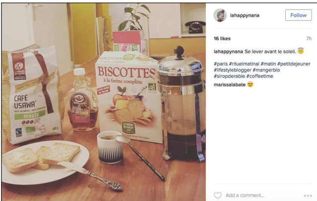
lahappynana Follow 16 likes 7h lahappynana Se lever avant le soleil. 🍌 #paris #rituelmatinal #matin #petitdejeuner #lifestyleblogger #mangerbio #siropderable #cofftime marissalabate 🍌