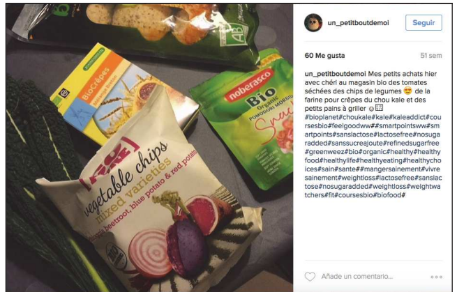
un_petitboutdemol Seguir 60 Me gusta 51 sem un_petitboutdemol Mes petits achats hier avec chéri au magasin bio des tomates séchées des chips de légumes 🍌 de la farine pour crêpes du chou kale et des petits pains à griller 🍌 #biopianet #choukale #kale #kaleaddict #couresbio #eigoodw #smartpointsw #smartpoint #sanctose #actose #eal #nosugar #radde #sanssucrageoute #eal #nosugarfree #greenweez #bio #organic #healthy #healthyfood #healthylife #healthyating #healthychoices #sain #santé #mangersainement #vivresainement #weightloss #actose #eal #nosugar #tos #nosugar #radde #weightloss #weightloss #chiers #fit #coursesbio #biofood 🍌