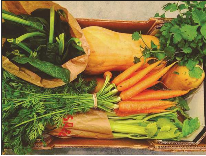
stelle_sd Aix-en-Provence, Fr... 39 Me gusta 3 días stelle_sd Vegetables 🍷 #colors #legumes #legumesbio #legumesfrais #bio #veganfood #vegetables #food #foodporn #aixenprovence #viesaine #onfaitdesonmieux Añade un comentario...