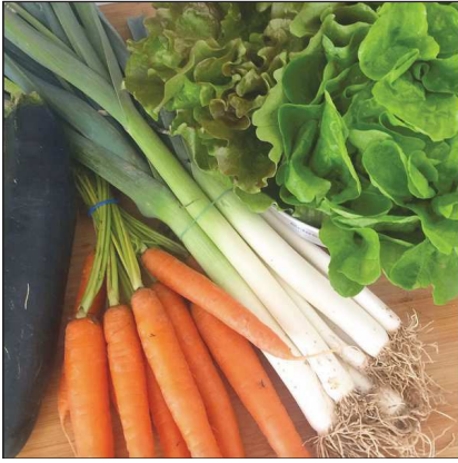
tambarauna Ville de Sannois 22 likes 3h tambarauna Voici les légumes pour la semaine!!! #reequilibragealimentaire #mangersain #mangersainement #mangerbouger #mangerbio #lescourses #produitfrais #fraicheur #marché #marchébio #legumes #salade #chezmoi #courgette #carottes #pointeaux #salade #feuilledechene #laitue #modestylefr #adore!!! Add a comment...