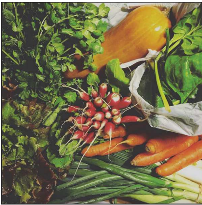
aries_and_lions Jouques 46 Me gusta 7 sem aries_and_lions La joie de recevoir des légumes bio magiques et savoureux! 🍷🍷 #legumes #legumesdiver #vegi #vegetarien #vegan #bio #legumesbio #panierbio #plaisir #saveur #cuisine #cuisinefrancaise #cuisineprovencale #instahappy #instadaily #instagood #instagram #instavegan #instavege #anton_tarente_ Trop bien !! attend mon repas germiné_graines_germees 🍷 quitterlesquesoone 🍷 misukjuices Adorable one Añade un comentario...