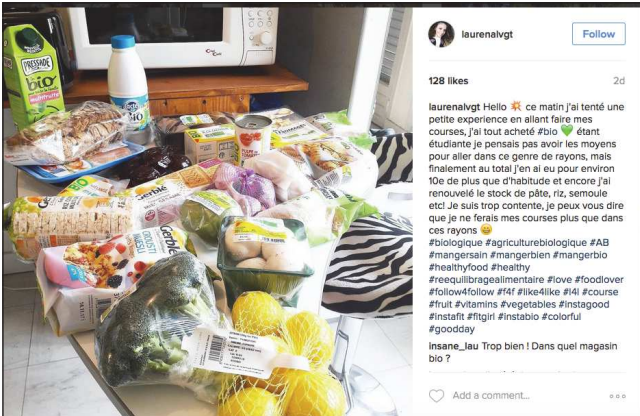
laurenalvtg Follow 128 likes 2d laurenalvtg Hello 🍌 ce matin j'ai tenté une petite expérience en allant faire mes courses, j'ai tout acheté #bio 🍌 étant étudiante je pensais pas avoir les moyens pour aller dans ce genre de rayons, mais finalement au total j'en ai eu pour environ 10€ de plus que d'habitude et encore j'ai renouvelé le stock de pâte, riz, semoule etc! Je suis trop contente, je peux vous dire que je ne ferais mes courses plus que dans ces rayons 🍌 #biologique #agriculturebiologique #AB #mangersain #mangerbien #mangerbio #healthyfood #healthy #reequilibragealimentaire #love #foodlover #follow4follow #14 #like4like #14 #course #fruit #vitamins #vegetables #instagood #instafit #fitgirl #instabio #colorful #goodday insane_lau Trop bien ! Dans quel magasin bio ?