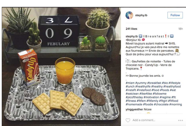
stephy.lib 241 likes 18h stephylib Bonjour IG 🥰 Réveille toujours autant matinal 🌞 5h15. Aujourd'hui je vais peut-être me remettre aux fourneaux >>> Envie de pancakes 🥞 Quoi de prévu pour vous aujourd'hui ? 🗓️ 👉 : Gaufrettes de noisette - Tuiles de chocolat noir - CandyUp - Verre de Tropicana. >>> Bonne journée les amis. 🌸 #miam #yummy #breakfast #bio #lifestyle #lunch #healthylife #healthy #healthfood #instafit #instafood #food #foods #eat #eatclean #ike4like #followme #picoftheday #motivation #regime #fit #fitness #fitfam #fitfamily #fitgirl #fitfood #homemade #foodie #chocolate #morning yinggyesther Nice ♥️ Add a comment...