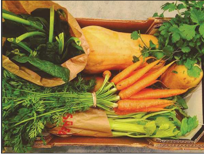
stelle_sd Aix-en-Provence, Fr... Seguir 39 Me gusta 3 días stelle_sd Vegetables 🍷 #colors #legumes #legumesbio #legumesfrais #bio #veganfood #vegetables #food #foodporn #aixenprovence #viesaine #onfaitdesonmieux ♥️ Añade un comentario... 🌐