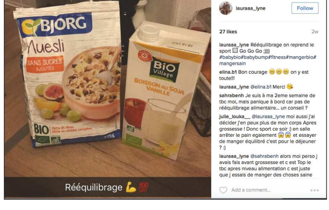
lauraa_lyne Follow 27 likes 2w lauraa_lyne Rééquilibrage on reprend le sport 🍌 (Go Go Go 🍌) #babybio #babybump #fitness #mangerbio #mangersain elina.b1 Bon courage 🍌🍌🍌 on y est toute!!! lauraa_lyne @elina.b1 Merci 🍌 sahrabenh Je suis à ma 2ème semaine de tbc moi, mais panique à bord car pas de rééquilibrage alimentaire... un conseil ? Julie_Louka @lauraa_lyne moi aussi j'ai décidé j'en peux plus de mon corps Après grossesse ! Donc sport ce soir :3 en salle arrêter le pain également 🍌🍌 et essayer de manger équilibré c'est pour le déjeuner ? :3 lauraa_lyne @sahrabenh alors moi perso j'avais fais avant grossesse et c'est Top le tbc après niveau alimentation c'est juste que j'essais de manger des choses saine