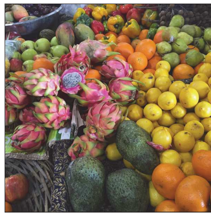
marinefabre_ Seguir 73 Me gusta 1 día marinefabre_ De la verdure 🍷 Du soleil 🍷 Des sourires 🍷 Des moments et souvenirs partagés ... Voici un cocktail savoureux ... 🍷🍷🍷 #travel #voyage #ilemaurice #networkmarketing #fit #fitness #fitgirl #fitnessgirl #healthy #bienmanger #bienbouger #bienetre #eatclean #eathealthy #freedom #b2ulife #colors #fruit #market claire_fitnesslife I love your page and what you're sharing! Keep it up! ckpetersen Les couleurs 🍷 ♥️ Añade un comentario... 🌐