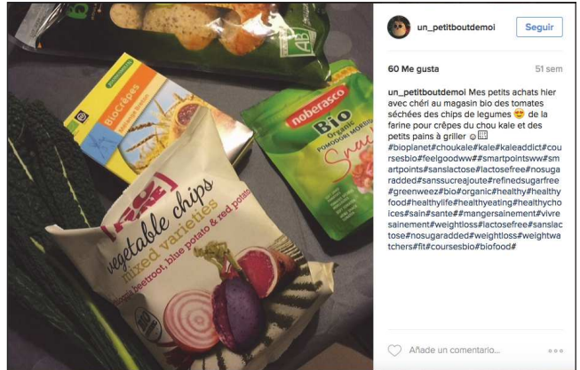
un_petitboutdemol Suivre 60 Me gusta 51 sem un_petitboutdemol Mes petits achats hier avec chéri au magasin bio des tomates séchées des chips de légumes 🍌 de la farine pour crêpes du chou kale et des petits pains à griller 🍌 #biopianet #choukale #kale #kaleaddict #couresbio #eigoodw #smartpointsw #smartpoints #sanctose #actose #eal #nosugar #radde #sanssucrageoute #eal #nosugarfree #greenweez #bio #organic #healthy #healthyfood #healthylife #healthyeating #healthyoices #sain #santé #mangersainement #vivresainement #weightloss #actose #eal #nosugar #tos #nosugar #radde #weightloss #weightloss #chiers #fit #coursesbio #biofood 🍌