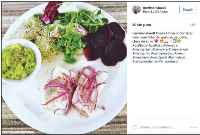
narrimstauid Paris La Défense 30 Me gusta 1 día narrimstauid Como é bom poder fazer uma comidinha tão gostosa, saudável, cheia de amor 🥰🥰🥰🥰🥰🥰 #gratitude #gratidão #bienêtre #mangersain #bienvivre #bienmanger #mangerbio #mercipourtout #merci #merciavie #merci paris #faitmaison #cuidandodemin #amouredesoi ♥️ Añadir un comentario...