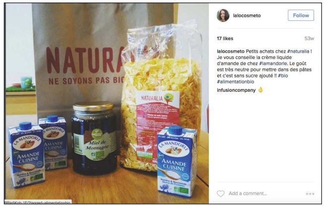
laicosmeto Follow 17 likes 53w laicosmeto Petits achats chez #naturala ! Je vous conseille la crème liquide d'amande de chez #amandorie. Le goût est très neutre pour mettre dans des pâtes et c'est sans sucre ajouté !! #bio #alimentationbio infusioncompany 🍌