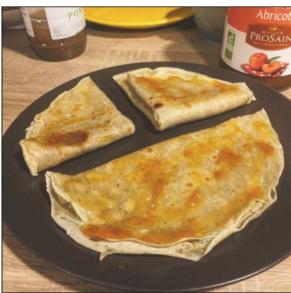
francoise_rssl Gironde Follow 43 likes 6d francoise_rssl On sourit... c'est la chandeleur! Recette Vegan: 250g de farine, 1 pincée de sel, 1c à s de sucre, vanille en poudre, 1/4 de lait végétal, 1/4 d'eau 🍷 #vegan #veganirl #veganfood #veganlifestyle #chandeleur #repas #foodporn #recette #recettevegan #recetteidjour #health #healthy #healthyfood #foodlover #mangersain #diy #faitmaison ♥️ Add a comment... 🌐