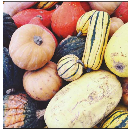
les_petites_bricoles Seguir 51 Me gusta 1 día les_petites_bricoles Cucurbita - locales, raisonnées, colorées, variées (surtout chez votre primeur 🍷) #healthy #legumesdesaison #courge #pumpkin #mangersain #local #agriculture raisonnée #bio #organic #bienmanger #homemadefood #legumesbio bonaveze Miam quitterlesquesosone 🍷 ♥️ Añade un comentario... 🌐