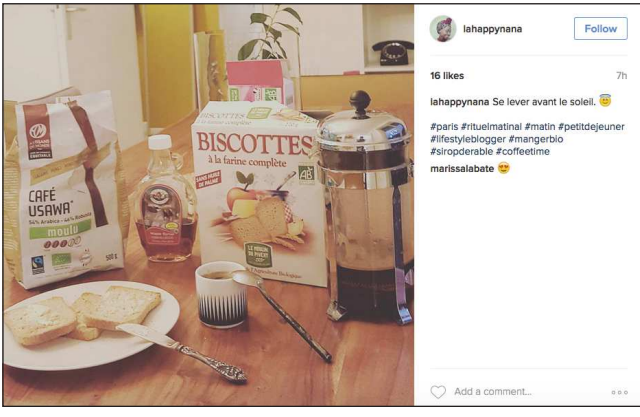
lahappynana Follow 16 likes 7h lahappynana Se lever avant le soleil. 🍌 #paris #rituelmatinal #matin #petitdejeuner #lifestyleblogger #mangerbio #siropderable #coffertime #marissalabate 🍌