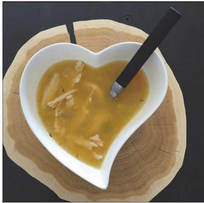
cuisine.moi.des.pail... 26 likes 16w Pour les bébés : je mixe un peu de poulet et je mets de la floraline à l'intérieur. Pour les grands : je mets des vermicelles et le poulet en morceaux. Recette - faire revenir dans un peu d'huile d'olive le poulet. Ajouter des carottes, un poireaux, une branche de céleri et un oignon coupés en petits morceaux. Couvrir d'eau, rajouter une feuille de laurier et un peu de thym et laisser cuire 30 min à feu fort. Enlever le poulet et laisser cuire 30 minute à feu moyen. Je mixe à part le bouillon pour bébé avec les légumes et un peu de poulet et rajoute à chaque repas la floraline au dernier moment. #souplesbio #healthyfood #petitpotbio #petitpotsbebe #alimentation bébé #dietspots #cuisinemoidespaillettes #equilibrealimentaire #babycook #babyfood #faimdubebe ♥️ Add a comment...