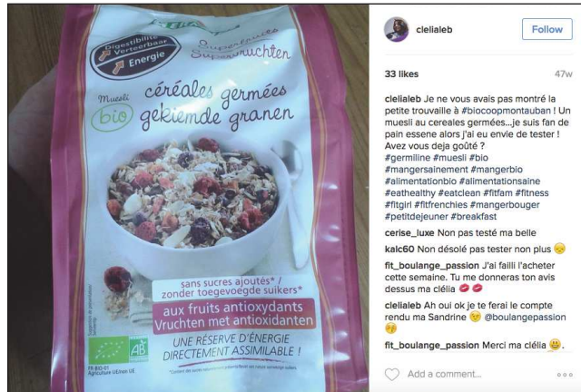
clielaleb 33 likes 47w clielaleb Je ne vous avais pas montré la petite trouvaille à #biocoopmontauban ! Un muesli au céréales germées... Je suis fan de pain essence alors j'ai eu envie de tester ! Avez vous déjà goûté ? #germline #muesli #bio #mangersainement #mangerbio #alimentationbio #alimentsainsaine #eathealthy #eatclean #fitfam #fitness #fitgirl #fitfrenchie #mangerbougier #petitdejeuner #breakfast cerise_luxe Non pas testé ma belle kaic60 Non désolé pas tester non plus fit_boulangre_passion J'ai failli l'acheter cette semaine. Tu me donnes ton avis dessus ma clélia 🥰 clielaleb Ah ouai ok je te ferai le compte rendu ma Sandrine 🥰 @boulangrepassion fit_boulangre_passion Merci ma clélia 🥰 ♥️ Add a comment...