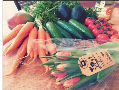
rus.aleksandra Seguir 26 Me gusta 5 días rus.aleksandra Back from the bio market 🍷🍷🍷🍷🍷 #bio #veggies #biofruit #tulips #flowersalways #fleurs #tulps 🍷 #healthy #happy #adore #legumesbio #fruitsbio ♥️ Añade un comentario... 🌐