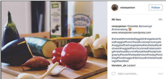
reissepisen Follow 98 likes 18h reissepisen Omelette #provençal #inthemaking 🍌 www.reissepisen.wordpress.com #omelett #omelette #eggdish #vegetarianfood #veggie #frenchfood #cuisineprovençale #veggies #freshvegetables #flandieburbio #oliveoil #veggie #frenchcuisine #instacooking #instafood #brunch #breakfast #foodphotography #foodoftheday #photoftheday #foodblog #foodlogger #delicious #chiliebefood #logs #feedfeed klarstein_de Lecker!