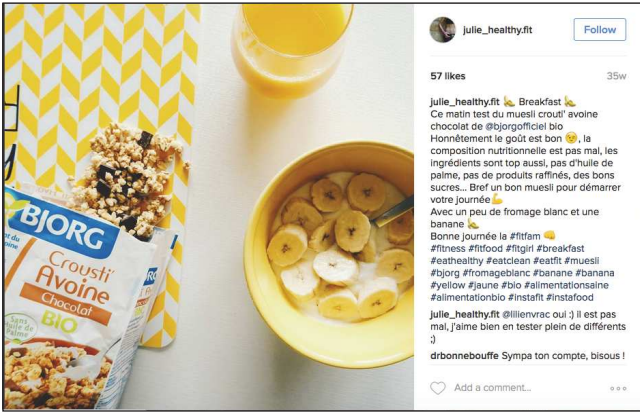
julie_healthyfit Follow 57 likes 35w julie_healthyfit Breakfast 🍌 Ce matin test du muesli crousti avoine chocolat de @bjorgofficiel bio. Honnêtement le goût est bon 🍌, la composition nutritionnelle est pas mal, les ingrédients sont top aussi, pas d'huile de palme, pas de produits raffinés, des bons sucres... Bref un bon muesli pour démarrer votre journée 🍌 Avec un peu de fromage blanc et une banane 🍌 Bonne journée la #fitfam 🍌 #fitness #fitfood #fitgirl #breakfast #eathealthy #eatclean #eatfit #muesli #bjorg #fromageblanc #banane #banana #yellow #jaune #bio #alimentationbio #alimentationbio #instafit #instafood julie_healthyfit @ilievrac oui ! Il est pas mal, j'aime bien en tester plein de différents 🍌 @rbonnebouffe Sympa ton compte, bisous !