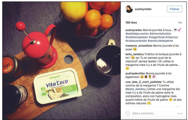
audreyredac Follow 156 likes 9w audreyredac Bonne journée à tous... 🍌 #petitdejeunerbio #alimentationbio #cafetiereapiston #veganfood #vitalocco #coteauxantais #sanshuiledepalme madame_smoothies Bonne journée à toi aussi 🍌 kella_kellatou Fraîche et tonique Journée à toi ! 🍌 ps: Tu en penses quoi de la vitacoco? J'aimais tester! On utilise la margarine mais il y a de l'huile de palme... 🍌 audreydevillier Bonne journée à toi également 🍌🍌🍌 une_tete_2_mort_paillette Tu utilise comme de la margarine? Comme @kella_kellatou j'utilise une margarine bio mais il y a de l'huile de palme dans la composition, alors non hydrogène mais quand même de l'huile de palme 🍌 et des arômes naturels 🍌