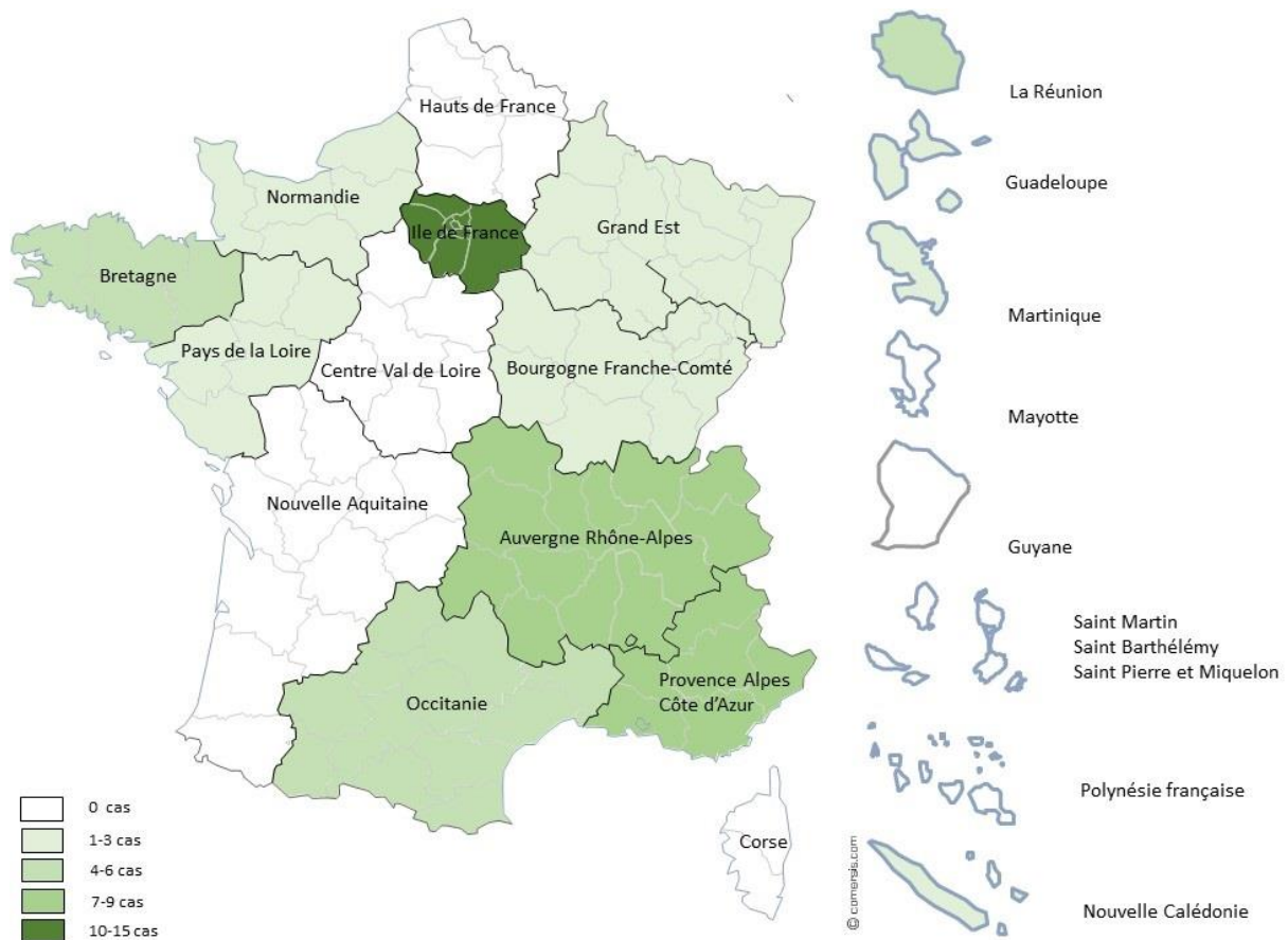
Figure 3 : Distribution géographique des cas de mélioiïdose sur le territoire français

La région de recours au soin ne correspondait pas toujours à la région de résidence : sur les 15 cas diagnostiqués en Ile-de-France, 2 ont concerné des habitants des Hauts-de-France, 1 un habitant de l'île Saint-Barthélemy, 1 des Etats-Unis et la région de résidence était inconnue dans 5 des cas. 4 des cas d'importation diagnostiqués dans les autres régions ont impliqué des expatriés français ou des voyageurs étrangers de passage (1 à la Réunion, 1 en Bretagne, 1 en Occitanie et 1 en Pays de la Loire concernant respectivement des citoyens des Philippines, de Thaïlande, du Vietnam et de Madagascar). Enfin, 1 des cas identifiés à La Réunion était un habitant de Mayotte.