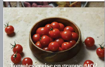
Tomates cerise en grappe BACK