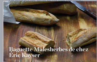
Baguette Malesherbes de chez Eric Kayser

Un poulet moelleux et une sauce satay aux cacahuètes sur un lit de riz thaï parfumé