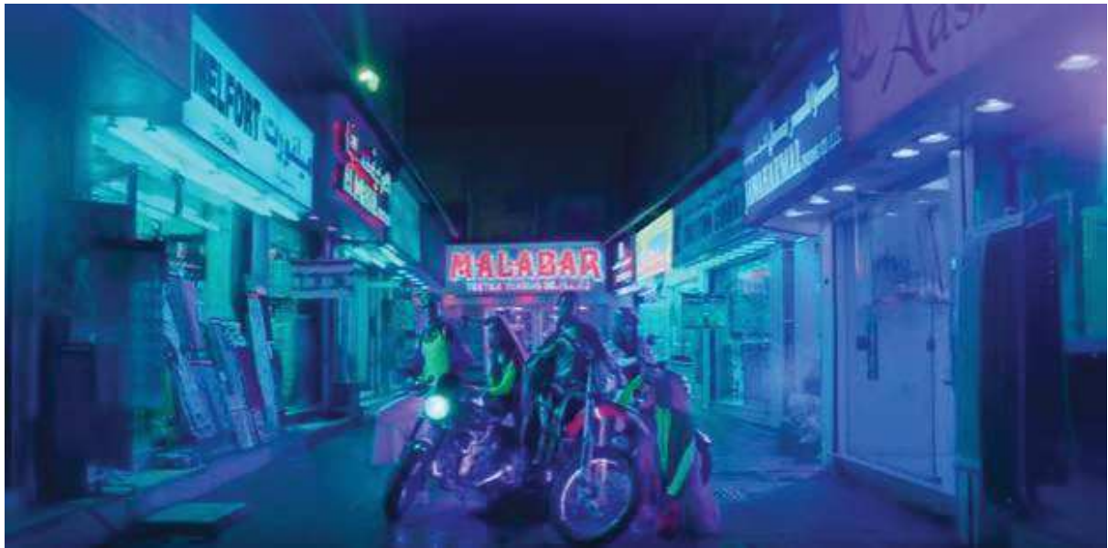
Annexe 7: Capture d'écran spot publicitaire Nike Women What will they say about you ? , par Wieden & Kennedy Amsterdam, 2017