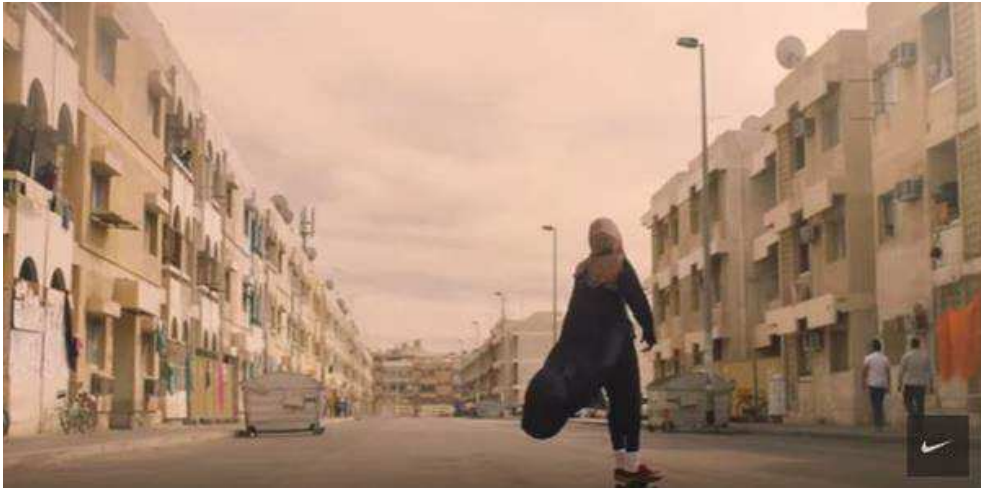
Annexe 5: Capture d'écran spot publicitaire Nike Women What will they say about you ? , par Wieden & Kennedy Amsterdam, 2017