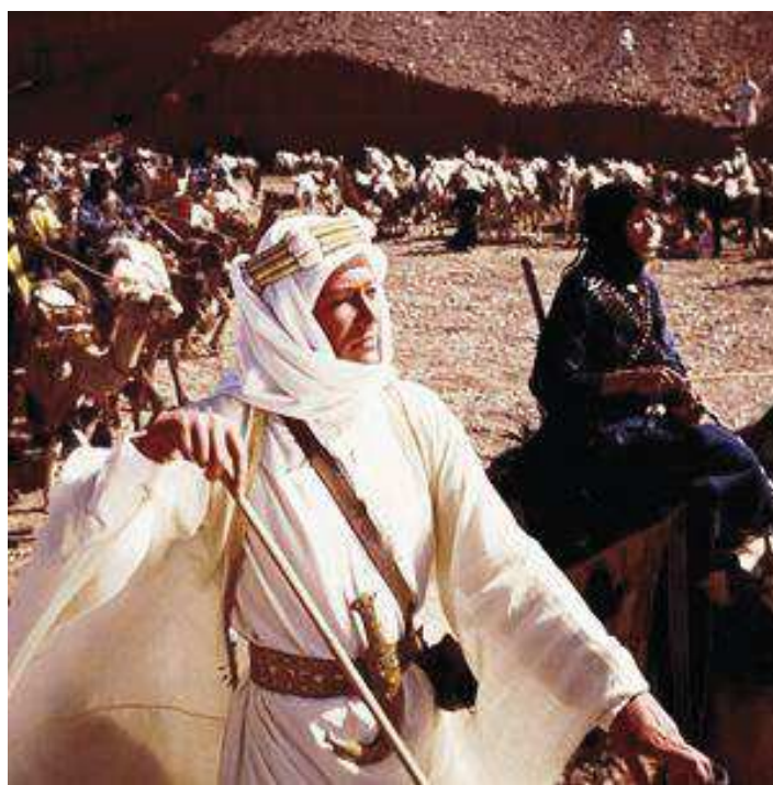
Annexe 2 : Lawrence of Arabia , film réalisé par David Lean, 1962