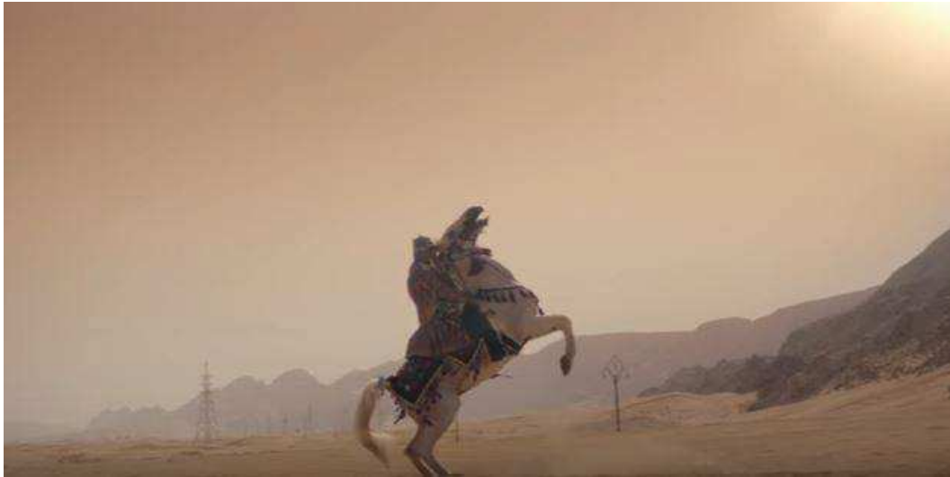
Annexe 3: Capture d'écran spot publicitaire Nike Women What will they say about you ? , par Wieden & Kennedy Amsterdam, 2017