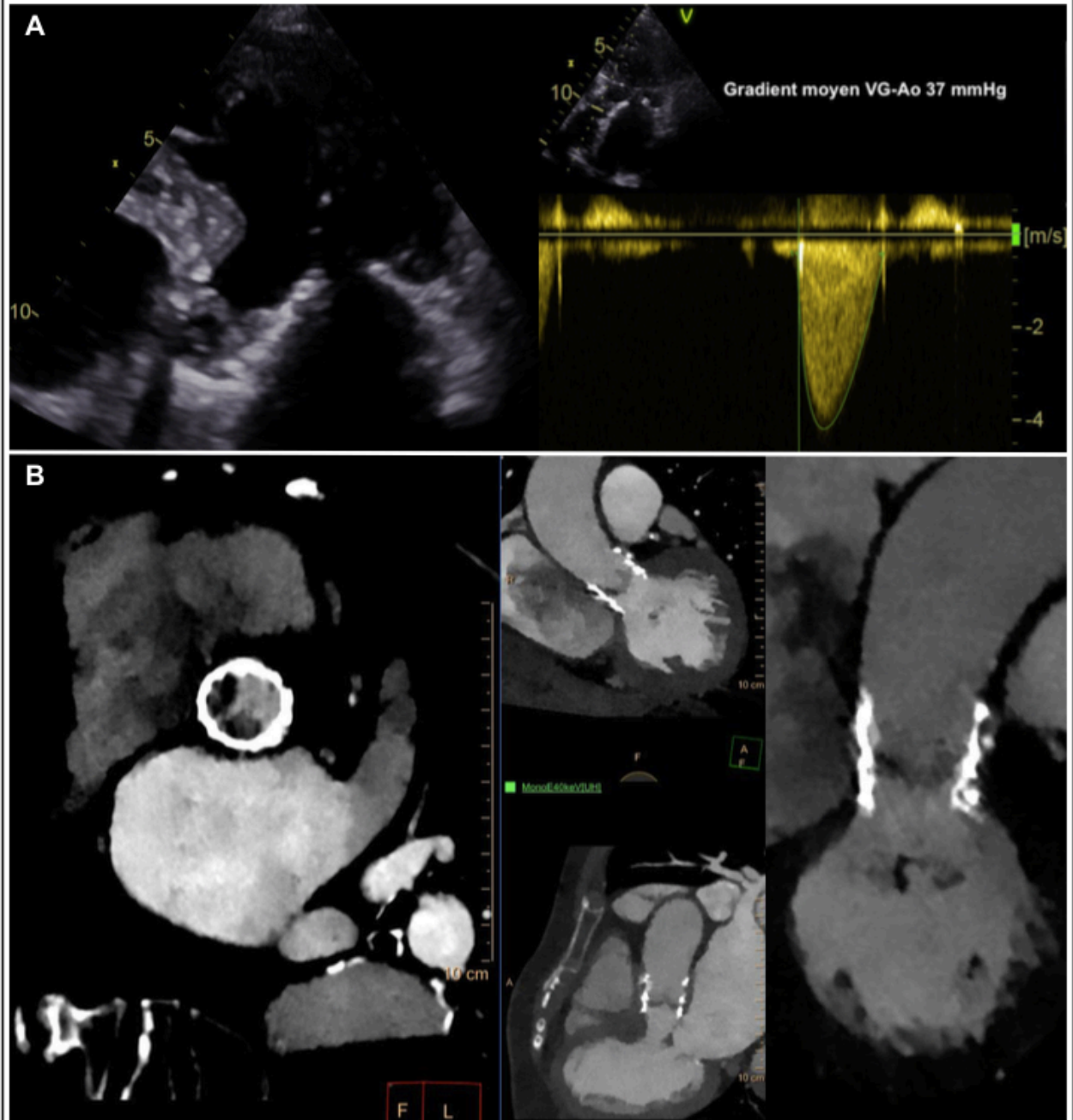
FIGURE 1 Images échocardiographiques et scannerographiques d'une thrombose clinique de TAVI

Patiente de 87 ans implantée d'un TAVI EDWARDS. Thrombose clinique à 7 jours de l'implantation. A = Images ETT montrant un épaissement des cusps et élévation du gradient moyen VG-Ao. B = Reconstructions scanner valvulaire 4D montrant des hypodensités et un épaissement du fond de 2 cusps sur 3. Tous les examens ont été réalisés sur un tomodensitomètre à double couche et double énergie à source unique (iQon, Philips Medical).