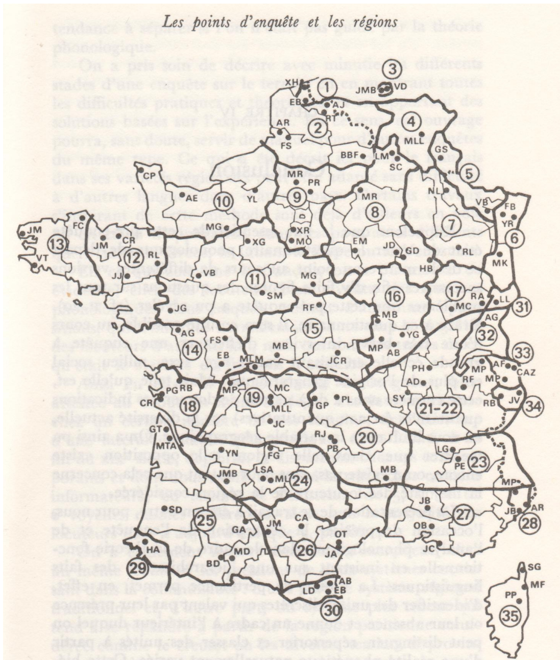
Annexe 5: Répartition géographique des informateurs de Walter (1982:201)