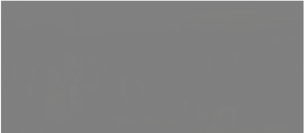
Illustration 6: COURBET Gustave, Un enterrement à Ornans , 1849-50, huile sur toile, 315 x 660 cm, Paris, Musée d'Orsay