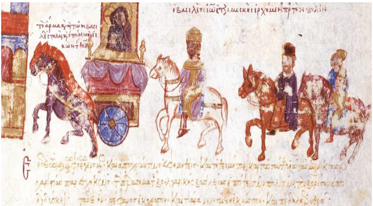
Figure 1 : Le triomphe de Jean Tzimiskès, Chronique de Skylitzès de Madrid, Palerme ? (Madrid, Biblioteca Nacional de Espana, Vitr. 26-2, f. 172)

L'ambivalence du passage évoque un souverain belliqueux, mais profondément chrétien et soucieux de témoigner de l'importance de sa foi dans ses conquêtes militaires. Toujours dans le contexte des conflits contre Syméon, l'empire byzantin a lui aussi su manifester son intérêt pour les reliques qui se trouvaient dans le royaume bulgare. Lors de la victoire de Jean Tzimiskès sur le Rus Sviatoslav, d'après les chroniques de Léon le Diacre, Jean Skylitzès et Jean Zonaras, les armées byzantines s'accaparèrent de nombreux biens de la capitale Preslav qui furent mis en procession lors du triomphe de l'empereur Jean Ier. 120 Le bien le plus précieux qui fut exhibé sur le char, place normalement réservée au basileus , fut une icône de la Vierge à l'Enfant prise en Bulgarie. 121