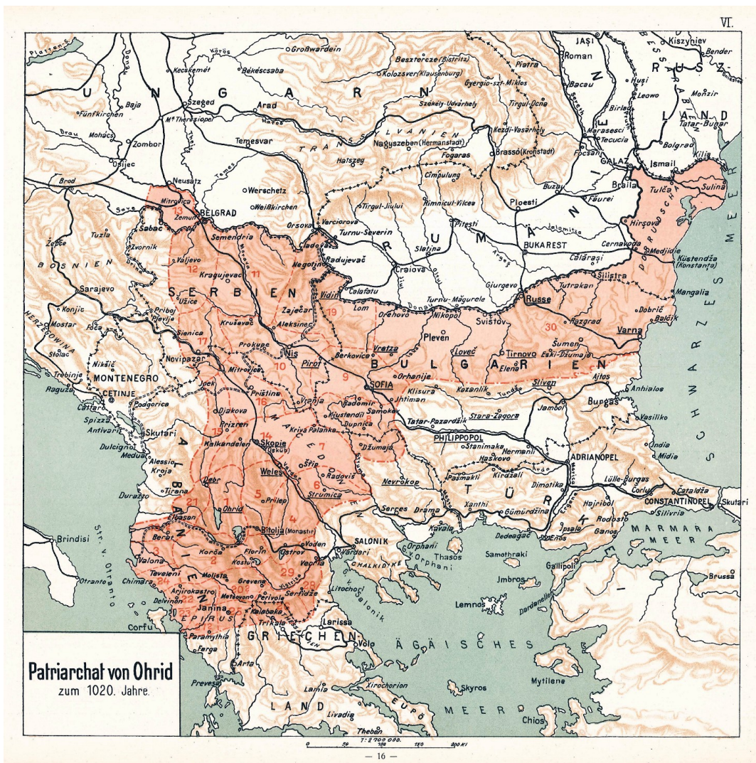
Figure 4 : Étendue présumée de l'archevêché de Bulgarie ( Димитър Ризов, от атласа "Българите в техните исторически, Sofia, 1917, p. VI)

Le territoire des Bulgares apparaît déjà d'un point de vue géographique comme un espace complexe d'une très grande diversité eu égard à son placement et son étendue. Prenons pour exemple les territoires de Macédoine et de Thrace qui étaient les lieux classiques d'affrontements entre les armées byzantines et bulgares. Léon le Diacre relate que plusieurs décennies après la bataille d'Anchialos (917), les environs étaient encore touchés par la présence des restes humains des soldats qui avaient combattu dans ce lieu 187 .