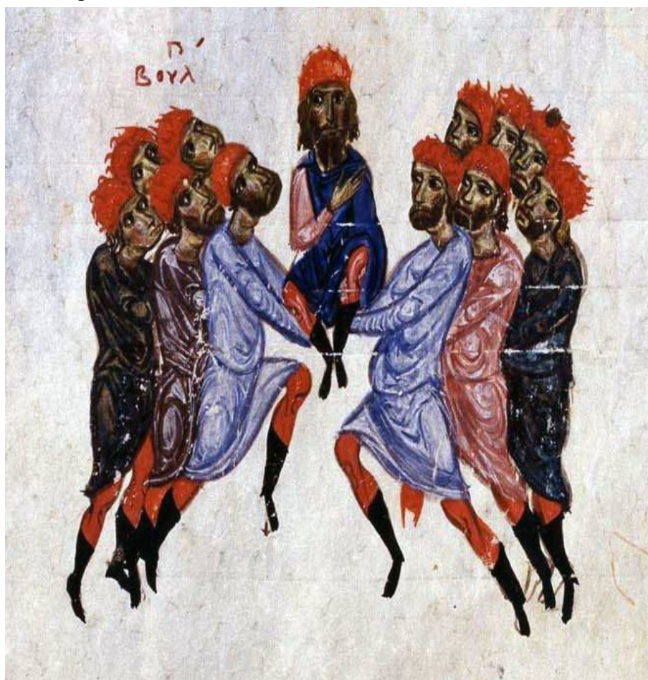
Figure 6 : Deljan est proclamé empereur des Bulgares par les révoltés bulgares. Chronique de Skylitzès de Madrid , Palerme ? (Madrid, Biblioteca Nacional de Espana, Vitr. 26-2, f. 215r)

Le rôle du chef bulgare est central dans ce mouvement ; il doit incarner la continuité dynastique avec l'ancien empire bulgare qui avait été renversé par la puissance byzantine. Les Bulgares apparaissent alors comme un peuple particulièrement attaché au modèle de la royauté par primogéniture masculine. La description du couronnement rappelle ainsi le couronnement des basileus par l'armée.