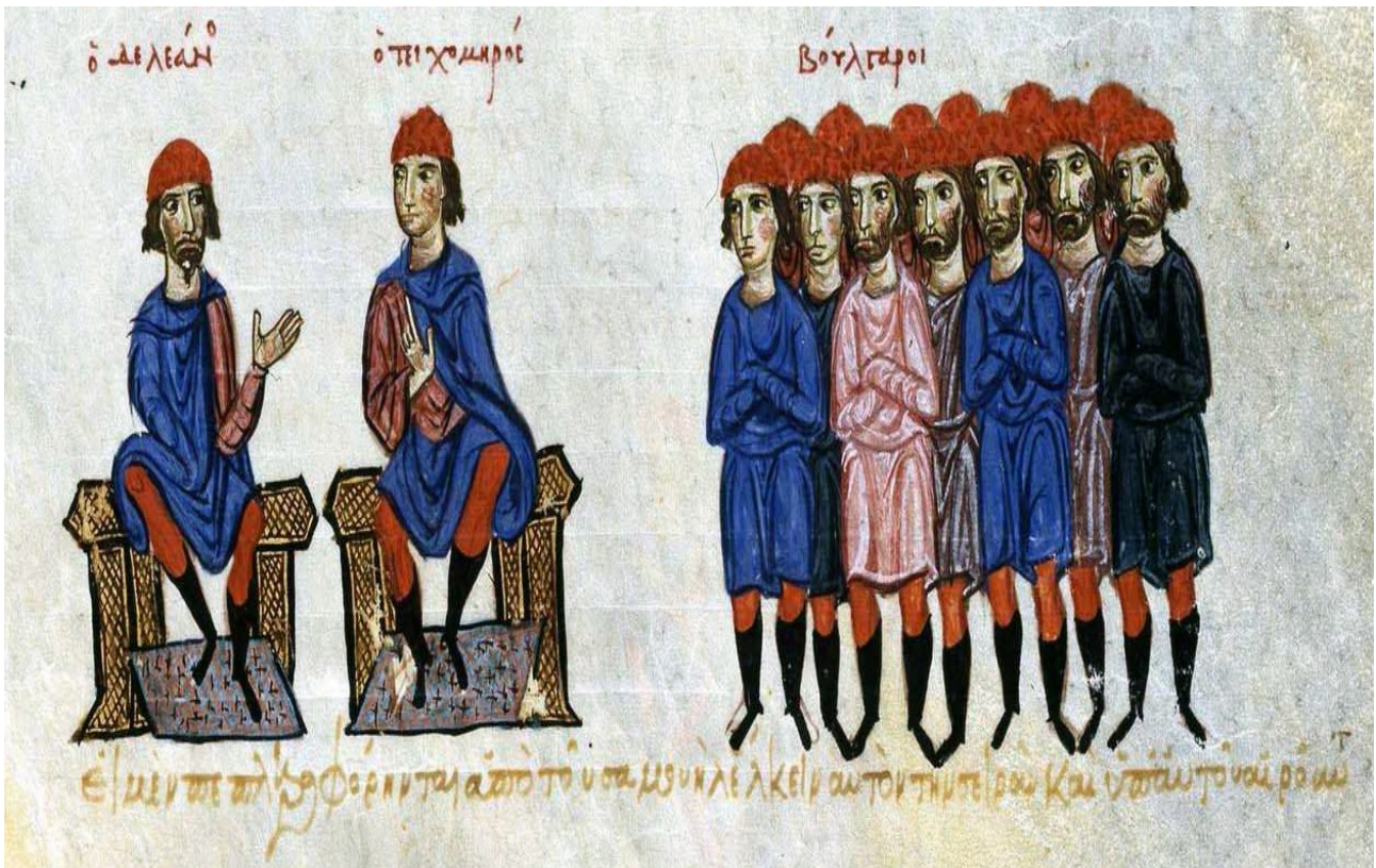
Figure 7 : Pierre Deljan, Teichomèros et les révoltés bulgares. Chronique de Skylitès de Madrid , Palerme ? (Madrid, Biblioteca Nacional de Espana, Vitr. 26-2, f. 215v)

Comme l'indique l'image les chefs bulgares sont considérés grâce au soutien que leur apportent les Bulgares qui sont représentés sur la gauche de notre image. Le regard des notables bulgares est porté vers les deux chefs sur leur trône qui se font face respectivement jusque dans la position symétrique de leur membres respectifs (Deljan, barbu, lève son bras gauche et sa jambe droite, tandis que Teichomèros, imberbe, lève son bras droit et sa jambe gauche). Les notable bulgares sont habillés comme leurs chefs. Ils portent des tuniques de plusieurs couleurs, bien que le bleu domine car elle est la couleur des chlamydes des deux chefs. Leurs jambes sont habillées de pantalons rouges et longues bottines noires. L'élément le plus remarquable est le chapeau conique rouge que portent chacun des Bulgares, un élément déjà présent dans les miniatures précédentes du manuscrit. Le chapeau rouge semble être caractéristique de l'identité bulgare. Cependant, la forme précise du chapeau apparaît seulement dans le manuscrit de Madrid 390 . Les notables bulgares aux bras croisés font ici le choix du souverain unique qui va se porter sur la personne de Deljan qui est face aux Bulgares. Cet acte va entraîner la mort de Teichomèros dont la position est située dos aux Bulgares. Les enlumineurs n'ont pas choisi de représenter la mort de Teichomèros, mais ont avant tout choisi de mettre en scène le moment qui précède son exécution, le moment du choix des Bulgares pour