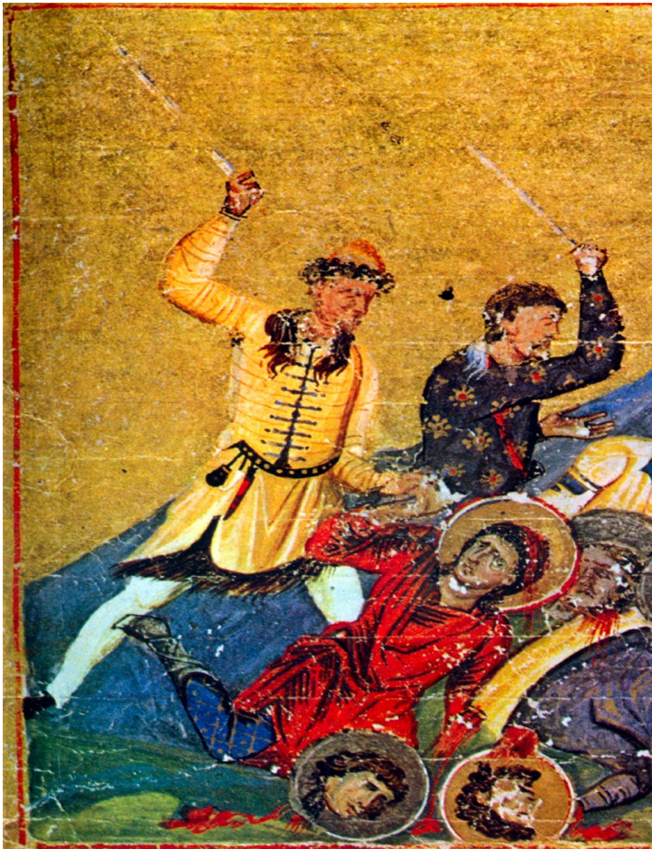
Figure 5 : L'exécution des chrétiens par deux soldats bulgares, Ménologue de Basile II, Constantinople (Vatican, Biblioteca Apostolica Vaticana, MS. Vat. gr. 1613)

Dans une scène d'une grande violence, les enlumineurs ont choisi de représenter les Bulgares comme des êtres essentiellement étrangers, en pleine incarnation de la sauvagerie nomade. Ce lien avec cette zone géographique identifiée pourrait expliquer pourquoi la dénomination scythique a été particulièrement utilisée par les auteurs byzantins pour qualifier leur ennemi. En ce qui concerne l'usage de ce mot, il faut souligner d'autres éléments.